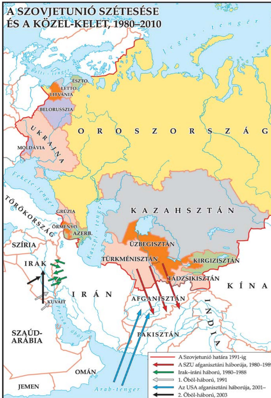
5. számú térkép