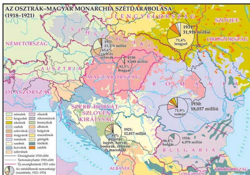
1/a. számú térkép

Térképet mutatok és adatsorokat – csak emlékeztetőül – a Monarchia területén létrejött nemzetállamokról, azok lakosságának nemzetiségi összetételéről: Ausztria, Magyarország, Lengyelország, Csehszlovákia és Jugoszlávia – már amennyiben lehet e három utóbbi államalakulatot nemzetállamnak nevezni –, és emelkedik középhatalommá az 1859-ben a Török Birodalomból létrehozott Románia a Magyar Királyságból kiharított Erdéllyel, valamint az Orosz Birodalomból megszerzett Besszarábiával. Hozzá csatolva a Német Birodalom felosztását bemutató térképet, amely felosztás hatást gyakorolt a volt Monarchia utódállamainak alakulására is. (1/a. térkép: Az Osztrák–Magyar Monarchia szétदारabolása. 1/b. térkép: Németország 1918–1921.)