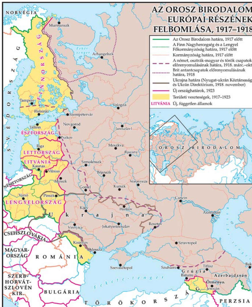
2/a. számú térkép

a szomszédos területeket. És a területszerzéseknek a háború a XVIII–XX. században elfogadott eszköze volt. Tegyük hozzá: az így megszerzett új területeken rendszerint más nemzetiségűek is éltek. E kisebbségek elnemzetlenítése a XIX. század egyik nagy „európai politikai programja” volt... És nem csak Kelet-Európában... Egészen a XX. századig, amikor a kisebbségi nemzeti identitás megélése emberi joggá lett, lesz...)