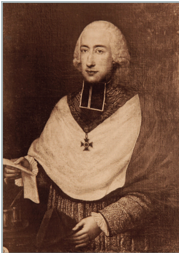
Herzan Ferenc (1735–1804)

A mint ismeretes, a szombathelyi püspökséget 1777-ben alapították. Létrejött az azon egyházi reformintézkedések egyike volt, melyeket Magyarország királynéja, Mária Terézia hozott, és négy új egyházmegyével (a besztercebányai, a rosznyói, a székesfehérvári és a szombathelyi) gazdagította a Magyar Katolikus Egyház szervezetét. Egyházi és politikai szerepén kívül az új püspökség megtermékenyítőleg hatott a helyi szellemi életre is, amelynek legfontosabb központjává az újonnan alapított szeminárium és a hozzá tartozó Egyházmegyei Könyvtár vált. A könyvtár legfigyelemreméltóbb gyűjteménye szintén ekkor keletkezett. A második szombathelyi püspök, Harrasi Herzan (eredetileg Hrzan, illetve Hersan) Ferenc bíboros páratlan magánkönyvtáráról van szó, amelyet a főpásztor halála után a püspökség örökölt.