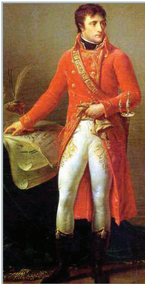
Bonaparte Napóleon (1769–1821)

A szombathelyi püspöki széket meglehetősen megromlott egészségi állapotban foglalta el. Életének utolsó négy esztendején át viselte a püspöki címet és jelentős mértékben hozzájárult a szemináriumi szigor megerősítéséhez és az idegen nyelvek oktatásának fejlesztéséhez. Herzan életének végét alapvetően meghatározta a politikai helyzet megváltozása, másrészt pedig a bíboros súlyos betegsége, amelynek következtében hosszú szenvedések után 1804. június 2-án hunyt el Bécsben. Halála után a könyvtára Szombathelyen maradt, a levelezését és fontosabb iratait pedig a bécsi császári levéltárban helyezték el. Ez utóbbi kéziratgyűjtemény egyik érdekes dokumentuma viszont – eddig ismeretlen