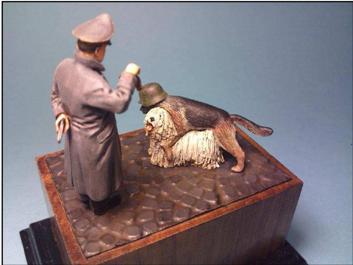
A Proli Depp Illuminárium blog „alternatív emlékműterve”. (Uo.)

A német megszállás évének számos tanulsága fogalmazható meg. A magyar felelősség, az állami szuverenitás és a lehetséges mozgástér kérdésében világosan látszik, hogy a kép ezúttal sem fekete vagy fehér, nem adható igen/nem típusú válasz ezekre a kérdésekre. A felelősség ugyanis megoszlott az egyes szereplők között, igaz nem azonos mértékben. A magyar állam szuverenitása pedig nem szűnt meg teljesen, hanem korlátozottá vált.