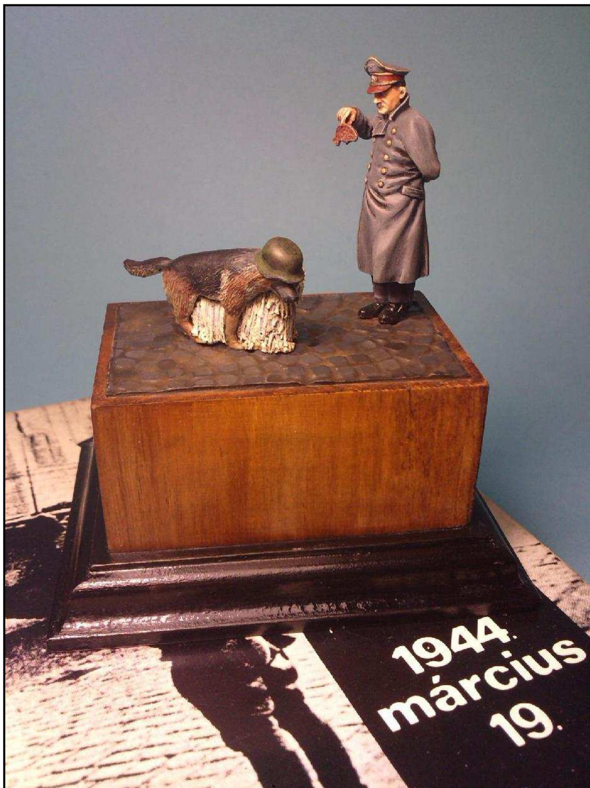
A Proli Depp Illumináriuma blog „alternatív emlékműterve”. (Eredeti megjelenés és szöveges leírás: http://prolidepp.tumblr.com/post/80056927088/a-nemet-megszallas-igaz-tortenete-vegyes )