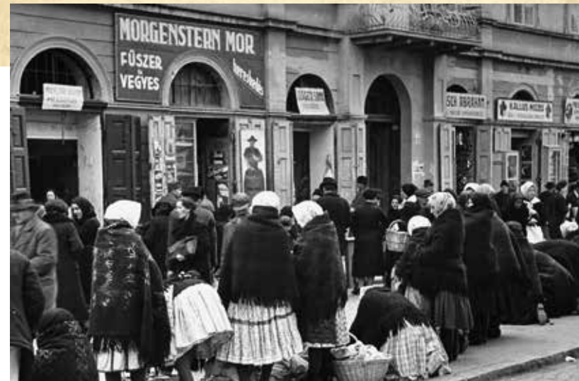
Utcaképek a sok-nemzetiségű és több felekezeti csehszlovákká lett városból

A MONARCHIA felbomlása, Magyarország önállósodása, az első világháborút lezáró párizsi béketárgyalások állandó napirenddé tették a nemzetiségi kérdéseket. Az 1910-es népszámlálás adatai szerint az ország népességének alig több mint a fele volt magyar anyanyelvű. Károlyi Mihály kormánya már működésének első napjaiban megadta a felhatalmazást Jászi Oszkárnak a nemzetiségi minisztérium megalakítására. Jászi úgy vélte, hogy a nemzetiségi területek kantonokra, illetve a nagyobb nemzeti régiók föderatív kormányzati területekre osztásával sikeres lehet a magyar-