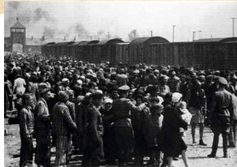
Kárpátalja lakosságának 14 százaléka zsidó származású volt. A deportálások itt kezdődtek, és túlnyomó többségüket Auschwitzba hurcolták. Képviselet kárpátaljai zsidók érkezése a megsemmisítő táborba

Míg Magyarország 1920-ban hermetikusan lezárta a határait a zsidó bevándorlás előtt, addig Csehszlovákiába nagy számban érkeztek Lengyelországból és a Szovjetunióból. 1921-ben Kárpátalján 80 ezer főt meghaladó, a lakosság közel 14 százalékát kitevő zsidó lakosságot regisztráltak. 1930-ra a zsidóság lélekszáma 90 ezer fölé nőtt, megtartva a mintegy 14 százalékos részarányt. Több mint kétharmad-