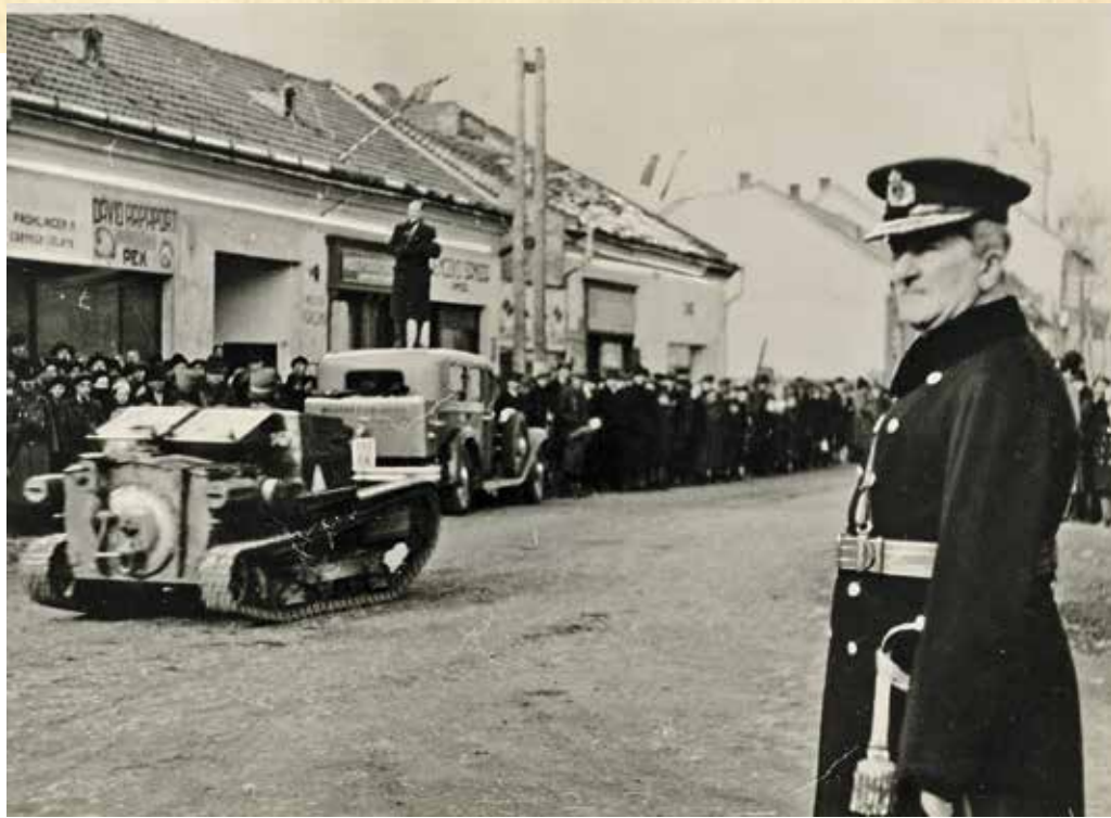
Horthy Miklós kormányzó megtekinti a Kárpátalja bevonuló csapatokat 1939. március 15.

A kárpátaljai etnikai viszonyokat befolyásolta továbbá a földreformmal összefüggésben végrehajtott ún. kolonizáció – a többségi lakosság képviselőinek államilag szervezett, nemzetpolitikai célú betelepítése a kisebbség, adott esetben a magyarok által lakott területekre. Csehszlovákiában a telepítések 1921 nyarán kezdődtek el. Az etnikai viszonyok megváltoztatásának szándékán túl a telepítéspolitikában meghatározó szerepet játszottak a katonai szempontok is. A kolonisták három csoportba sorolhatók: az országban élő, önként jelentkező csehek, szlovákok, morvák, ruszinok; repatriáns (külföldről hazatelepülő) szlovákok és csehek; valamint a legionáriusok. A legionáriusok az első világháború idején az antant kötelékében harcoló cseh-szlovák katonai egységek tagjai voltak. Szerveződtek ilyen egységek Franciaországban, Olaszországban, Oroszországban. Az olaszországi és a franciaországi légiók hazatértük után jelentős szerepet játszottak az észak-északkelet-magyarországi vármegyék katonai megszállásában; 1919 januárjában Ungvárra is olasz egyenruhás katonaság vonult be. A hazatérő legionáriusok is jelentkeztek telepesnek. A legionárius telepek a fontosabb vasúti csomópontok mellett jöttek létre, abból a logikából eredően, ami a trianoni határmegvonást is motiválta: biztosítani és immár telepes falvak által is védelmezni a kisantant államainak vasúti összeköttetését.