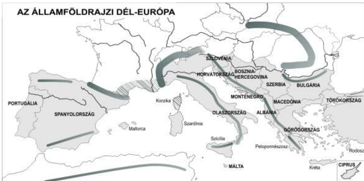
1. ábra: A vizsgálatban alkalmazott Dél-Európa lehatárolás. Szerk.: Pap N. 2007

A kutatás keretében igyekeztünk feltárni az érintkezési pontokat, a meghatározó folyamatokat. Megközelítésünk geográfusi és nem kultúrtörténeti. Nem az eseteket kerestük, hanem a térbeli folyamatokat elemeztük, a földrajzi mintázatokat igyekeztünk megrajzolni, mellette pedig a térben kapcsolódó társadalmak (elsősorban a kitüntetett figyelmet kapott olasz és a magyar) eltérő térélményét, percepcióját is összevetettük. Szükséges volt időbeli kereteket is megszabni. A legszűkebben vett vizsgálat mintegy 20 évet fogott át, 1986-tól 2005-ig terjedően. Így a magyar rendszerváltozás, valamint az euro-atlanti integrációs folyamat időszakában tudtunk képet kapni, illetve adni a változásokról.