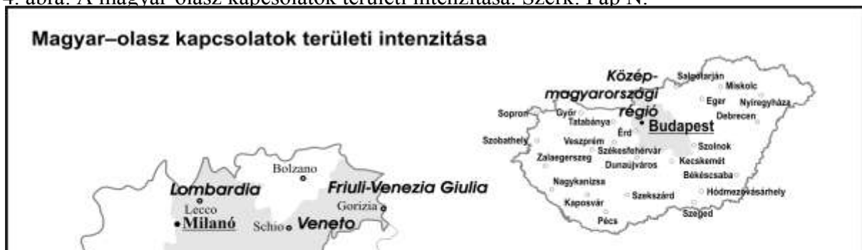
4. ábra: A magyar-olasz kapcsolatok területi intenzitása. Szerk: Pap N.

A magyar városhálózatban kiemelt csoportot, az ún. megyei jogú városok képeznek. Ez a város csoport jelenik meg a nemzetközi-kapcsolati területen. Külkapcsolataikban az olasz települések súlyát az alábbi ábra mutatja be. Sajátos következtetés, hogy kapcsolataikban – és a legjelentősebb magyar városok körében – az Emilia-Romagna-i települések dominálnak. A 14 jelzett kapcsolat fele ennek a régióknak a településeivel kötött. A további kapcsolatok is ugyanazon észak-olasz és középső fekvésű települési csoportban, illetve régióban jelentkeznek (Friuli-Venezia-Giulia, Veneto, Lombardia, Trentino Alto-Adige), amelyben a gazdasági kapcsolatok.