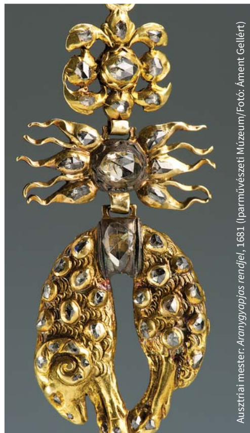
Ausztriai mester: Aranygyapjas rendjel, 1681