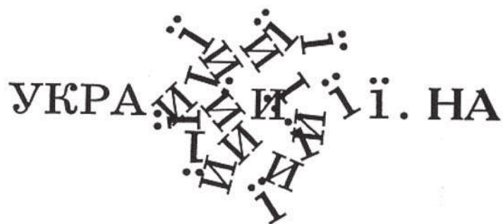
1. ábra. Mikola Szoroka Ще не вмерла Україна ( Még nem halt meg Ukrajna ) című munkája

A Kijevi Nemzetközi Szociológiai Intézet 2003-ban egy országos kutatás keretében feltárta, hogy Ukrajna különböző régióban más-más nyelv használata dominál a mindennapokban. Nyugat-Ukrajnában és az ország középső részén egyértelműen az ukrán a leggyakrabban használt nyelv. Északkeleten kissé az orosz felé billen a mérleg nyelve, és sokan használják a szurzsikot. Kelet- és Dél-Ukrajnában azonban az ukrán nyelv használati aránya nagyon alacsony, az orosz messze a leggyakrabban használt nyelv. A 2. táblázat ennek a szociológiai kutatásnak az adatai alapján vázolja fel az ukrán–orosz kétnyelvűség mértékét, az ukrán és az orosz nyelv funkcionális megterheltségét. Az adatok alapján egyértelmű, hogy Ukrajnában mind az orosz, mind az ukrán nyelv használati köre széles, a társadalom jelentős része mindkét nyelvet használja (lásd még Aza 2007, 2009, Alekszejev 2008, Medvegyev 2007, Sulha 2008, Visnyak 2007, 2008 stb.). 1