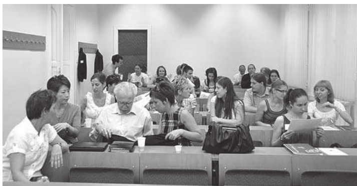
Az egyik szekció résztvevői