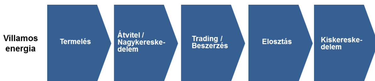
1. ábra – A villamosenergia-piaci értéklánc