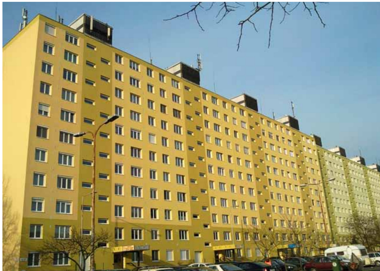
Mintaprojekt a főváros XIII. kerületében

Minden feltétel adott ahhoz, hogy Magyarországon is elterjedjen az épületek fűtésének-hűtésének energetikailag leghatékonyabb módszere, a hőszivattyús technológia. Cikkünkben egy frissen megvalósult projekt egyéves tapasztalatairól számolunk be.