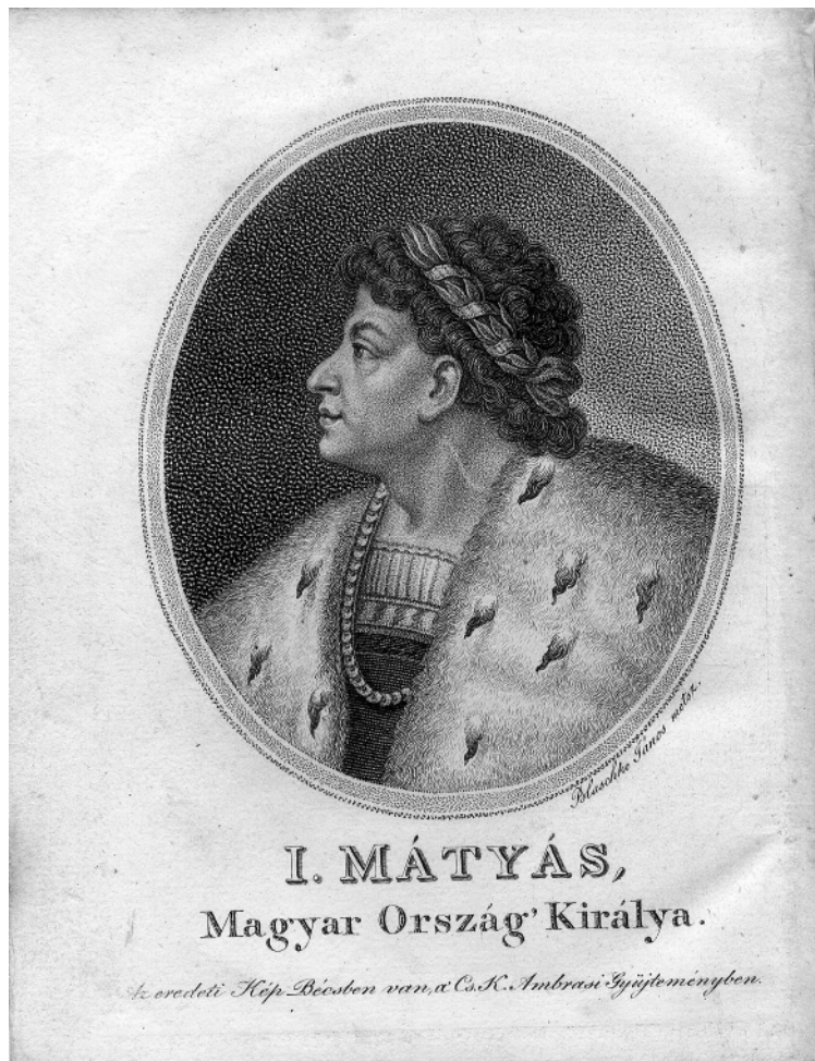
I. MÁTYÁS, Magyar Ország' Királya.

A eredeti Kép Bécsben van, a Cs. K. Ambrasi Gyűjteményben.