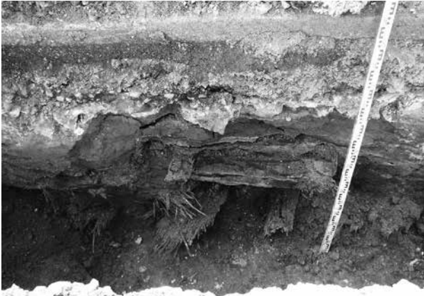
9. kép: Simontornya, Mátyás király utca: gerendaút merőlegesen egymásra fektetett gerendái