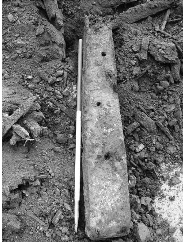
10. kép: Simontornya, Mátyás király utca: a gerendaút egyik gerendája