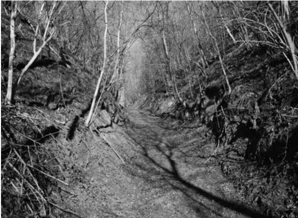
6. kép: Szakály, Lámpás-hegyi horhó: az 1783-ban via antiqua -ként jelölt út napjainkban