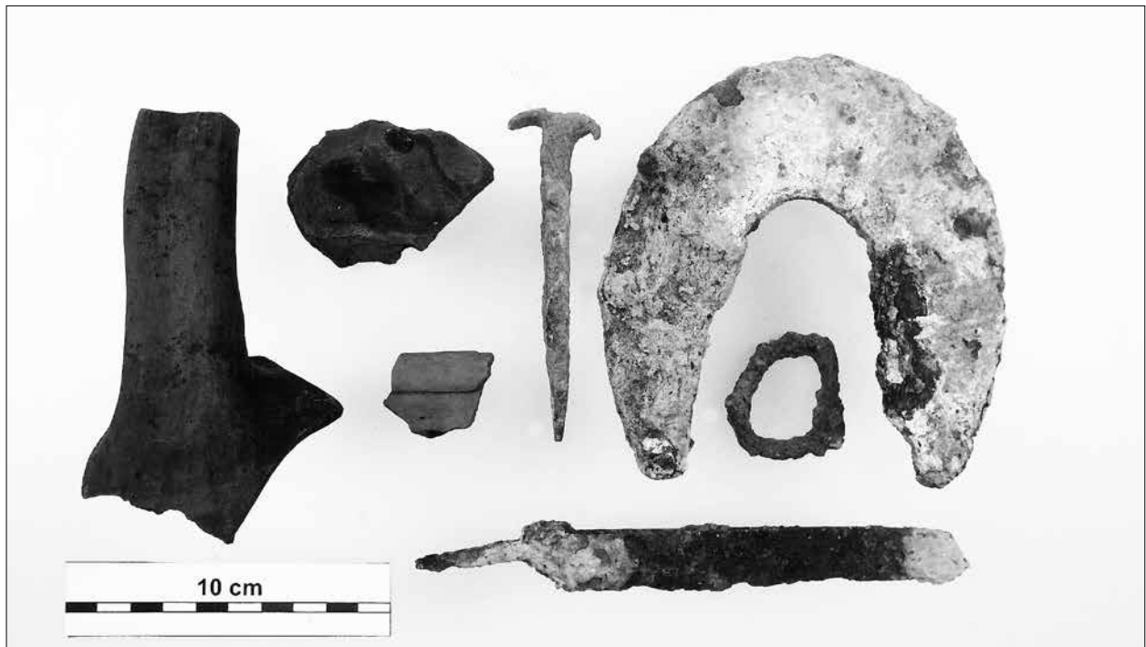
11. kép: Simontornya, Mátyás király utca: leletek a gerendaút feletti rétegből

Simontornya központi része a középkorban a Sió egyik szigetén feküdt, amelyet Fejér és Tolna megye irányából is híd kötött össze a szárazfölddel. A város 1938-ban megjelent helytörténeti monográfiája a mai fő utca nyomvonalán mindkét híd régészeti maradványait említi, az általunk megfigyelt szakaszon „egy méter mélységben még padlódeszkák is tűntek elő”. 71 Kiss István számos adatot idéz 1714-től kezdve a hidak javításáról, a szükséges gerendák beszerzéséről. A padlóburkolatot írott forrás is említi: 1745 körül arra panaszkodnak, hogy a padlók hiányos volta miatt sok jószág a lábát töri. 1754-ben a híd három szakaszból állt. Az „alsó híd” pontosan megfeleltethető az általunk megfigyelt útszakasszal, akkoriban ez „a zárdaudvar déli sarkától a mai alsóvárosi hídfőig” húzódott, „két szakaszból állt, az első 12 hídlábon, a második 7 hídlábon feküdt, 38 öl hosszúságban, közben feküdt 14 öl szélességben a sziget”. 72 Bár az építményt a 18. századi források hídnak nevezik, ezek lényegében a vizenyős területeken keresztül vezető, gerenda-alapozású, deszkaburkolatú útszakaszok voltak, amelyeket legkésőbb a hódoltság korától a folyószabályozásig, az 1810-es évek végéig használtak az egykori szandzsákszékhelyen.