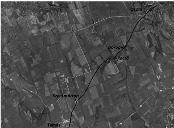
4. kép: A Tamási és Ozora közötti, részben középkori vonalvezetésű mai dűlőút, a mellette fekvő középkori egyházas helyekkel (Alaptérkép: Google maps; rajz: K. Németh András)