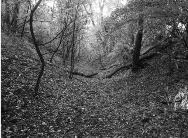
2. kép: Tengőd, Bati-erdő: a falubelyről a templom dombjához vezető út