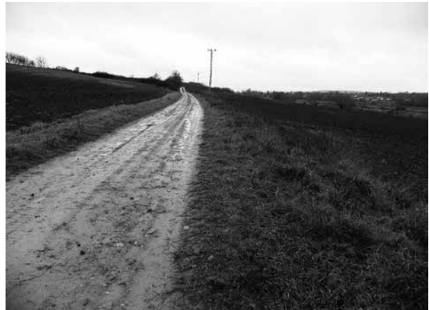
8. kép: Törökkoppány, Csausz útja: az út Törökkoppány előtti szakasza

Szakcs határában egy 1822-es határjárás során említik a Csausz útját Szakcs, Szántó és Törökkoppány hármashatára közelében. 61 A Pesty Frigyes-féle helynévgyűjtésben így nyilatkoztak róla: „az i [Plamurdok] és k [Grablik] alatt említett erdő részeken, a szomszéd Török Koppány, Somogy megyei helység határához vezető erdei út (nem közlekedési) elnevezése nagyon valószínű, hogy még a töröknek Magyarországoni uralmának idejéből veszi eredetét”. 62 Az út folytatása a szomszédos Törökkoppány délkeleti határában található, ahol a helynév ma is él, Szakcsi útnak is nevezik. A követ, hírnök, levélvivő értelmű csausz szó alapján valószínűsíthető az út hódoltságkori eredete, déli iránya alapján Pécsre vagy Szigetvárra vezethetett. 63 Az út nyomvonala a helynév alapján sajnos csak nagyjából 2 km hosszan azonosítható (8. kép), majd az erdőben – ahol számos vízmosás talán egykori mélyutakra utal – több ágra szakad.