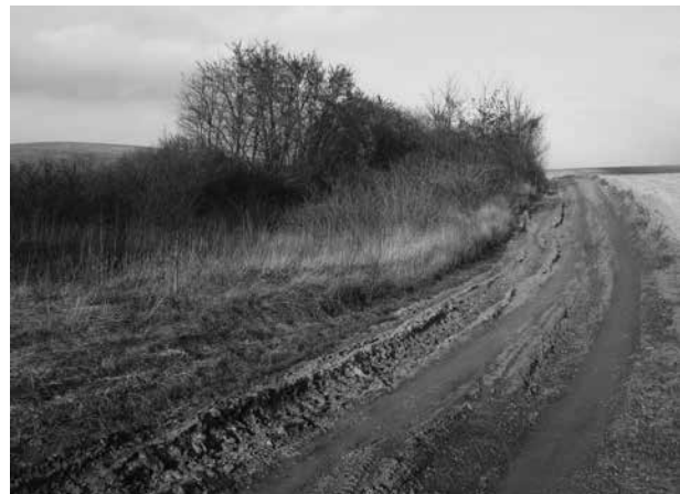
5. kép: Tamási, Ozorai út: a dűlőút bemélyedő, felhagyott szakasza

A szintén elpusztult Biród falu temploma (Gyulaj–Pogány-templom) a gyulaji erdő délkeleti szélén fekszik, az erdő a legalább a 18. század óta kerítéssel körülvett hercegi, majd állami vadászterület. A templomhelytől északra 100 m-re egy északnyugat–délkelet irányú, egy 600 m hosszú, enyhén, legfeljebb 1 m mélyre bevágódott, ma már nem használt, kerítéssel kettévágott, részben fákkal benőtt, valószínűleg középkori eredetű út húzódik, amely a templomtól északnyugatra 300 m-re befut abba a ma is használt dűlőútba, amely a gyulaji erdő Pári felé nyíló kapujáig vezet (3. kép). Az út érdekessége, hogy egy 70 m hosszú szakaszon nemcsak maga az út, hanem a belőle kiágazó, majd bele visszacsatlakozó, sekélyebben bevágódott mellékága is követhető, utóbbi bizonyára egy időszakosan használt kerülőút lehetett (1. tábla 1). 42