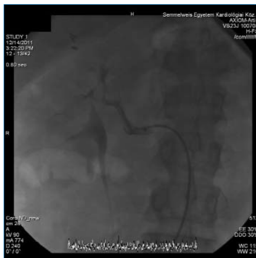
2. ábra: Renális denerváció intraoperatív képe

A publikált vizsgálatok adatai alapján a renális denerváció alkalmazható, ha a szisztolés vérnyomás legalább három különböző hatástani csoportba tartozó antihipertenzív szer (amelyek közül egy diuretikum) maximálisan tolerálható dózisa kombinációjával sem csökkenthető 160 Hgmm (diabétesz esetén 150 Hgmm) alá (3). A vesefunkciónak a számított GFR alapján meg kell haladnia a 45 ml/min/1,73 m 2 értéket. Kontraindikációt jelent az a. renalis nem megfelelő anatómiája, valamint nem végezhető el a beavatkozás aneurizma, korábbi artériás intervenció és szignifikáns renális ateroszklerózis (50%-nál nagyobb szűkület) esetén sem. Ezért abláció előtt az a. renalisok ábrázolására alkalmas képalkotó vizsgálat elvégzésének kiemelt jelentősége van (CT, MR vagy invazív angiographia). A betegeknek klinikailag stabil állapotban kell lennie, hipertenzív krízis, 3-6 hónapon belüli kardiális vagy cerebrovaszkuláris esemény is ellenjavallati tényező. A beavatkozást tapasztalt, renális intervenciókban jártas