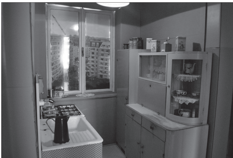
„A '70-es évek végén felköltöztem a szép új blokkba, a városi kényelembe”

A magyar muzeológia ritkán vállalkozott egy-egy személy életútjának bemutatására. Elsősorban egy-egy neves személyiség emlékének szentelt emlékszoba vagy emlékház kiállításai tekinthetők olyasfajta kísérleteknek, amelyek – elsősorban személyes dokumentumok és tárgyak segítségével – megpróbálnak egy-egy életpályát