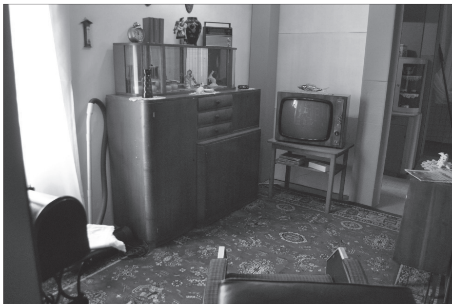
„Hallgatom a rádiót, nézem a tévét; né, épp most mondják, hogy nagy cirkusz van Temesváron s Bukarestbe – úgy látszik, van, akinek ez az élet se tetszik”

A kiállítás nem egy konkrét személy életútjának bemutatására vállalkozik, de olyan életút-konstrukciót hoz létre, olyan tipikus, vagy éppen ellenkezőleg: sajtóságos élethelyzetek sorozatából építkezik, hogy az így létrejött életút már valóságosnak hat, úgy tetszik, hogy akár meg is történhetett volna. Annak ellenére, hogy a bemutatott életút több ponton is tartalmaz olyan mozzanatot, amelyek a hagyományos paraszttársadalomban normaszegésnek számítanak, nem tekinthető kivételesnek vagy különlegesnek, inkább csak – mint minden egyéné – sajtóságosnak mondható (vö. Keszeg 2012: 197.). Az, hogy a kiállítás során az életút bemutatása egy adott ponton két szálra szakad, és két történet fut párhuzamosan, azt jelzi: annak ellenére, hogy a hagyományos paraszttársadalom kitermel és mozgásban tart bizonyos számú életút-modellt, az emberélet sorsfordító pillanataiban, az egyént ért sorstragédiák valós enyhítésére/orvoslására a helyi társadalomban nincsenek kéznél intézményes megoldások. Az egyén nem rendelkezik valóban hatékony életpálya-építési kompetenciákkal.