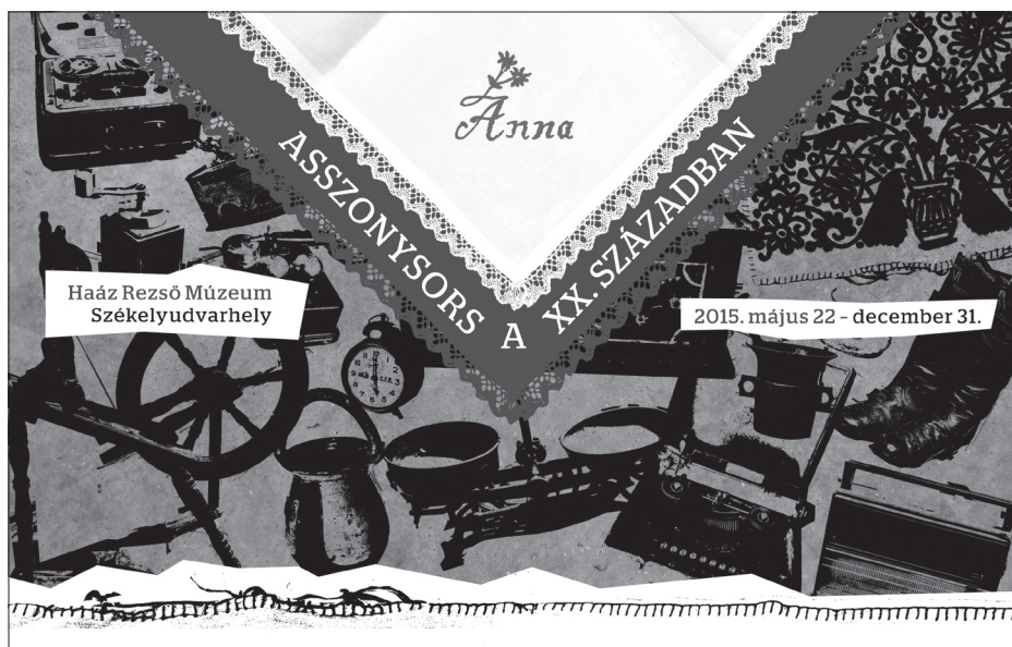
A kiállítás plakátja

2005 Az írás szerepe egy asszony életében. In: Keszeg Vilmos: Specialisták.