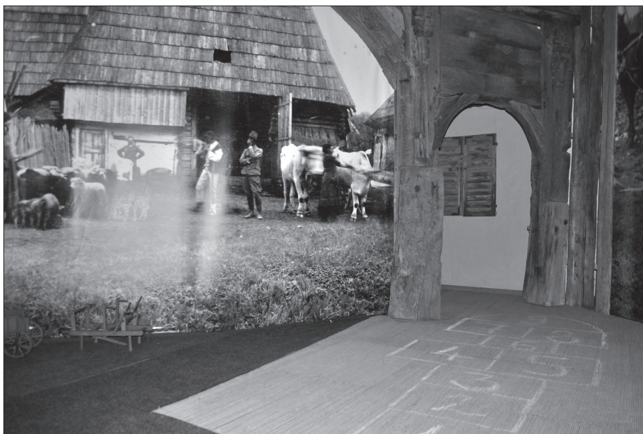
„Az utca gyermekeivel sokat henteregtünk a házunk előtt a libalegelőn, a nyári csepergő után gyűrtük a sarat a kapu előtt meztláb”

A kiállítás a Haáz Rezső Múzeum öt emeleti termében, mintegy 120 négyzetméternyi felületen mutatja be Anna életútjának fontosabb fordulópontjait. Az első terembe lépve egy székelyföldi falu utcáján találjuk magunkat. Szemközt faragott székelykapu, amely már a Múzeum korábbi néprajzi kiállításában is szerepelt, de ebben a kontextusban is hasznosíthatónak bizonyult. A nyitott kapun át egy hagyományos székelyporta udvarára látni rá. Jobb oldalt