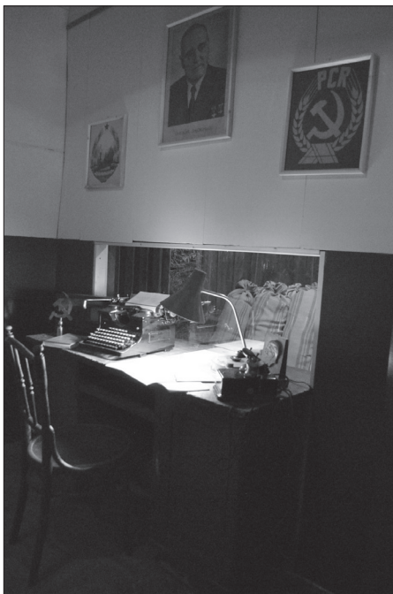
„Reggeltől estig listákat írtam; most láttam, hogy a kapzsi kulákok mi földet elvettek vót a szegén néptől!”

Tátrai Zsuzsanna egyik kötetében a leányéletet elemzi. Kötetében kitér a lányok korcsoportjainak bemutatására, a nagylánnyá válás velejáráira, az udvarlás és a férjhezmenetel idejére, a lánynak a faluközösségben és a családban betöltött szerepének elemzésére,