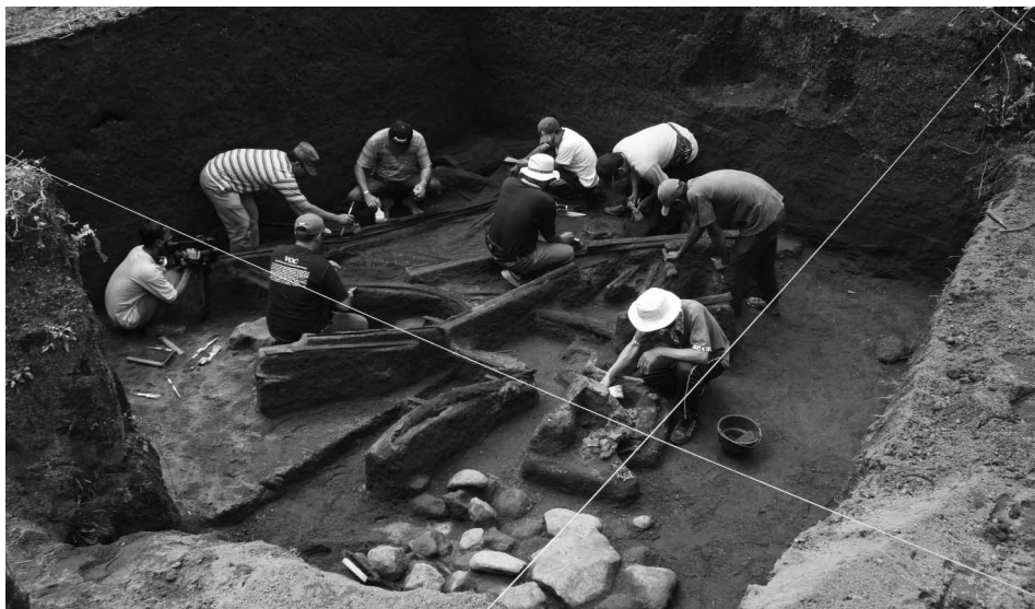
2. ábra • Az ásások során 2–3 m vastag vulkáni hamuüledék alatt feltárultak „Tambora elvesztett királyságának” maradványai; akárcsak Pompejiben, itt is épen maradt házfalak, az utolsó pillanat testtartásában lévő emberek tetemei és sok eszköz került elő (fotó: Indyo Pratomo).

zett (a kirobbanó, felfújtt magmahab megszárdult képződménye, a horzsakő, aminek térfogata több mint háromszorosa a megfelelő magma térfogatának). Ez azt jelenti, hogy a kitörés nagysága a VEI robbanásossági skálán elérte a 7-es fokozatot, és ezzel a történelmi idők legnagyobb ismert vulkáni működése. A kitöréshez kapcsolódó globális éghajlatváltozásért azonban nem ez az óriási, levegőbe került vulkáni hamutömeg volt a felelős! A kitörő magmával 55 millió tonna kén-dioxid jutott a légkörbe, és mivel a vulkáni hamufelhő a sztratoszférát is elérte, így jórészt a magasabb légrétegekbe került. A kén-dioxid a vízgőzzel reagálva kénsav-aeroszollá alakult, ami azt jelenti, hogy több mint 100 millió tonna kénsav-aeroszol anyag terült szét a sztratoszférában. Néhány óra alatt ekkora gáztömeg – vajon mit is jelent ez? Európa teljes ipari kén-dioxid-kibocsátása 14 ezer tonna naponként, azaz a Tambora kitörése során néhány