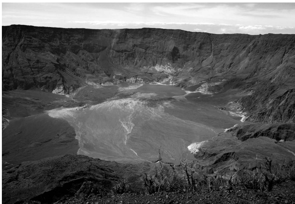
3. ábra • A Tambora hatalmas, égbe nyíló szája, a vulkánkitörést követően visszamaradt széles kaldera részlete

óra alatt több kén-dioxid zúdult a légterbe, mint Európában tíz év alatt! A Föld globális kén-dioxid-kibocsátása a 2006-os igen magas szennyezési időszakban sem érte el a 33 millió tonnát! A magaslégtérben lévő kénsavaeroszol-felhő visszaveri a Nap sugarait, és elnyeli a Földről érkező infravörös sugárzást, aminek az eredménye egyrészt az, hogy a földfelszín hőmérséklete lecsökken, a sztratoszféra viszont felmelegszik, ami alaposan megváltoztatja a magasban zajló légközést, és többek között befolyásolja a monszont is. Egy trópusi területen bekövetkező ilyen nagyságú vulkánkitörés következményei pedig már globálisak. Ez a hatalmas kén-dioxid-kibocsátás járult hozzá az 1816-as „nyár nélküli évhez”, az 1810-es évek második felének anomális időjárásához, amikor a globális átlaghőmérséklet több mint 1°C-kal csökkent.