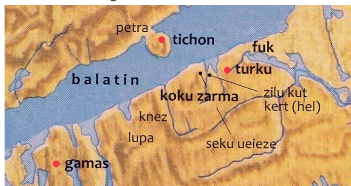
1. kép. A Tihanyi alapítólevélben említett helyek (részlet).

HOFFMANN ISTVÁN feltevése igen megalapozottnak tűnik, miszerint ezt a birtokot is itt, a Balatonhoz közel kell keresnünk: „ha (...) hinni lehet annak, hogy a leírás végig a teljes bizonyossággal lokalizálható (...) Fuk–Turku–Koku zarma–Keuris tue–Gamas útvonal mentén halad (...) a Balaton déli partján (...), akkor esetleg ezen a vidéken kell keresnünk lupa helyet” (2010: 94). Térképén — bizonytalanként — Teleki vidékére helyezi (2010, térképmelléklet), ahol egyébként az apátság — az 1211-es Tihanyi összeírástól kezdve dokumentálhatóan is — valóban volt érdekeltje.