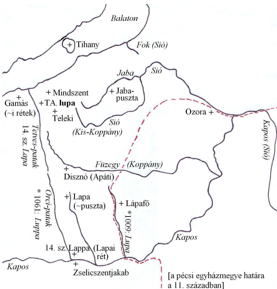
3. kép. Az alapítólevél lupa szórványának földrajzi azonosítása során felmerült fontosabb helynevek vízrajzi térképvázlaton.

Hasonlóképpen figyelemre méltó, hogy a Balatonba torkolló Tetves-patak forrása mellett, Vádépuszta határában, a Vádéi-erdőben ered az Orci-patak, amely ellenkező irányba folyva a Kaposba ömlik, s amelynek a neve (a zselicszentjakabi alapítólevélben) hasonlóképpen Luppa . Nem lehetetlen tehát, hogy eredetileg, a 11. század közepén a Tetves-patak, majd folytatásaként az Orci-patak medrét végig, a Balatontól a Kaposig Lupá -nak (majd később Lapá -nak) nevezték.