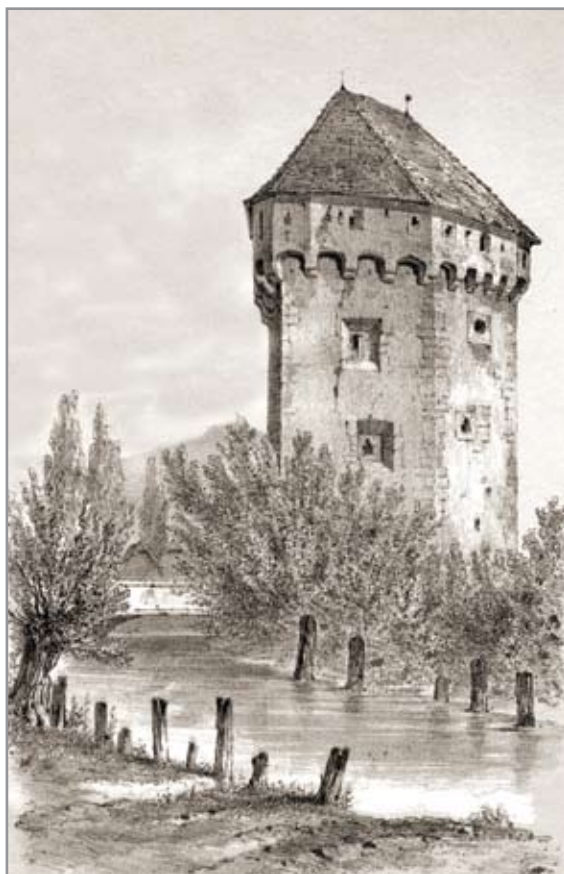
Az Ötvösök tornya (Jakab Elek)

A Szűcsök és Kovácsok tornya közötti várfalszakasz építési emléktáblája 1581-ből Báthory Kristóf címerével (Erdélyi Történeti Nemzeti Múzeum, Fotó: Lupescu Radu) balra