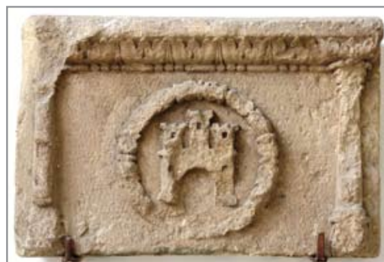
Kolozsvár címeres emlékkő a várfalból (Erdély Történeti Nemzeti Múzeum, Fotó: Lupescu Radu)