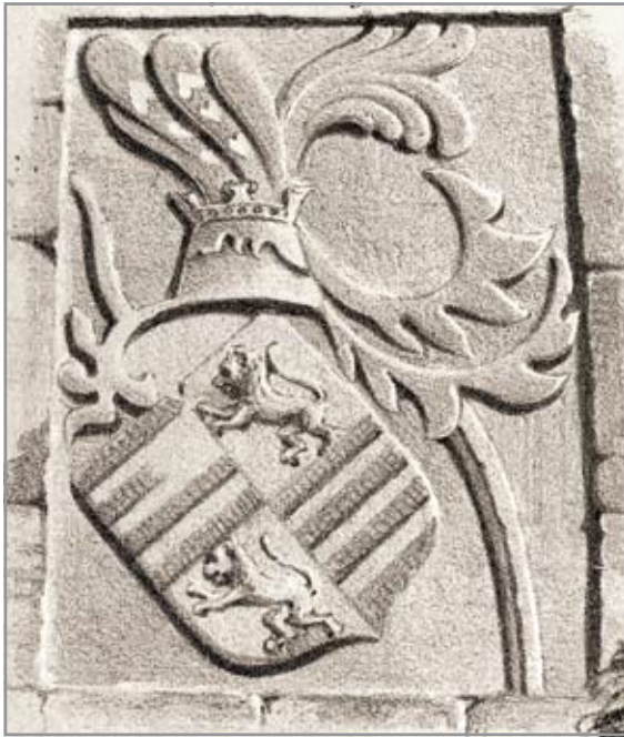
A Magyar utcai kaputorony

Mátyás király tiszteletére elhelyezett címeres emléktábla 1476- ból a Monostor utcai kaputornyon (John Paget rajza alapján készült metszet Jakab Eleknél)