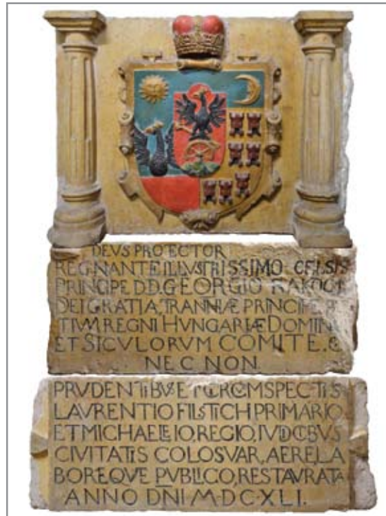
A Kovácsok és Ötvösök tornya közötti várfalszakasz újjáépítési emléktáblája 1641-ből II. Rákóczi György erdélyi fejedelmi címerével (Erdély Történeti Nemzeti Múzeum, Fotó: Lupescu Radu)

NAGYAJTAI KOVÁCS ISTVÁN: „Vándorlások Kolozsvár várfalai körül.” Nemzeti Társalkodó 1840. II. félév. 41-46, 57-62, 65-72, 73-76.