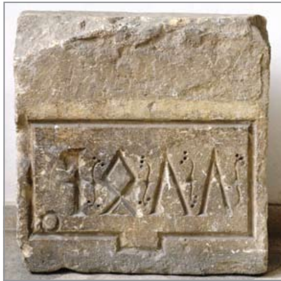
Évszám felirat 1477-ből a Híd utcai kaputorony előkapuján (Erdély Történeti Nemzeti Múzeum)

tábláról van szó, ami úgy tűnik nagy vitákat váltott ki elhelyezése pillanatában. A magyar és szász lakosú városban a paritás elvére roppant érzékeny szász tanácsosok nehezményezték a csak magyar nyelvű emléktáblát, és egy hasonló jellegű német nyelven megfogalmazott szöveg elhelyezését is követelték, ami úgy tűnik végül nem valósult meg. Minden esetre tanulságos helyzetről van szó, ami rávilágít az emléktáblákkal szemben tanúsított elvárások bonyolult rendszerére, amiben nem csak formai, tartalmi és pozicionálási, hanem nyelvi szempontok is közrejátszottak.