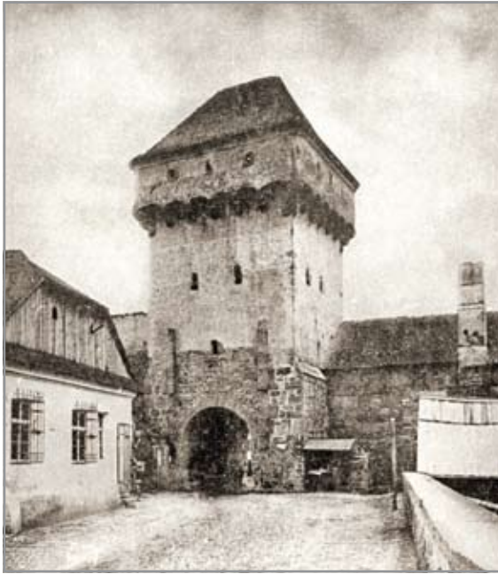
A Híd utcai kaputorony

Mátyás király tiszteletére elhelyezett címeres emléktábla 1476- ból a Monostor utcai kaputornyon (John Paget rajza alapján készült metszet Jakab Eleknél)