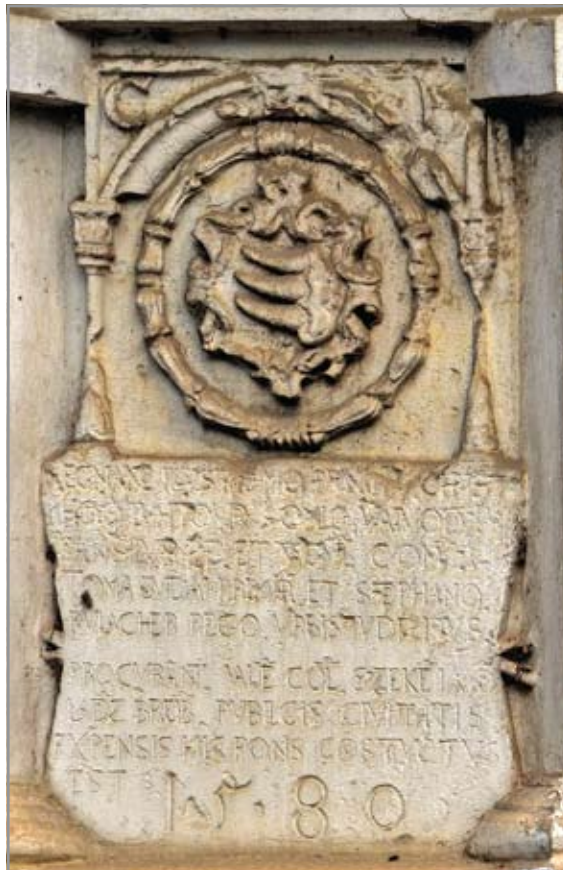
A Híd utcai kaputorony előtti híd építési emléktáblája 1580-ból, Báthory Kristóf címerével

A Báthory Kristóf korabeli címeres emléktáblához hasonlót helyeztek el egy évvel később a nyugati