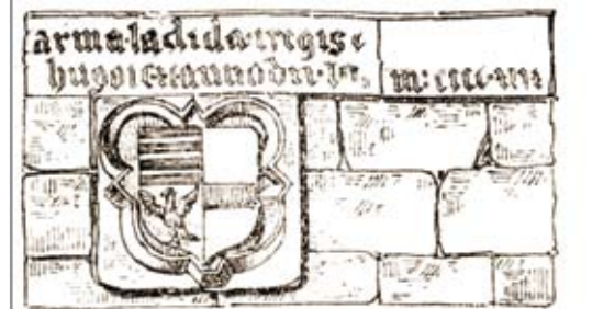
V. László király tiszteletére elhelyezett címeres emléktábla 1449-ből a Közép utcai kaputornyon Jakab Elek (fent) és Pákei Lajos (lent) nyomán