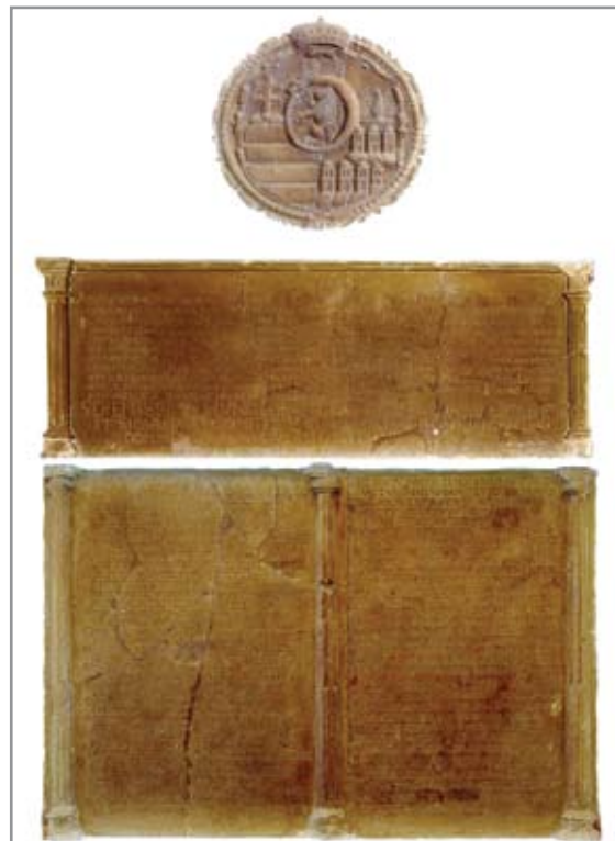
Bocskai István fejedelem tiszteletére, szülőháza falán elhelyezett emléktábla együttes 1606-ból (Kovács András nyomán, részlet)