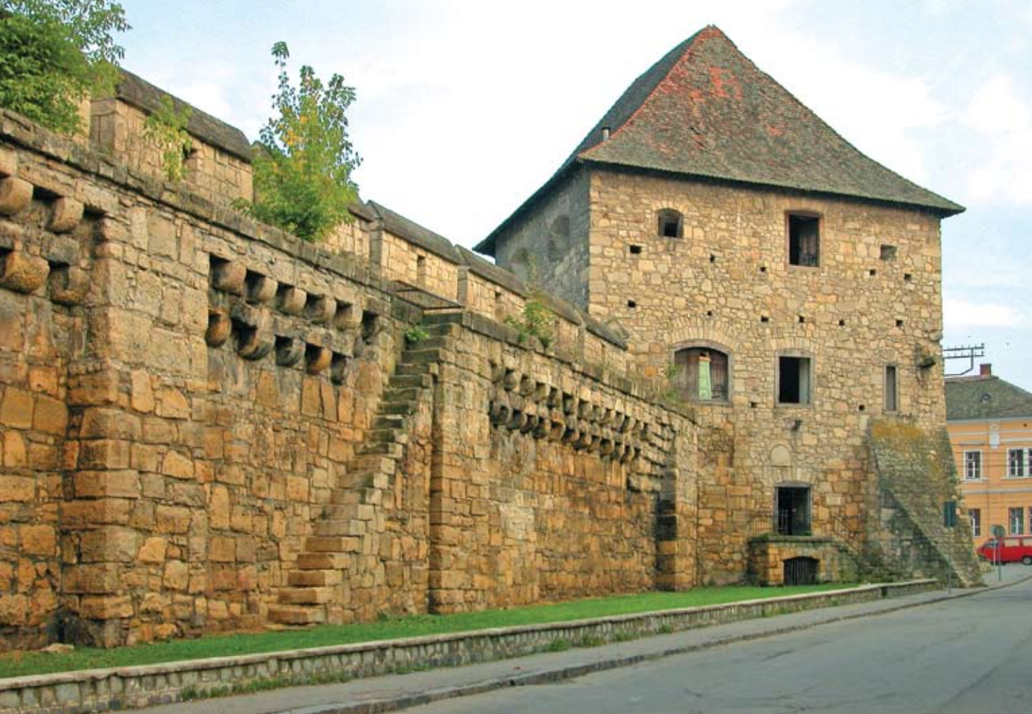
A Szabók tornya