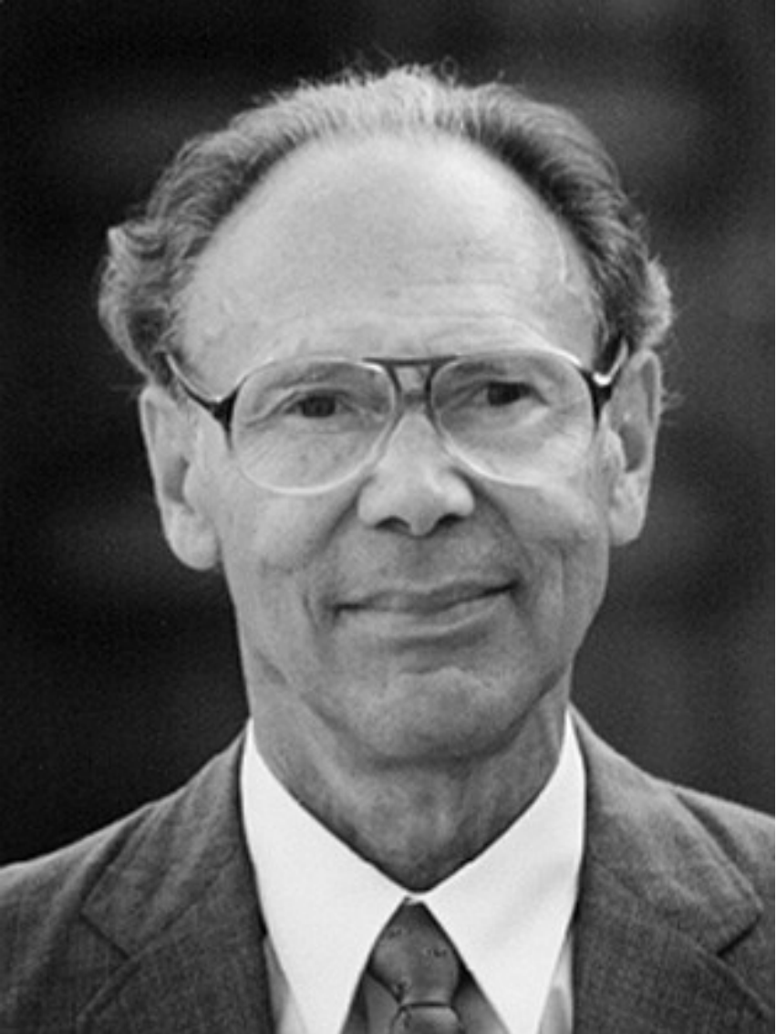
Kiss Elemér (1929–2006)