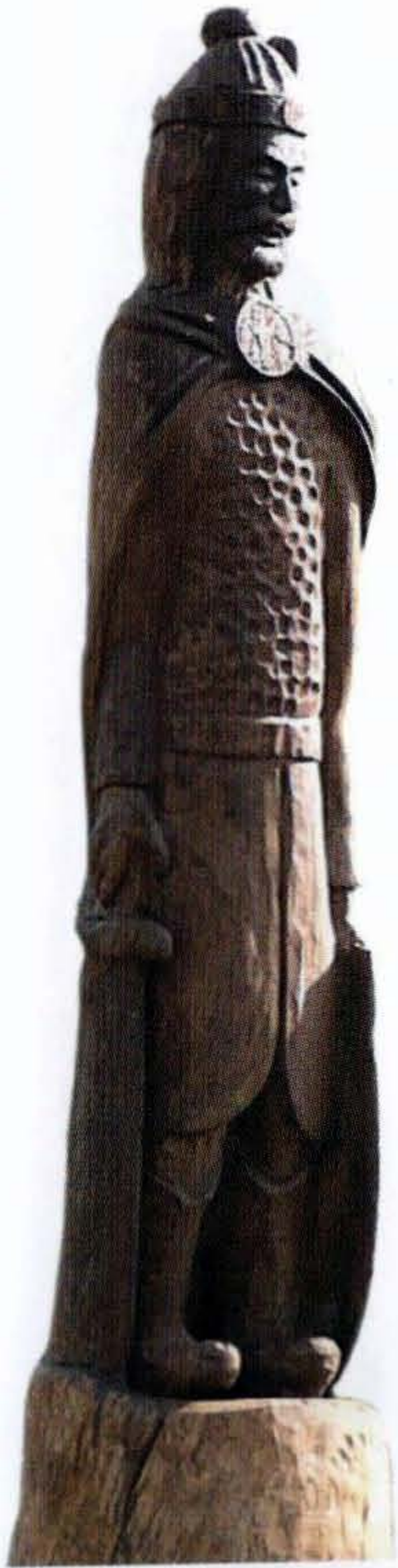
FRECH OTTÓ- NAGY GÉZA-STEINBACH SÁNDOR: HÉT VEZÉR SZOBORPARK – ELŐD. (2006) CSICSÓ.

derekán belső kezdeményezésre alakult meg az Etelköz nevű kelet-európai térségben. Csakhogy a nép nem magától szerveződött állammá, hanem egy harmadik tényező, egy dinasztia szervezett sztyeppeállamot az önálló identitással és eredeti őshagyománnyal rendelkező magyar etnikum egy részéből, valamint az általa integrált kabar és „avar” közösségekből. A Közép-Európában megtelepedt Magyar Nagyfejedelemség több mint egy évszázadon keresztül képviselte sikeres nagyhatalomként a kora középkori államiság „nem római” eredetű megvalósulását.