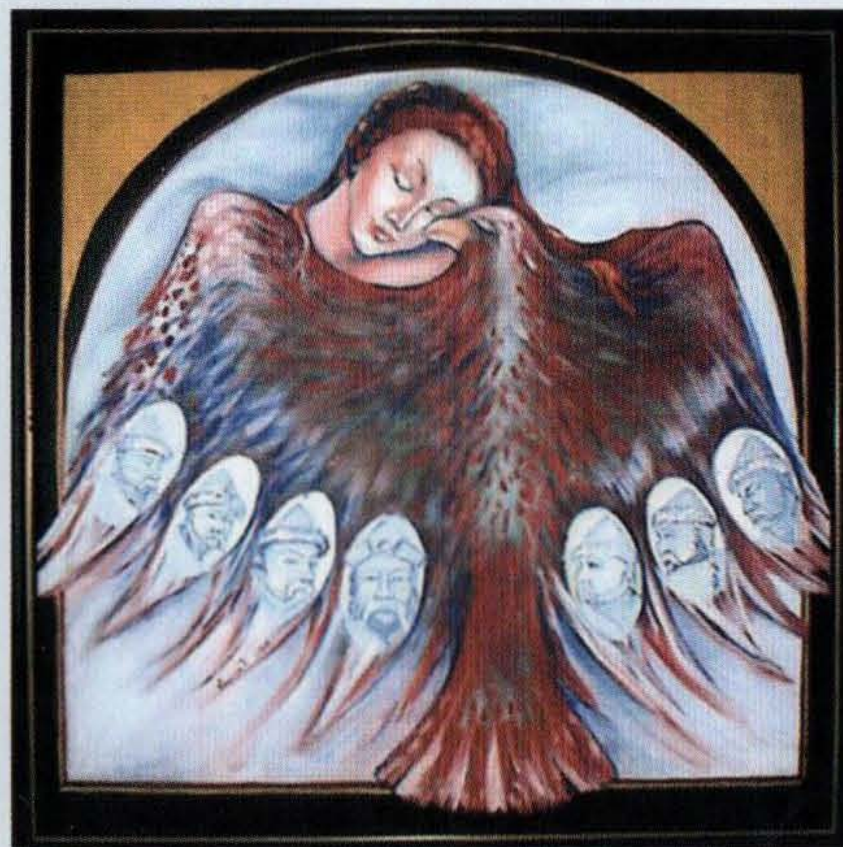
VÁNCSA ILDIKÓ: EMESE ÁLMA.

A turulmondát Anonymus kissé másként adja elő. Béla király Névtelen Jegyzője egyfelől Ügyeket, s nem Elődöt jelöli meg Álmos apjaként; másfelől anyjaként egy Emesu nevű nőt említ, aki egy bizonyos Eunedubelianus vezér leánya volt. A kutatásban eltérő nézetek láttak napvilágot arról, hogy melyik mondaváltozat az ősbib, kik lehettek valójában Álmos szülei, és nevük honnan eredhet. A köztudatban Anonymus előadása terjedt el, így az ő nyomán Álmos anyja Emese néven ismeretes. Ám ennek ellentmond az a tény, hogy ilyesfajta neveket (Emes, Emus, Emse) az Árpád-korban csak férfiak viseltek. Ugyancsak nem adatolható az 'anyakoca' értelmű emse szóval való rokonítása. Legvalószínűbbnek egy új értelmezés tűnik, amelynek lényege, hogy a krónikák őrizték meg a monda ősi változatát. Itt Eunodbilia (Ünődbeli?) volt az álomlátó/révülő anya neve. Talán ezt értette félre Anonymus, amikor a 'révülés' jelentésű émés szóból hozta létre Emesu nevét, majd a funkcióját vesztett Eunodbiliából megalkotta Eunedubelianus vezért, és az így előállt alakot megtette Emesu apjának. Sz. Gy.