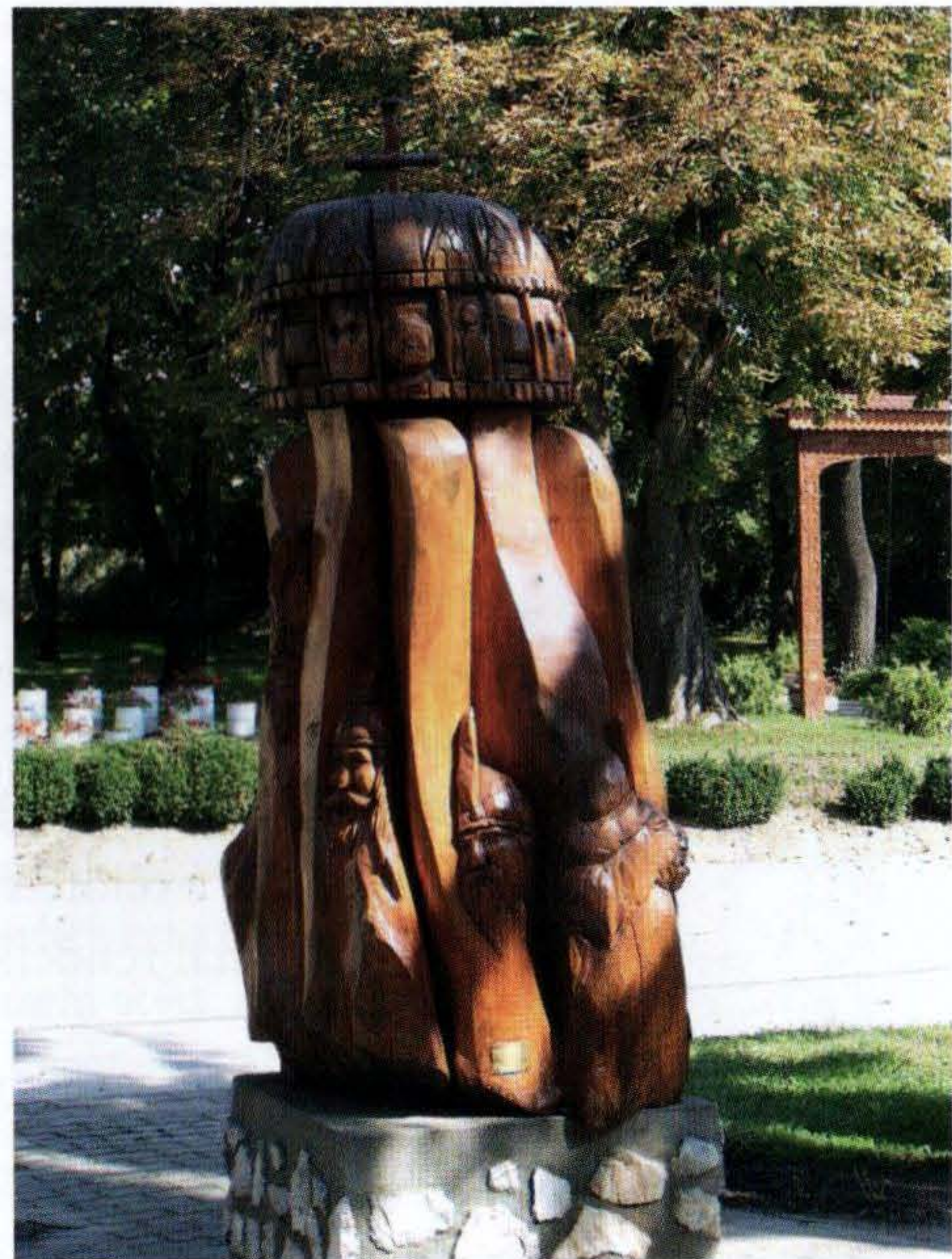
PÁLOSI MIHÁLY: A HÉT VEZÉR (2000). MÉLYKÚT.

„Állam” szavunk viszonylag fiatal. Alapja, a latin „status” az ókorban nem magára az önálló politikai szervezetre, hanem az adott