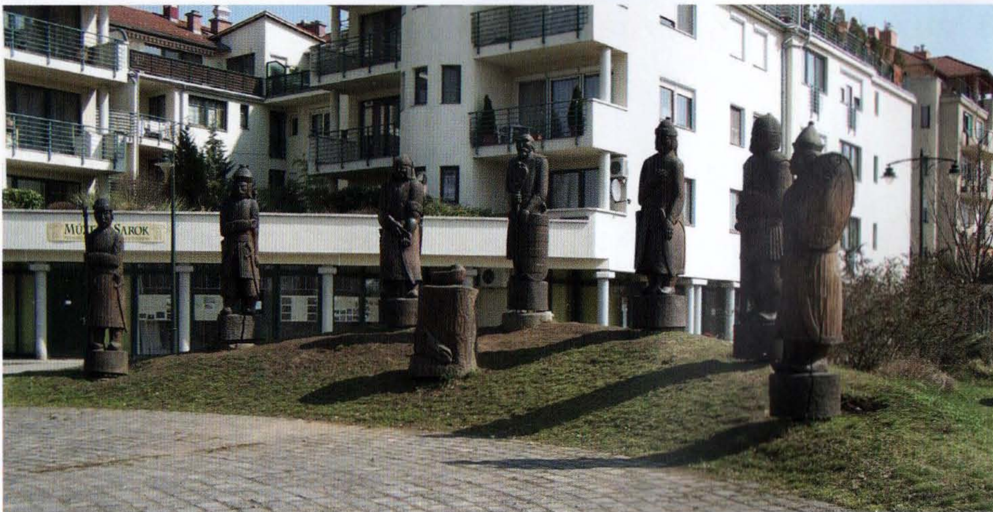
FRECH OTTÓ: A HÉT VEZÉR. (1998) BUDAPEST. FOTÓ: HÁRSCH FERENC

politikai szervezet, a res publica állapotára utalt ( status rei publicae ). Később jelzőként népnemekhez járult ( status Romanus ), majd a kormányzatot kezdte jelenteni. Ez a latin szó a nyelvújítás idején érett meg arra, hogy magyar változata szülessék. Barczafalvi Szabó Dávidnál tűnt fel 1786-ban mint álladalom; Fogarasi János 1836-ban használja elsőként az állam változatot, amely aztán széles körben elterjedt. Noha e szó újabb keletű, mint az általa jelölt politikai képződmény, ám emiatt nem indokolt elvetni, hiszen sokszor utólag alkotott szavakkal fejezünk ki korábbi tudattartalmakat (például a középkori ember sem tartotta magát középkorinak.)