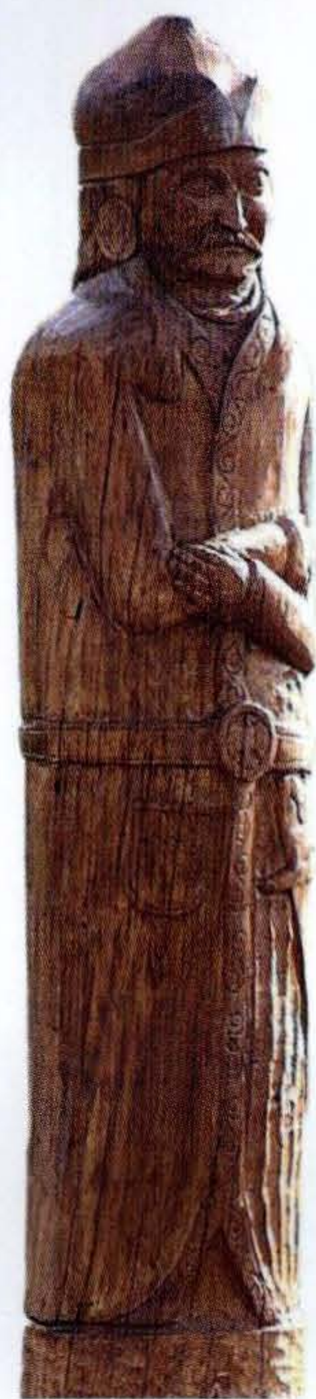
FRECH OTTÓ– NAGY GÉZA–STEINBACH SÁNDOR: HÉT VEZÉR SZOBORPARK – ÁLMOS. (2006) CSICSÓ.

idejét, a 9. század derekát, amikor Álmos tetterős férfiként alkalmassá vált arra, hogy egy nép „fejedelme és parancsolója” legyen. Ettől fogva az etelközi magyarság állami keretek között élt: olyan katonai monarchikus rendben, amely által elérte politikai céljait. A hatalomközpontosítás és a hatékonyság összefüggését Bíborbanszületett Konstantin apja, VI. (Bölcs) Leó császár (886–912) így fogalmazta meg: „A skytha népeknek tehát, mondhatni, egyforma életmódjuk és szervezetük van: sok fő alatt állnak, és a közügyekben nemtörődömök; általában nomád életet élnek. Csupán a bolgárok és kívülük még a türkök [magyarok] népe fordít gondot az egyöntetű hadirendre. Így a többi skytha népnél nagyobb erővel vívják a közelharcokat, és egy főnek az uralma alatt állnak.”