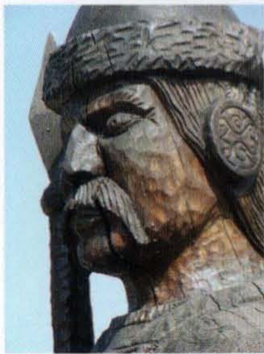
FRECH OTTÓ: A HÉT VEZÉR – HUBA. (1998) BUDAPEST.

A tudományok közül több is foglalkozik az államalakulás általános kérdésével. Walter Garrison Runciman történelmi szociológus úgy látja, hogy az államtalanságból négy feltétel teljesülése révén lehet az államiság szintjére emelkedni: 1. különüljenek el a kormányzati feladatkörök; 2. történjék meg a hatalom központosítása; 3. legyen