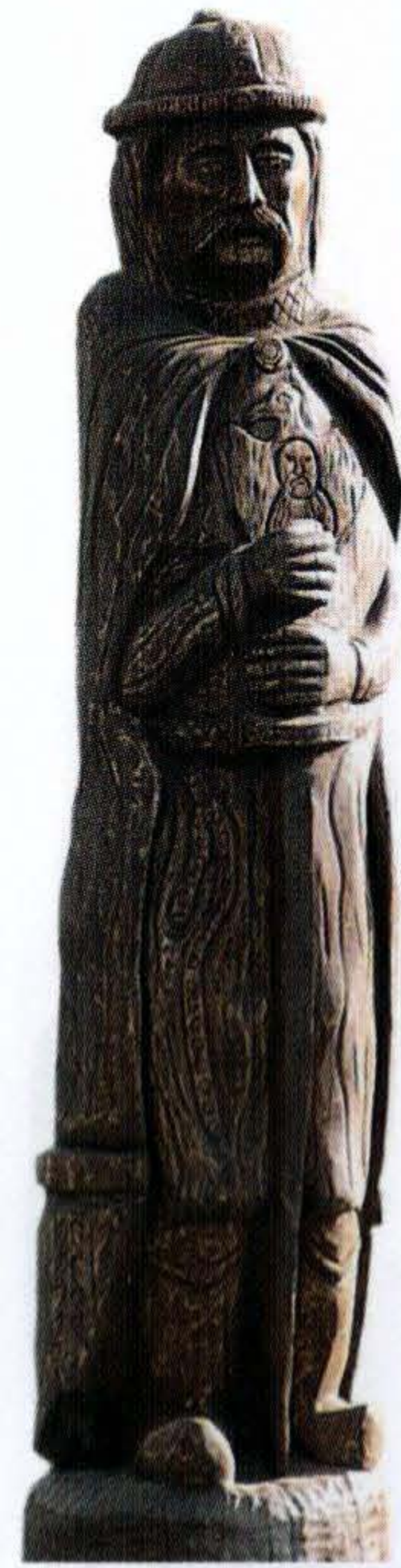
FRECH OTTÓ – NAGY GÉZA–STEINBACH SÁNDOR: HÉT VEZÉR SZOBORPARK – OND. (2006) CSICSÓ.

Míg magyar nép kialakulása a régmúlt homályába vész, térben is több százból fonódott össze, addig a magyar államiság a 9. század