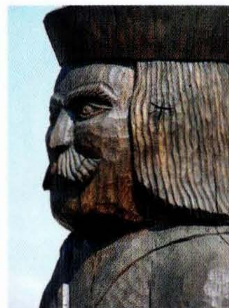
FRECH OTTÓ: A HÉT VEZÉR – TÖHÖTÖM. (1998) BUDAPEST.

Az európai történelemben a két ellentétes elv alapján működő változat, a városállam és a területi állam egyaránt az antikvitásból sarjadt, hogy aztán a középkor politikai gyakorlatát képezze. E kettő Rómában egyesült, amely a birodalmi főszerep elvesztése után a keresztény egyetemesség központjaként őrizte meg univerzális