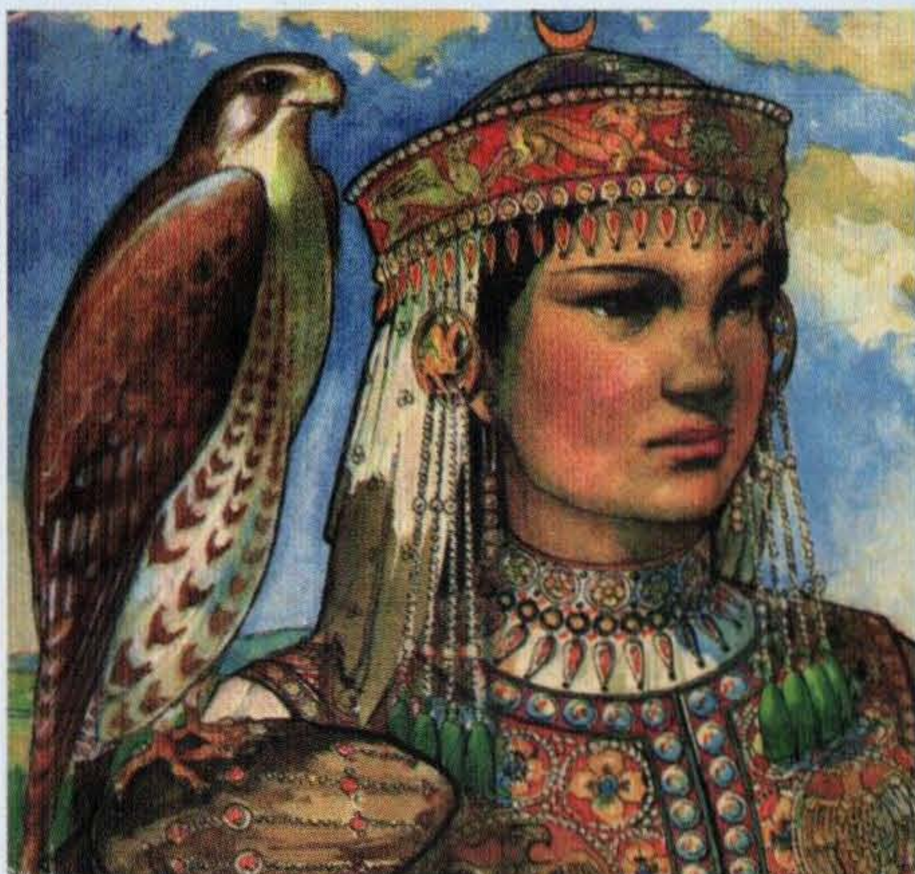
LÁSZLÓ GYULA: EMESE ÁLMA (RÉSZLET).