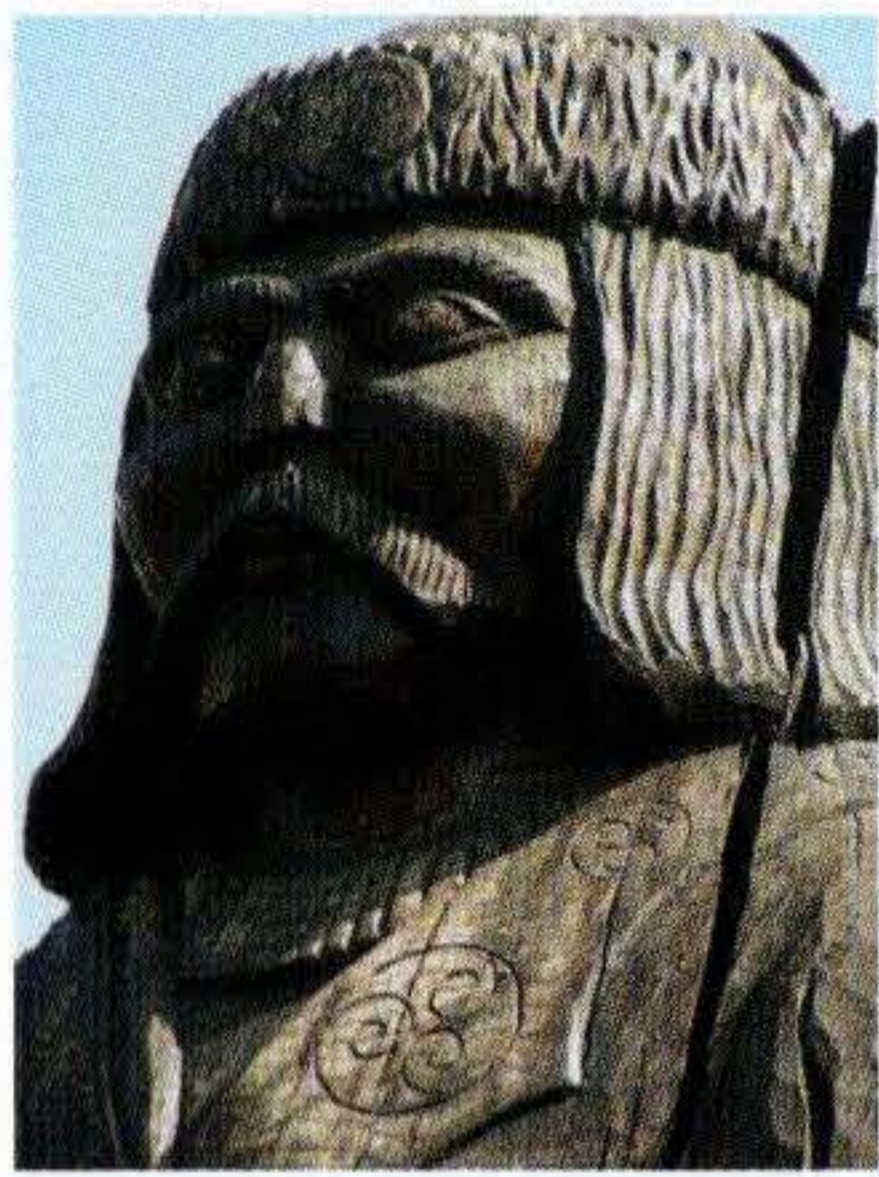
FRECH OTTÓ: A HÉT VEZÉR – TAS. (1998) BUDAPEST. FOTÓ: HÁRSCH FERENC

jelentőségét, és vált előbb a frank, később a német császárszeme forrásává. Sőt a római államiság nem csupán fel-felújított szellemi hagyaték formájában élt tovább, hanem a késő antikvitástól a késő középkorig folyamatosan működött egy római állam: Bizánc. Mindezek mellett Európa közepén a népvándorlás korában olyan államok is létrejöttek, amelyek kialakulásában a római örökség semmilyen szerephez nem jutott. Walter Pohl a Kárpát-medence három sztyeppei birodalmát foglalta a „nem római” világ rendszerébe: a hun, az avar és a 10. századi magyar uralmat. Ezek a sztyeppebirodalmak, sztyeppeállamok a Róma utáni kormányzati modell alternatíváját nyújtották: a kora középkor „nem római” államiságát alkották.