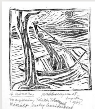
6. kép Szigethy István: Evezős (Magántulajdon)