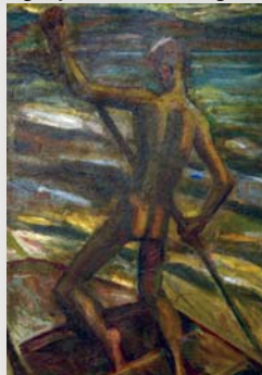
6. kép Szigethy István: Evezős (Magántulajdon)