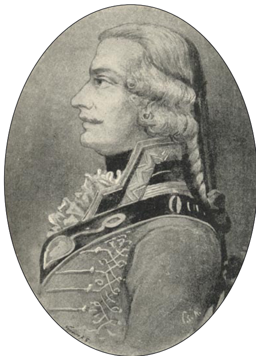
Báró felsőkubini Meskó József (Egykorú festmény alapján rajzolta Cserna Károly. Zichy 37. o.)

Kezdetben ügyvédnek készült, később azonban mégis úgy döntött, hogy a prókátorság helyett inkább katonának áll. 5 Így 1779. november 1-jén önköltéses hadapródként csatlakozott az akkor gróf Dagobert Sigmund Wurmser altábornagy 6 tulajdonában lévő, később 8. hadrendi számot kapott huszárezredhez. Viszonylag gyorsan haladt előre a ranglétrán, így 1780-ban káplár (tizedes), 7 1787. október 1-jén pedig alhadnagy lett. 8 Már az utolsó török háború idején különleges feladattal bízták meg: három káplárral és 30 emberrel a kor kiemelkedő hadvezére, báró Gideon Ernst von Loudon tábornagy személyes védelmére rendelték. Továbbá felsőbb helyről azt a titkos utasítást is kapta, hogy amennyiben a tábornagy vakmerő módon, túlságosan közel próbálna merészkedni az ellenséghez, őt ettől akár erőszakkal is visszatartsa. 9