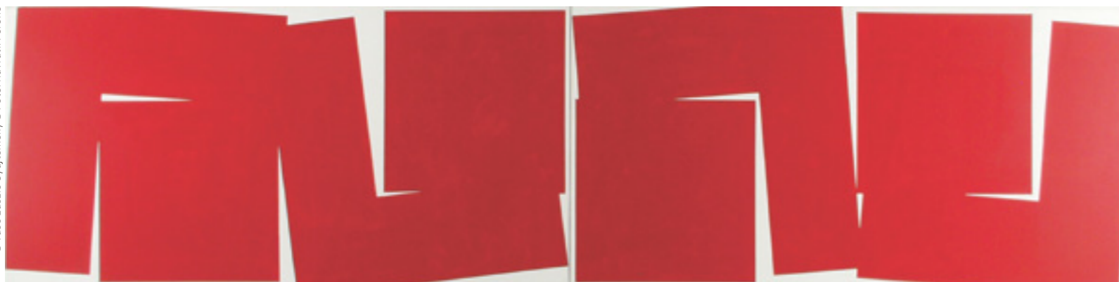
Molnár Vera: 4 piros osztott négyzet, 2000, akril, vászon, 50 × 200 cm, Vass László Gyűjtemény