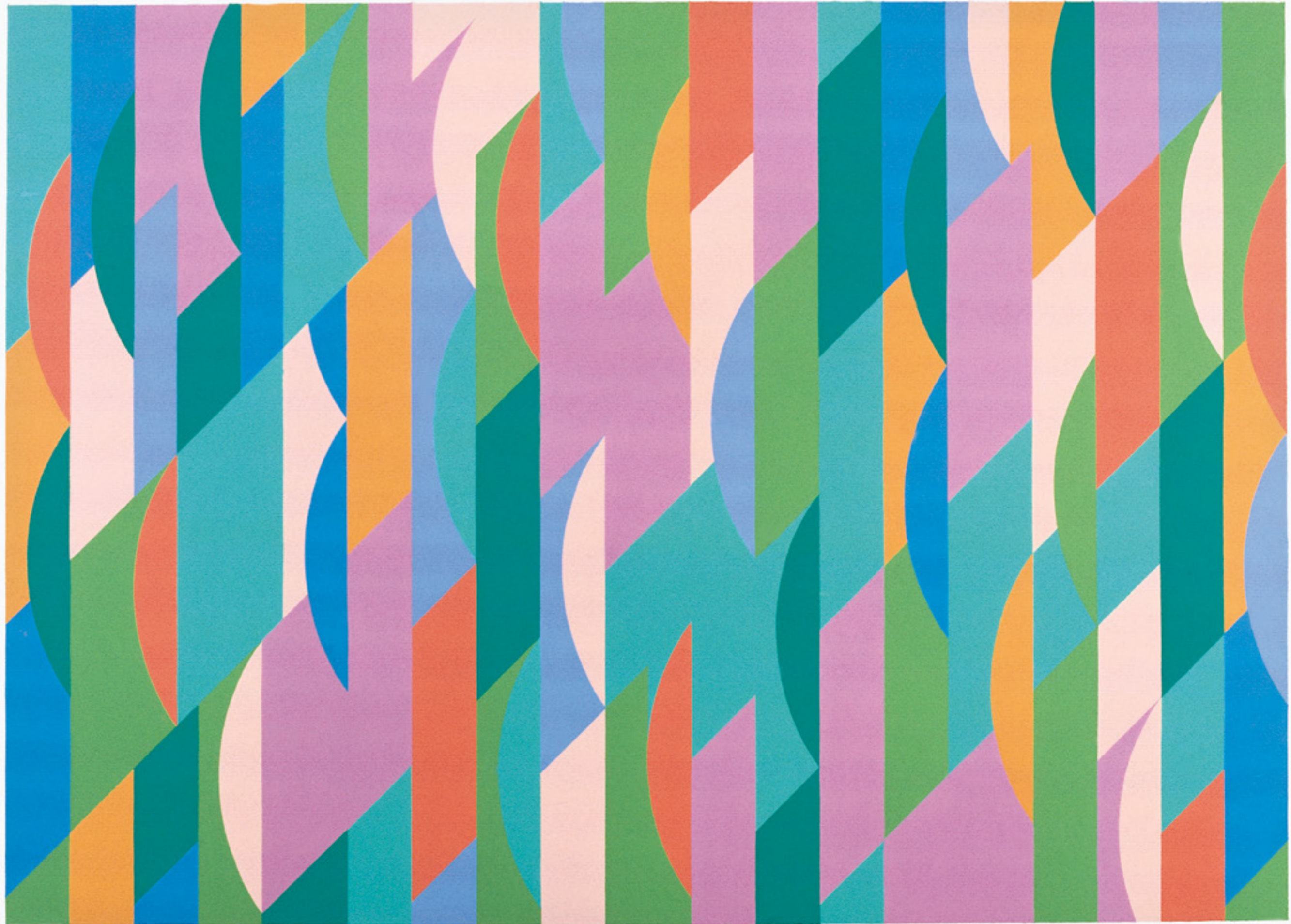
Bridget Riley: Bassacs , 1997 vinil, papír, 67,7 × 87,2 cm, Vass László Gyűjtemény