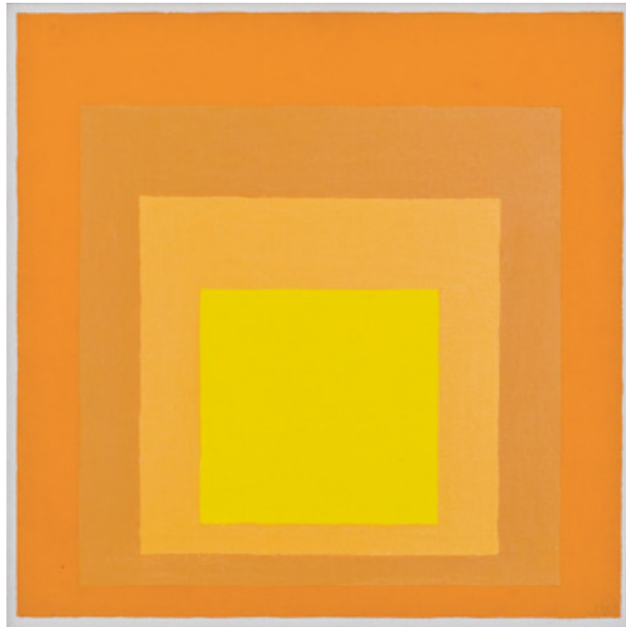
© Josef Albers

Morellet-vel, Aurélie Nemours-ral és Molnár Verával az élen, sőt izgalmas módon a radikális festészet és a neo-geo is helyet kapott olyan nagyságokkal, mint a már említett Hafif, valamint Joseph Marioni, illetve Peter Halley és Sarah Morris.