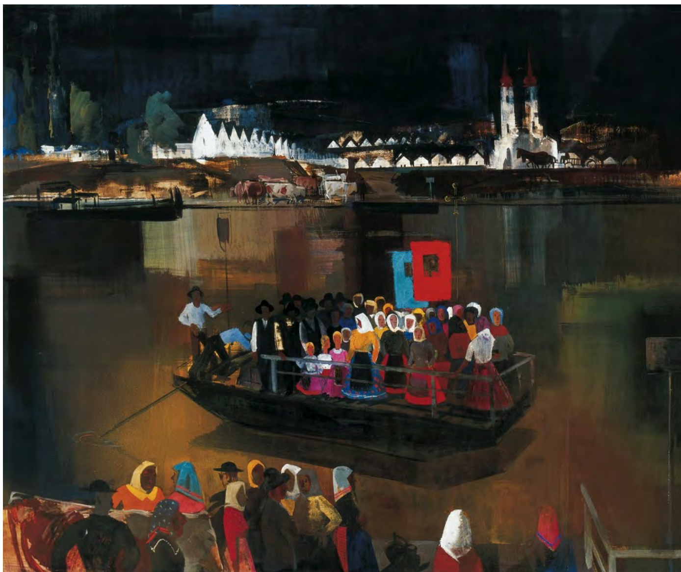
Aba-Novák Vilmos: Kompátelés a Tiszán

A két háború közötti nemzetkarakterológia, illetve a Kelet–Nyugat oppozíció tulajdonképpen a polgárosodás problematikáját vetette fel. A világnézetileg különböző szerzők, mint Szabó Dezső, Szekfű Gyula, Németh László, Erdei Ferenc, Prohászka Lajos, Karácsony Sándor, Hamvas Béla ezt a kérdést járták körbe, más-más terminológiával, eltérő konklúziókra jutva. A Szabó Dezső-féle ún. tősgyökeres, magyar etnikumú polgárság eszméje jól harmonizál a korszak etnoprotecionista társadalmi közhangulatával és politikai légkörével. A különféle harmadikutas modernizációs koncepciók közös nevezője az a Szabó Dezső által szabadalmaztatott elgondolás, hogy a magyar parasztság történelmi feladata a szerep eljátszása. Az ország többségét kitevő társadalmi csoportból kell tehát kiindulnia a trianoni sebeket begyógyító, nagy nemzeti regenerációnak.[30] A konkrét folyamatot mindenki másként gondolja: Szabó Dezső új honfoglalással felérő faji forradalommal, Németh László az új paraszti, független középosztály megteremtését eredményező reformokkal, Erdei a Makó környéki vállalkozó parasztpolgárságot országos modernizációs modellé emelő, átfogó társadalmi-politikai átalakulással. Bizonytalan, történhet-e ez fokozatos reformokkal – a forradalmat sem zárja ki, bár komoly kétségei vannak, képes-e erre a parasztság.