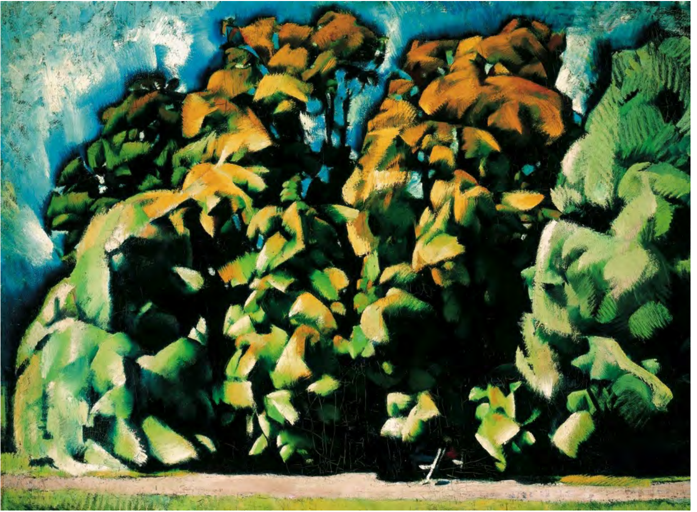
Aba-Novák Vilmos: Park

De a negatív sztereotípiák megerősítéséhez nem feltétlenül szükséges hosszan tartó háború. A jellemzés, amelyet egy 12. századi francia zarándok Santiago de Compostelába vezető zarándoklatáról beszámolva ad a navarraiakról, bizonyítja, hogy ez igencsak lehetséges békeidőben, kifejezetten spirituális célzatú esemény – egy zarándokút – keretei között is.[4] A navarraiakról a francia külső megjelenésüket és morális kvalitásaikat tekintve is a lehető legrosszabb képet festi. Rongyos öltözéket viselnek, nyelvük, mint a kutyaugatás, rosszarcúak, magaviseletük barbár és visszataszító. Étkezéskor nem használnak kanalat, kezüket merítik a közös edénybe, s nem riadnak vissza semmiféle gaszág elkövetésétől. Hitetlenek, iszákosok, vérszomjasok, mindenféle gonoszságra készek, s persze – kell-e mondani? – gyűlölik a jámbor franciákat. De hát ez nem is csoda – teszi hozzá rosszmájúan a szerző –, hiszen már a leszármazásuk is fölöttébb kétes. Azoknak a skótoknak a fattyai, akik Julius Caesar idején megerőszakolták a helybeli nőket; így alakult ki ez az utálatos népség. Előszeretettel közöszlöknek állatokkal: ezért van olyan navarrai, aki nem áll az öszvére farára erényövet erősíteni. Mindamellet van néhány jó tulajdonságuk is: rátermett harcosok, akik kötelességtudóan befizetik az egyházi tizedet és naponta járnak templomba.[5]