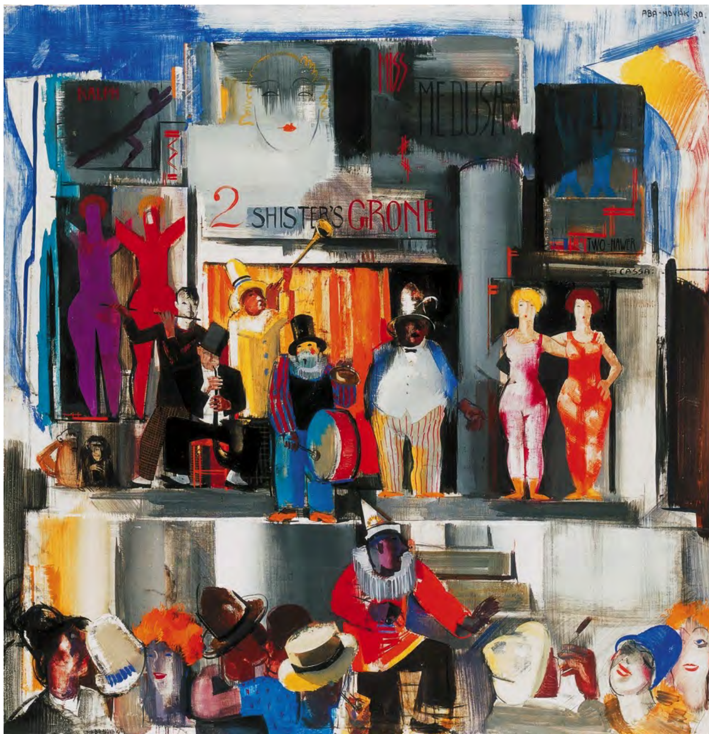
Aba-Novák Vilmos: Vurstli

A válasz a szerző politikai-világnézeti alapállásában keresendő. A nemzetkarakterológiai koncepció ugyanis a konzervatív ihletésű modernitáskritikából nő ki. Alaptézise, hogy a haladás korszaka véget ért, s Európának azok a népei, amelyek ebben a periódusban a kontinens irányadó nemzetei voltak – az angol és a francia –, megöregedtek, elfáradtak, át kell adniuk helyüket a kontinens még el nem használt, fiatal nemzeteinek. Keyserling 'hazabeszél': a németet is ezek közé sorolja. Németországnak – fejtegeti – vezető szerepet kell játszania az új Európában. Első hallásra ez a Spengler-féle Imperium Germanicumra hajaz, ám itt nem agresszíven imperialista koncepcióról van szó: Keyserling szerint Németországnak békés történelmi küldetése van: az univerzalizmust kell képviselnie a megújuló kontinensen, mintegy Európa lelkiismeretévé kell válnia.[10] A haladás korszakában túlracionalizálódott és elmechanizálódott, lélektelenné váló Európa – a motívum a korabeli kultúrkritika elmaradhatatlan tartozéka – regenerációjában. A lélekkel felruházás fontos princípium. A német polgárnép, ám arisztokrata vezetésre van szüksége. Ezt a szerepet a német arisztokrácia már nem tudja eljátszani, ezért van szükség az új német elitre.[11] Itt jönnek a teóriába az alkatilag arisztokratának gondolt népek: a spanyol és a magyar, és itt válik érthetővé a