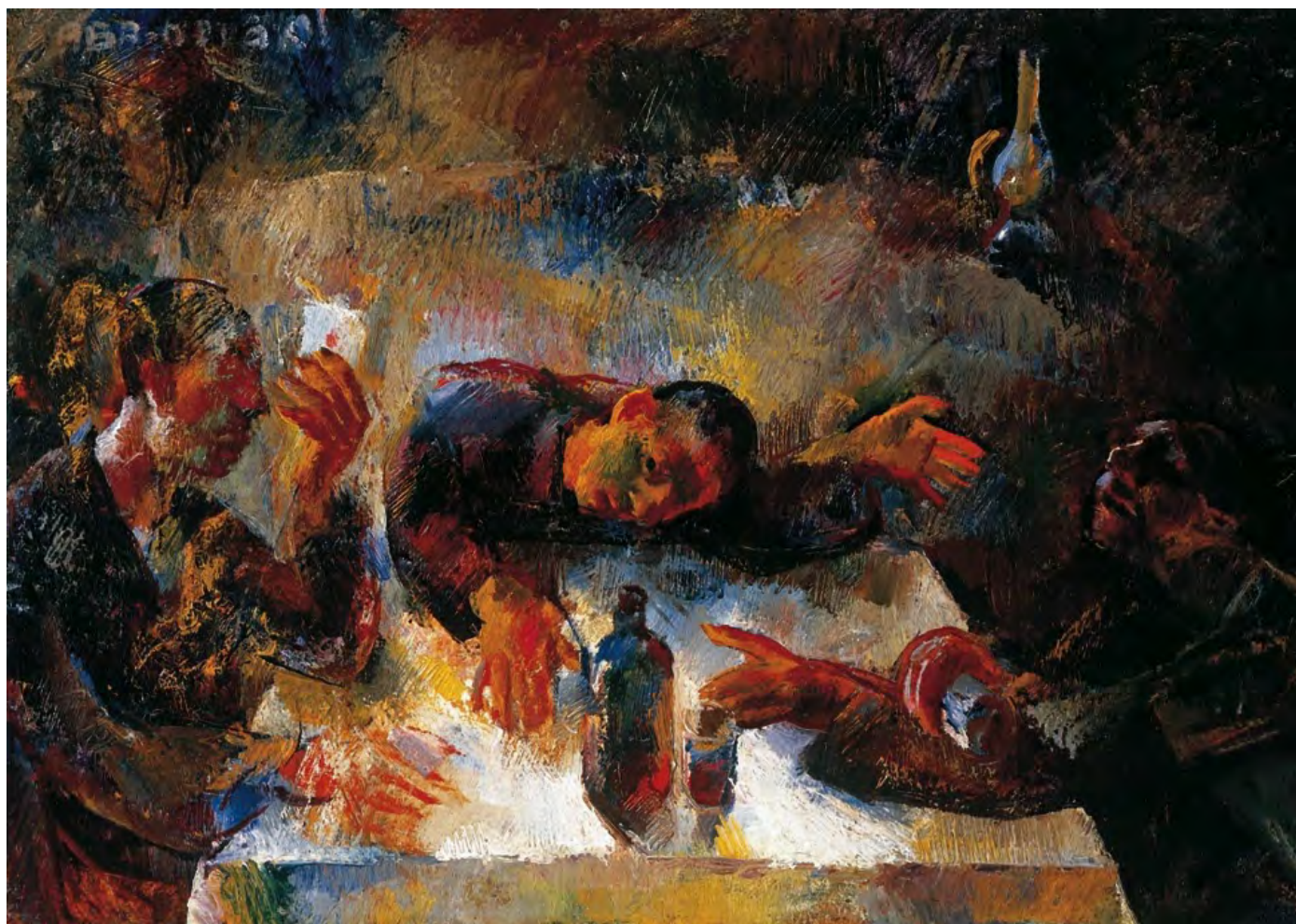
Aba-Novák Vilmos: Ivók

A szerző az MTA BTK Filozófiai Intézetének tudományos főmunkatársa. Jelen írás A magyar filozófiatörténet narratívái (1792–1947) című, K104643-as számú OTKA-projekt keretében készült.