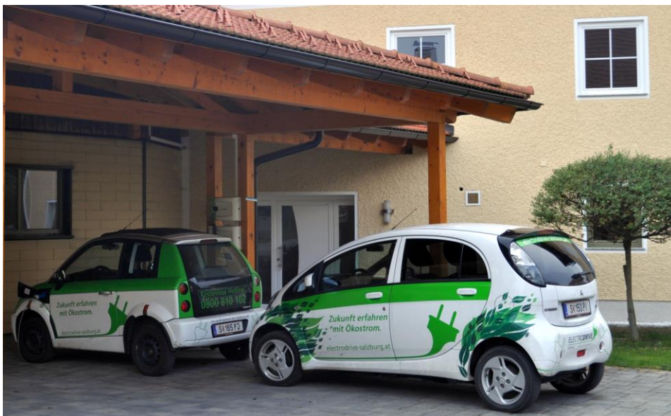
4. ábra: A köstendorfi projektben használt két elektromosautó-típus, a norvég Think City és a japán Mitsubishi i-MiEV