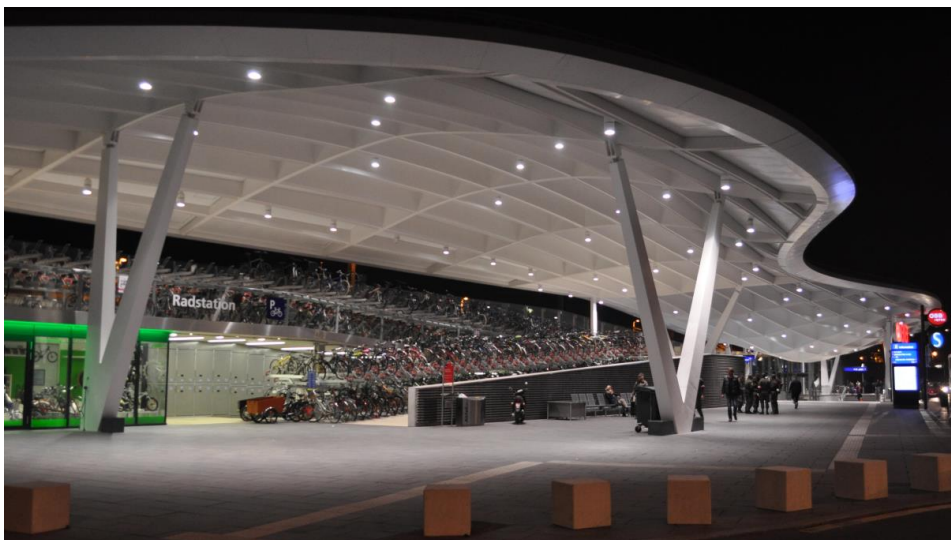
5. ábra: A pályaudvar impozáns kerékpártárolója, Salzburg