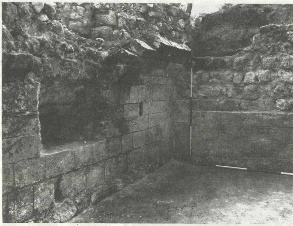
18. ábra. XII. századi kis kőépület pincéje Abb. 18. Der Keller des kleinen Steingebäudes von Kána aus dem 12. Jahrhundert

főlé. Jóval nagyobb volt, mint a templom, amelyet ekkor nem építettek újjá, csupán egy keskeny, északi kápolnával bővítettek. E kápolnát alapos okokból sírkápolnának tekinthetjük, melyet az alapító tiszteletére utódai emeltek, s ahová sírját, korábbi helyéről áthelyezték. (Korábban a templom tengelyében a diadalív előtt volt található.)