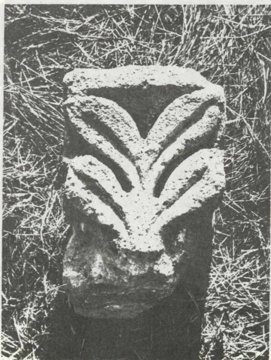
19. ábra. Konzol fejezet a XIII. század elejéről

Abb. 19. Der Kapitäl der Konsole aus dem Anfang des 13. Jahrhunderts