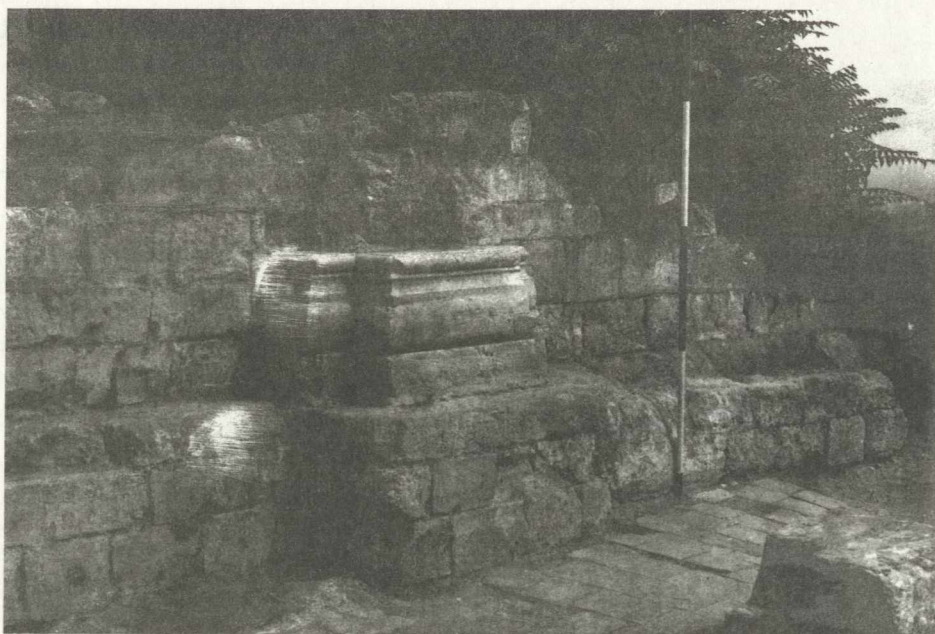
17. ábra. A templom falpillére Abb. 17. Der Pfeiler der Kirche von Kána

szokásaikról tehát leszoktak, ám a régész késői kutatásánál a temetkezések időpontjának megállapításához ezzel nem nyújtottak segítséget. Egy véletlenül elveszített 1172–1178 között vert velencei pénzérme azonban mégis előkerült.