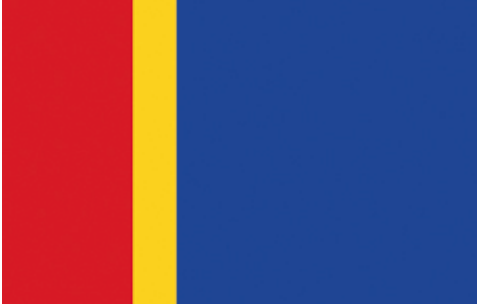
6. kép Az első 4 számi zászló.