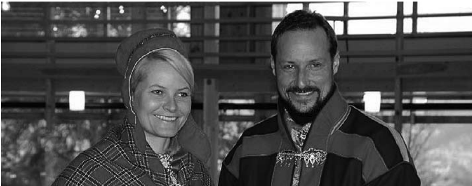
17. kép A norvég hercegi pár.

lomra a hercegi pár – a még 2001-ben az esküvőjükre kapott – számi viseletben ékezett. Északi tartózkodásuk két napján kipróbálták a tradicionális számi életet, a lassózástól a rénfogaton való utazáson át majdnem a sátorban alvásig. Az utóbbit a -30-35^{\circ}\text{C} -os hidegre való tekintettel Mette-Márit elvetette. 33 A sajtóhírek pozitívan számoltak be a hercegi pár részvételével lezajlott számi ünneppsorozatáról, ám néhány számi orgánium kritikával is élt, például megjegyezték, hogy Haakon rosszul vette föl a „négyzél-sapkát”, és a számiktól ajándékba kapott téli viselet alatt mindketten overállt viseltek. 34 A sátorszállítás elutasítása és az overáll viselése egy, a számi folklórban is gyakran felbukkanó „homogenizáló” szüzsét hívott életre, miszerint csak a számik bírják a hideget. A közeledés és a barátság gesztusa nem tudta elfedni a kisebb hibákat, mint például a sapka helytelen viselése. Ennek ellenére senki sem vonta kétségbe a norvég uralkodócsalád pozitív szándékát. (17. kép) 35