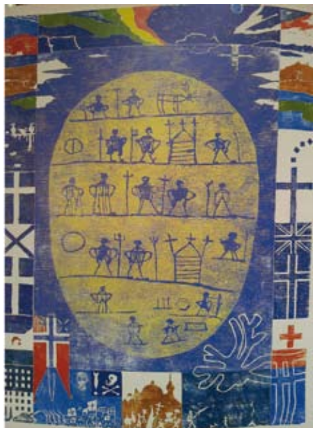
4. kép Hans Ragnar Mahtisen (1945– norvégiai számi költő, festőművész) történeti témájú posztere. 2