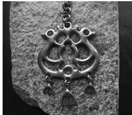
29. kép Számi motívum ihlette medál. (Juhls' Silvergalleri, Kautokeino, 2014.)

A számi jelrendszer szélesebb körű felhasználása ezzel párhuzamosan bonyoszkodik egy másik, „pánóslakosság-diskurzusba” is, amely a hagyományok tulajdonjoga, tartalmának védelme, tulajdonképpen a márkavédjegy kérdése