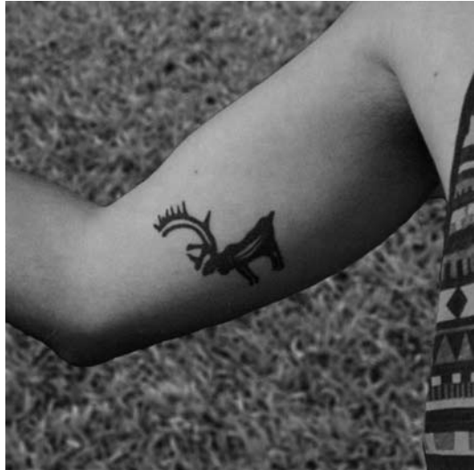
24. kép Sámándobokon szereplő rénszarvas motívum tetoválásként.

„globális összkép” is az egységsítő szemléletnek kedvezett. Az „igazi, hiteles” számi népviseletben jár, rénszarvastenyésztő, és valószínűleg a maga archaikus módján viszonyul a természetfelettihez. Erre a képre alapoznak az időben a 19–20. század fordulójának bemutatásáig terjedő múzeumi tárlatok is (MAHTISEN, 2010, 53–72.), ami a – kortárs kultúrát is részletesen dokumentáló – modern skandináv muzeológiai szemlélettől éles elkülönülést mutat. Természetes, ugyanakkor óhatatlanul archaizáló, hogy a számik önmeghatározásában a legkarakteresebb, egyben nagy történelmi múlttal rendelkező szimbolika jelenik meg. A turisztikai iparágak és sokszor még a törvényi szabályozások is ezt erősítik (például Norvégiában és Svédországban a számi identitás szempontjából kiemelten fontos réntartásra a számik kizárólagos joggal rendelkeznek). A szimbólumoknak nemcsak befelé, hanem