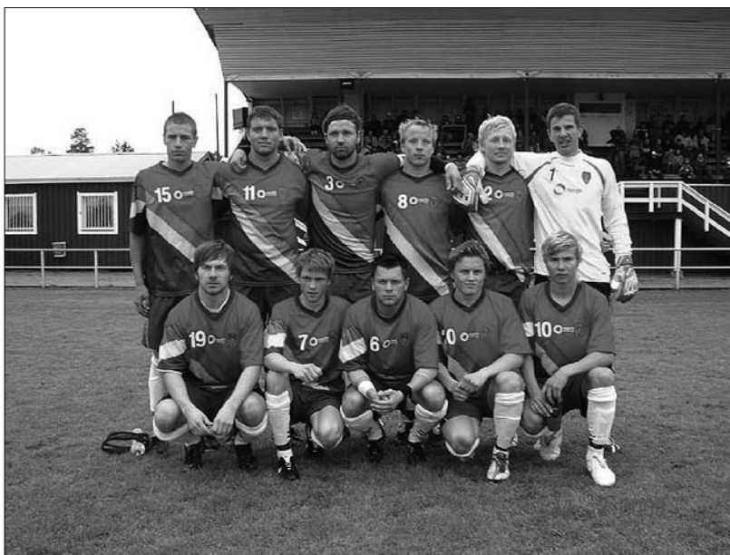
7. kép A számi focicsapat 2008-ban.

A pánszámi célkitűzés a központi jelképeken túl az emblemikus szervezetek, társulások, például a számi focicsapat, vagy a számi kórus összetételében is megnyilvánul. A focicsapat (7. kép) 22 három ország számijaiból áll össze, a kórus tagsága (8. kép) 23 pedig mind a négy országra kiterjed, sőt,