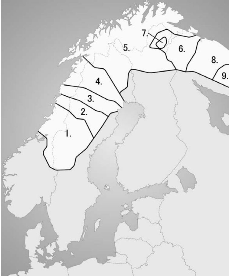
1. kép A számi nyelvjárások: déli , umei, pitei, lulei, északi, inari, kolta, akkai, kildini és ter számi.

inkább a tudomány szempontjából volt jelentősége. A számik között is számon tartott megkülönböztető jegyek a hagyományosnak tartott számi foglalkozások (életmód) mellett a nyelv és a viselet. A földrajzi és társadalmi tagolódást tükröző népviseletek a szó szoros értelmében sokszínűvé teszik a képet, és fontos szerepet játszanak a számik belső és külső reprezentációjában is. A hatalmas területen szétszóródó alacsony lélekszám történeti hozadéka a tíz, egymástól nagy eltéréseket mutató dialektus, amelyek jó része mára a kritikus mértékben veszélyeztetett nyelvek közé tartozik. 7 (1. kép) 8