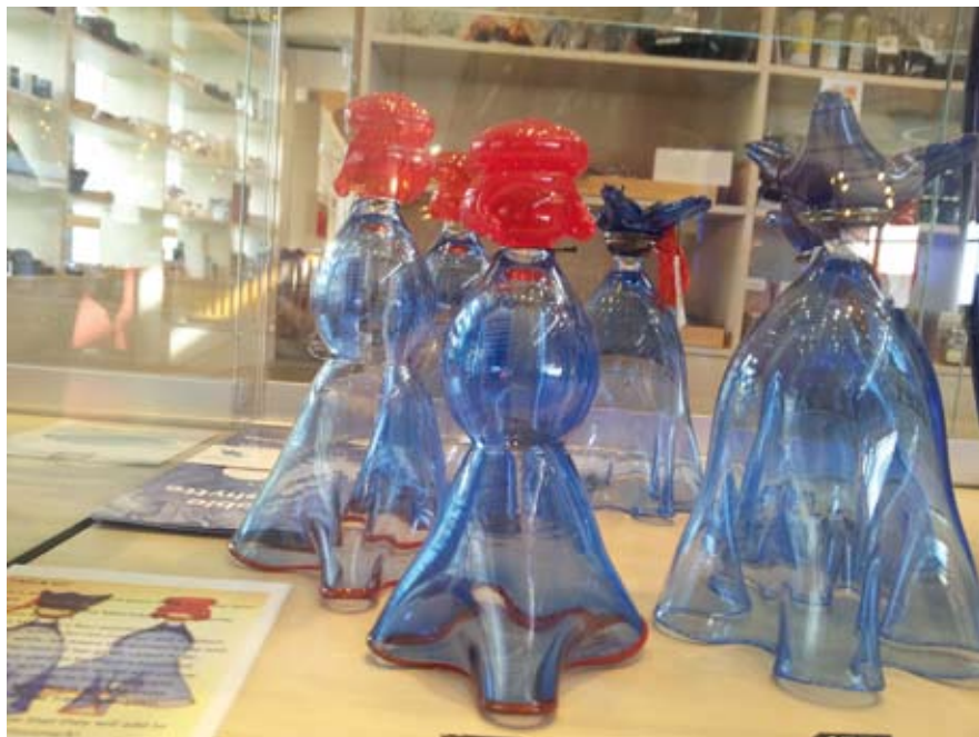
30. kép Számi viseletet megjelenítő vázák, poharak egy észak-norvégiai tüzletben.