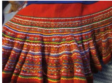
10–12. kép Kautokeinoi (északi számi) női viselet és szegélydíszei (1999, Norvégia, Kautokeino).