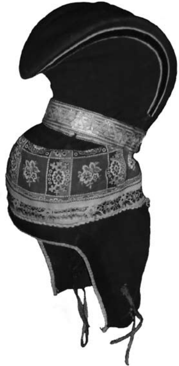
2. kép Ládjogahpir.