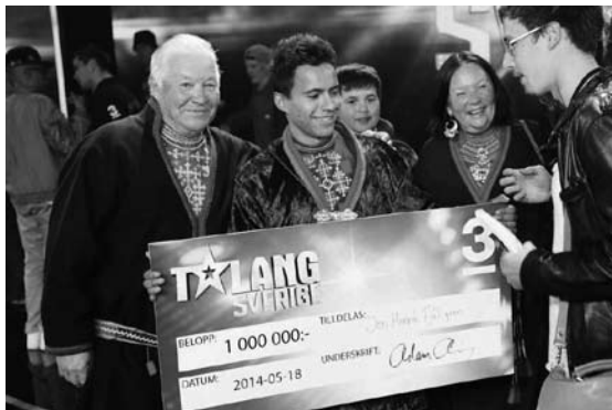
21. kép A győztes szüleivel.

A három eset tanulsága, hogy az etnikai alapú feszültségek máig jelen vannak északon. A számi jogok elsősorban Norvégiában és Svédországban kaptak törvényi védelmet. Azonban a két (norvég és svéd) példa is jól illusztrálja, hogy a két ország politikája a számik rehabilitálásában másfajta utat követ. Mindennek történeti okai lehetnek, hiszen Norvégia a számiság kulturális jellemzőit akarta eltüntetni: erőteljesen asszimilálni, megváltoztatni („norvégosítani”) a számikat (BJØRKLUND, 2000; MINDE, 2005), míg Svédországot elsősorban a kirekesztés jellemezte: az állampolgári jogok megvonása és a számik lélekszámát tudatosan célzó szörnyű intézkedések (mint pl. a sterilizálás) azt a jelentést hozták, hogy a számik alacsonyabb rendűek, sosem lesznek a svédekkel egyenértékű „rassz” (GRUNDSTEN 2010). Norvégiában ezért a rehabilitáció politikai eszközei ma a számi jellegzetességek elfogadását, a kultúra egyenrangúsítását célozzák, amit a norvég hercegi pár számi viseletben történő hivatalos megjelenése is jól illusztrál. Svédországban pedig inkább az egyenrangú állampolgári