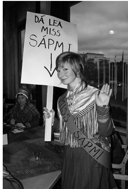
18–19. kép Tüntetés Rovaniemi utcáin.

Svédországban a 2014-es „Talang Sverige” tehetségkutató országos válogatójára egy népviseletbe öltözött számi fiú jelent meg. A vele készült interjúkban, és a színpadra lépéskor a zsűrivel folytatott beszélgetésben is hangsúlyosan került szóba a megjelenése. Jon Henrik Fjällgren elmesélte, hogy szereti a számi viseletet, és ruháját édesanyja készítette. Ő maga dél-amerikai „indián” származású, csecsemőként fogadta örökbe egy svédországi számi család. A színpadi fellépést megelőző bemutatkozó kisfilmből az is kiderült, hogy gyerekkorában sokan lenézték és csúfolták a bőrszíne miatt, és azért is, hogy egy hagyományörző számi réntartó család tagja. Ő ennek ellenére büszkén mutatja meg a számi kultúra értékeit a svéd nagyközönségnek, így a tehetségkutatóra is jójkával készült. Jon Henrik fellépése alatt könnybe lábadt a közönség jó néhány tagjának szeme, és az ének után a zsűritagok a közönséggel együtt állva tapsoltak, alig tudtak megszólalni a meghatódottság-