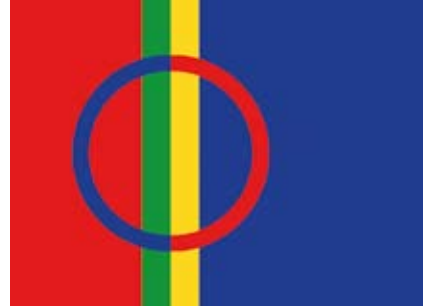
9. kép A jelenlegi 5 számi zászló.