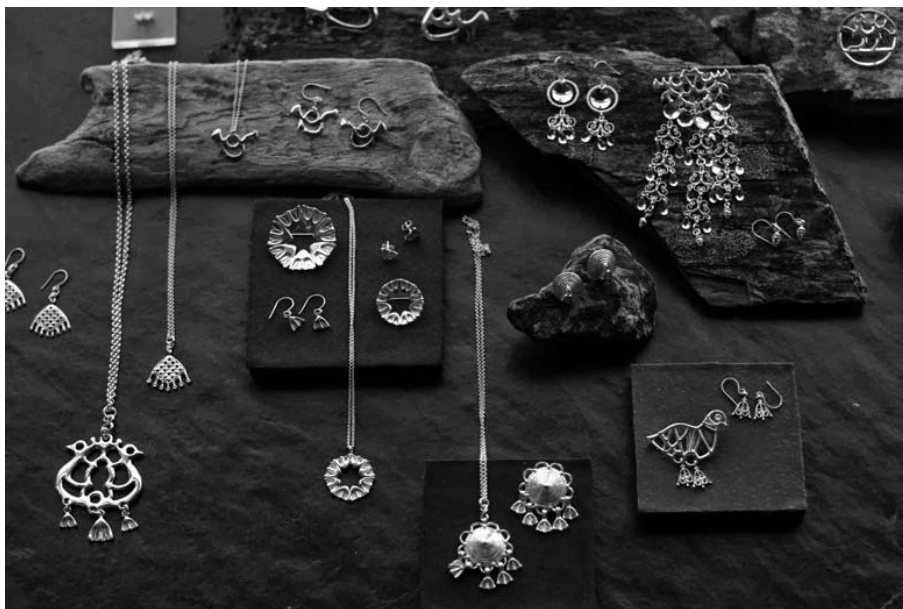
27. kép Számi ékszerek.