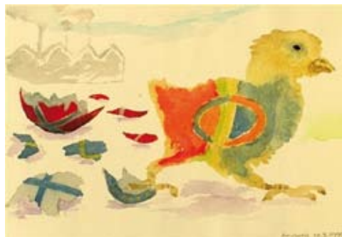
5. kép Hans Ragnar Mahtisen akvarellje: Newborn Nation... 3