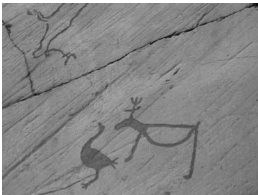
25. kép Altai (Észak-Norvégia) sziklarajzok.

kifelé is hatékonyaknak kell bizonyulniuk, ami „a többségi társadalom egzotikum iránti vágyának” (NAGY, 2014, 241. 51 ) kielégítését is magában foglalja (25. kép), (26. kép), (27. kép). 52