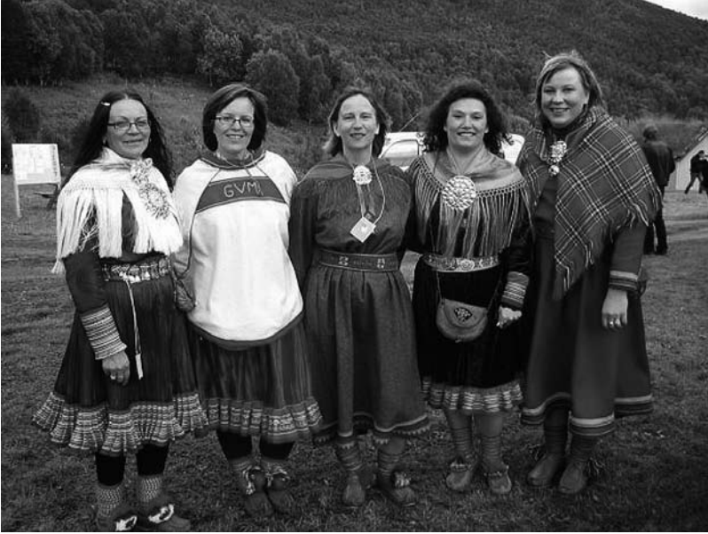
8. kép A Sámi Jienat ('számi hangok') kórusának tagjai.