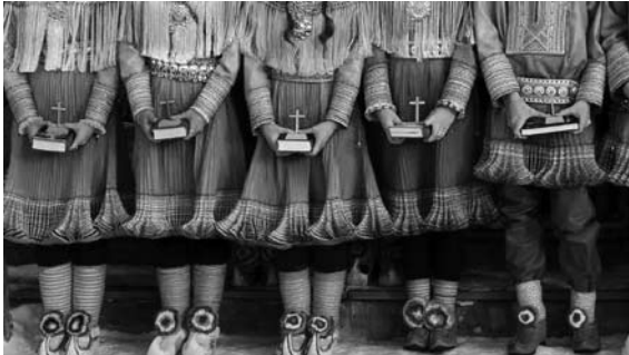
14. kép Konfirmáló számi gyerekek.

Ezt tükrözik azok a számi vélemények is, amelyek a központi szimbolikus nyelvezettel nem értenek egyet. A Ságot számi folyóiratban meglehetősen provokatív címmel jelent meg egy riport: „ The Sami Flag is Ugly and Full of Occult Symbols ”. 28 A nyilatkozó számi lelkész elítéli a zászlón megjelenő Napot, Holdat és a sámándobot egyszerre jelképező kört, szívesebben látná a keresztet a zászlón, hiszen a számik már rég nem pogányok. A samanisztikus jelképek és a számiság mitikus/ezoterikus ködbe burkolódzó interpretációi valóban nem mindig népszerűek a keresztény számik, főleg a laestadianusok körében. Ők nagyon hiányolják a keresztény jelképeket a számi identitásépítés folyamatából, azonban a kereszténység számi történelemben betöltött nagyon ellentmondásos szerepe miatt e véleményük korántsem tükrözi a többség álláspontját. Ez azonban nem jelenti azt, hogy a laestadianus és más, erősen keresztény kötődésű csoportok