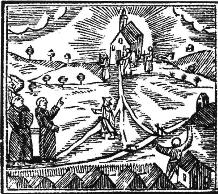
10. kép A Mária-ünnepeken mennyei fényességben tündöklő kegytemplom.