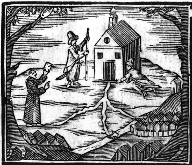
7. kép A máriaradnai kápolna szultáni engedéllyel történő felújítása.