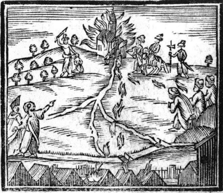
9. kép A máriaradnai kápolnát felgyújtó törökök isteni büntetése.