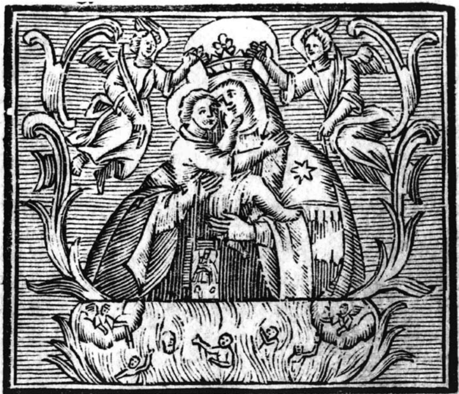
2. kép A máriaradnai kegykép.

motívum kiemelkedő barokk jelenléte is szembetűnő, ugyanis a kegykép könyvezéséről szóló 25 lokális legendahagyomány közül 18 (tehát azok kétharmada) szintén barokk eredetű. Mindazonáltal a vonatkozó motívumok többsége nem az: míg a 17–18. századi adatok szinte kivétel nélkül a különféle egyházi feljegyzésekből (mirákulumos könyvek, historia domusok, tanúkihallgatási jegyzőkönyvek) származnak, a 19. századtól a mind inkább professzionálissá váló folklórgyűjtések földrajzi és tematikai vonatkozásban egyaránt e szakrális jellegű adatok nagyságrendi növekedését hozták magukkal. De még ha csak a fő mirákulum-együtteseket is tekintjük, szembetűnő, hogy Boldogasszony, Szent Antal és Máriaradna csodatörténeteinek regisztere mellett a 19. században további hat elbeszélés-gyűjtemény (Makkosmária, Máriapócs, Máriaradna, Máriaremete, Szeged-Alsóváros, Vác-Hétkápolna) tűnik fel (2. kép), 5 a szórványos adatok tömegéről már nem is beszélve. 120 kép több ezer mondaszöve-