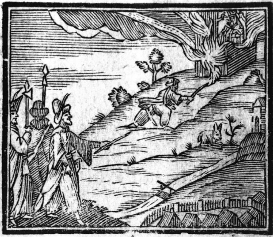
4. kép A törökök által okozott tűzvészben a kegykép épségben marad.

képek esetében is (például Nagyszombat, Boldogasszony, Szeged-Alsóváros, Máriaradna) egyike a kultikus emlékezet központi elemeinek (4. kép).