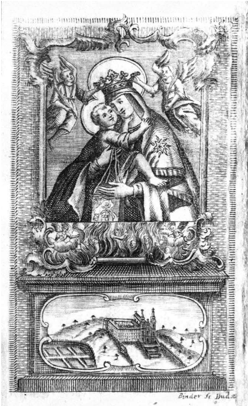
1. kép Az 1773-ban kiadott máriaradnai mirákulumos könyvet bevezető fametszetű kép.