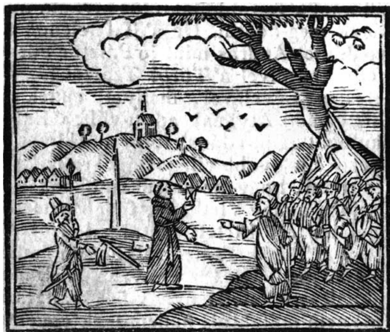
12. kép A szultáni levél birtokában a kínzásoktól megmenekülő ferences atya.