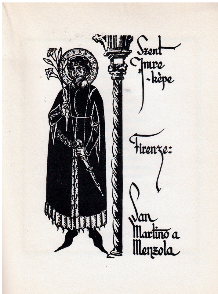
A Szent Imre himnuszok című kötetben közölt illusztráció. Ismeretlen alkotó fametszete; készült a San Martino a Mensola templom oltárképének Szent Imre-ábrázolása alapján.