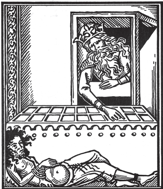
Szent István Imréhez küldi Konrádot