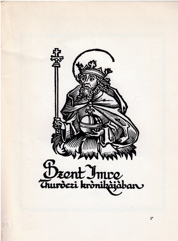
A Szent Imre himnuszok című kötetben közölt illusztráció. A fametszet alapjául szolgáló kép forrása ismeretlen.