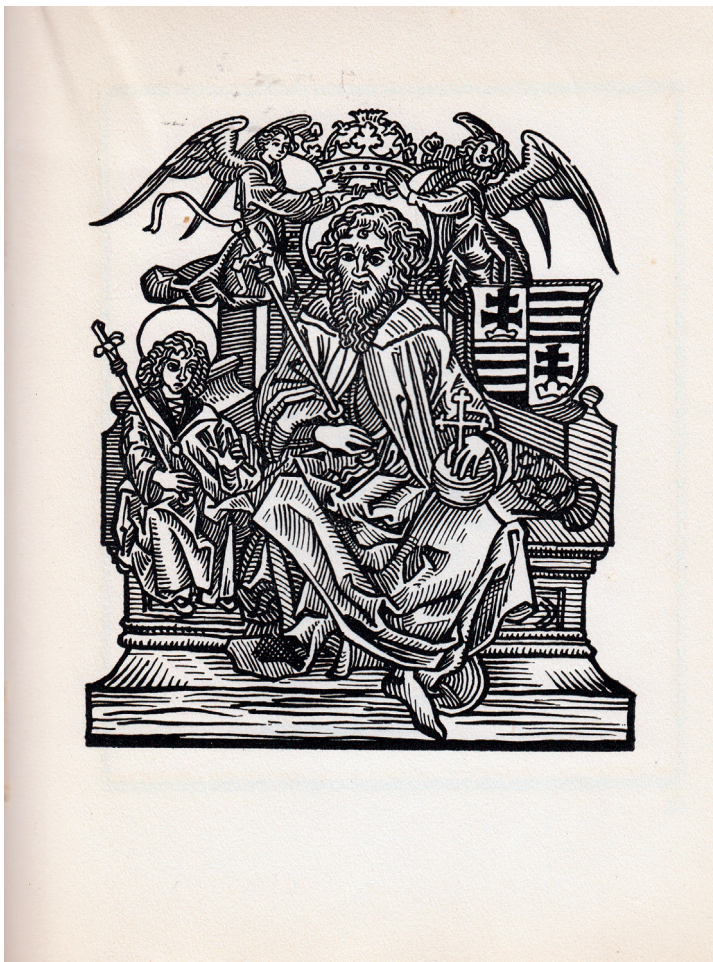
A Szent Imre himnuszok című kötetben közölt illusztráció. Ismeretlen alkotó fametszete: Szent István király és Szent Imre herceg. (Eredetije: Johannes Thuroczy: Chronica Hungarorum , Brünn, 1488.)