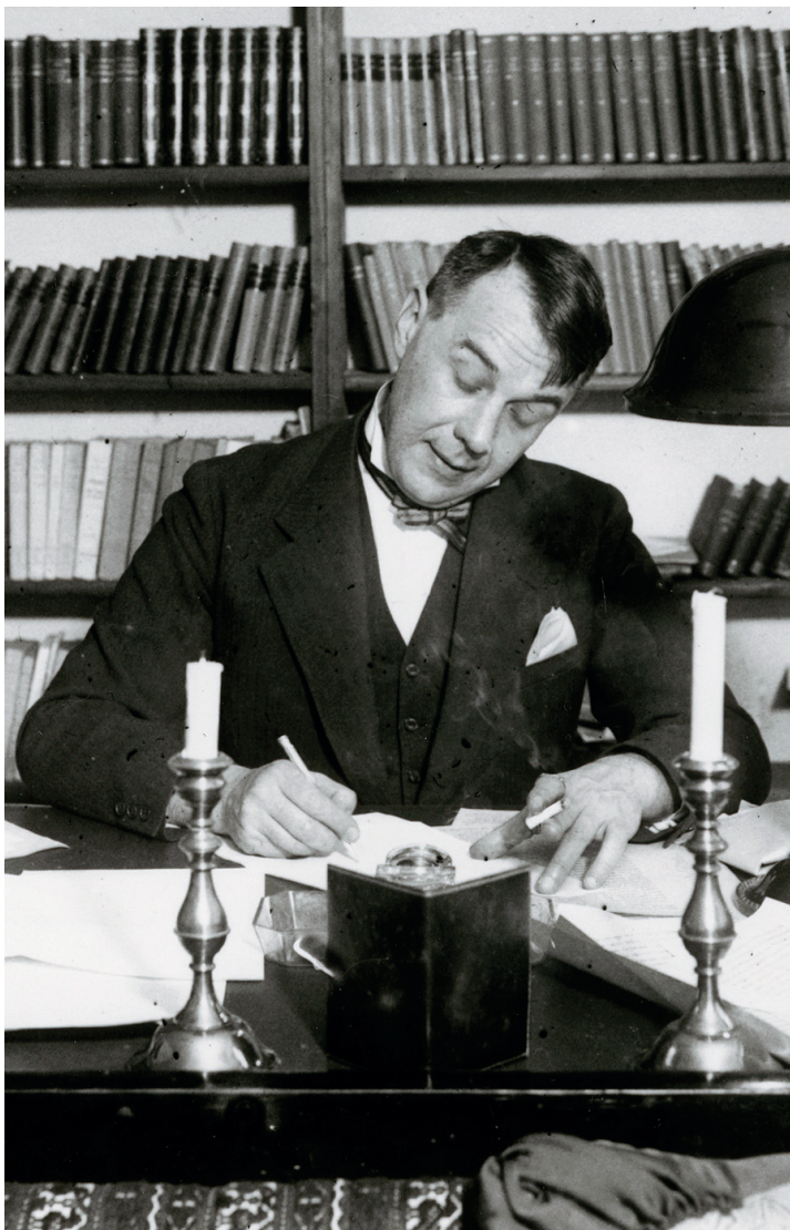
Kosztolányi Dezső (1930, Kellner Jenő felvétele, lelőhely: Magyar Nemzeti Múzeum Történelmi Fényképtára, Ltsz. 85. 1149. – a Magyar Nemzeti Múzeum engedélyével)