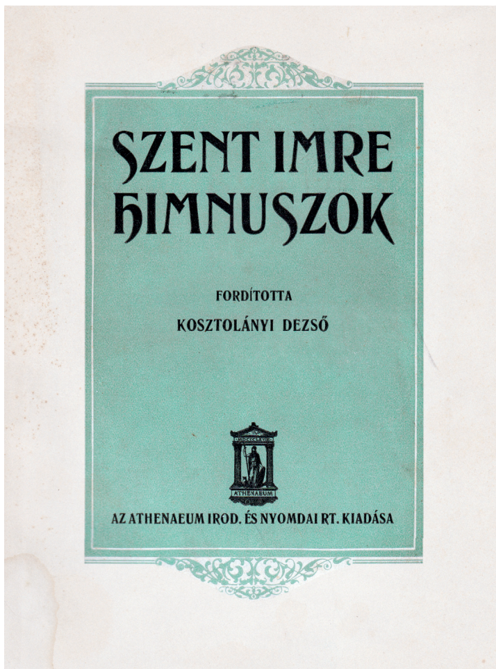
Kötetborító: Szent Imre himnuszok , fordította Kosztolányi Dezső, Budapest, Athenaeum, 1930