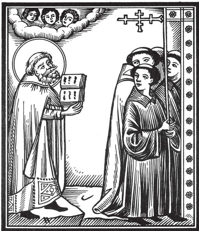
Szent Imre lelkét az égbe viszik