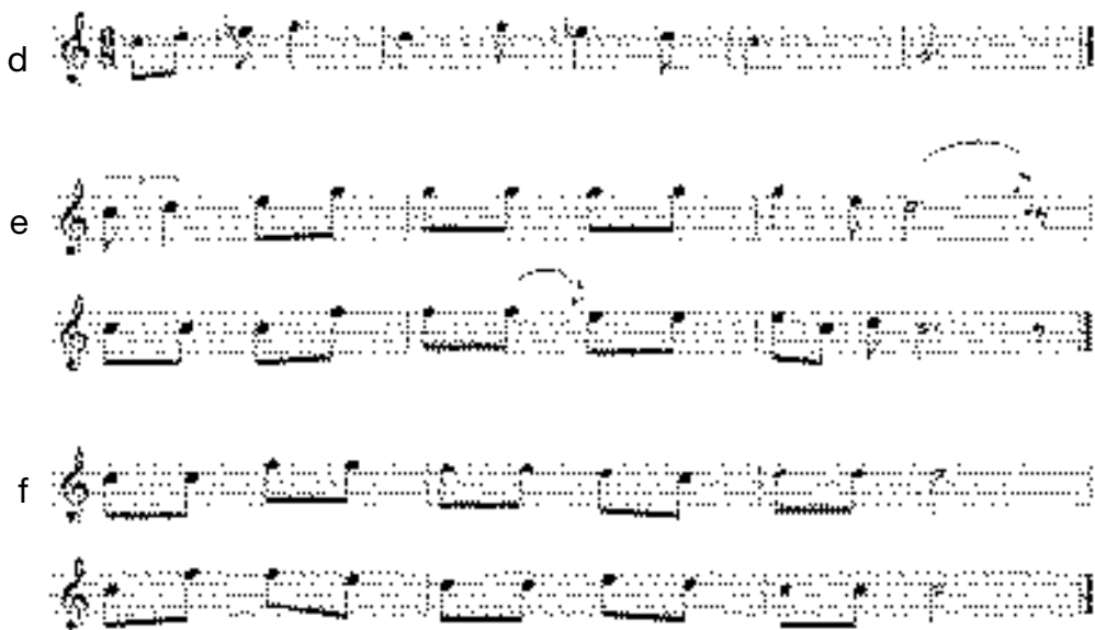
4. kotta. Török népek siratói: d) kirgiz (Sipos 2002-es kirgiz gyűjtés); e) kirgiz (Sipos 2004-es kirgiz gyűjtés); f) karacsáj sirató (Sipos 2000-es kaukázusi gyűjtés)

A kirgiz siratók leggyakoribb formája egy kvartugrással lefelé bővülő dúr-tetrachord domb (4d kotta), de siratóként, leánybúcsúztatóként és a „keserves”-nek nevezhető műfajban előfordul a kétkadenciás kisforma is (4e kotta). A legegyszerűbb karacsáj sirató és a siratókkal rokon dallamok mindegyik sora c -re ereszkedik (4f kotta), de itt is található a kétkadenciás siratóhoz hasonló keserves dallamok. A teljességgel pentaton mongol, csuvas, tatár, baskír, illetve dakota népzében ez a fajta dallam nem tűnik fel. A dakota zenétől nagymértékben eltérő navahó dallamok között sem létezik ez a forma.