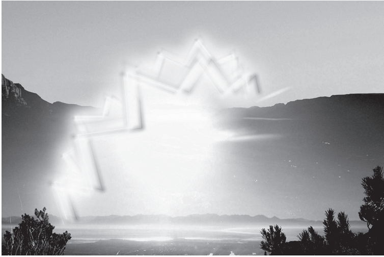
2. ábra: kísérlet a migrénaura megragadására.

mármint tapasztalatfüggő tárgyként, amely érzéki tulajdonságokkal rendelkezik. Az utókép és a migrénaura ugyanis pont ilyesfajta dolgoknak látszanak . Az érzetadat-elmélet szerint egy paradicsom észlelésekor az észlelt piros valójában egy érzetadathoz tartozik, de az élmény maga mást sugall: tudniillik azt, hogy a paradicsomhoz tartozik. Ahogy fentebb érveltem, a helyzet más az utóképek és a migrénaura esetében.