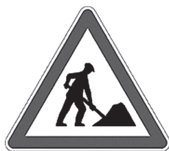
1. ábra: közlekedési tábla

Az észlelés reprezentációs elmélete szerint az észlelési tapasztalatok természetét teljes mértékben az határozza meg, hogy mit reprezentálnak. A reprezentáció általános fogalom; az alábbi jel például azt reprezentálja, hogy az úton munka folyik: