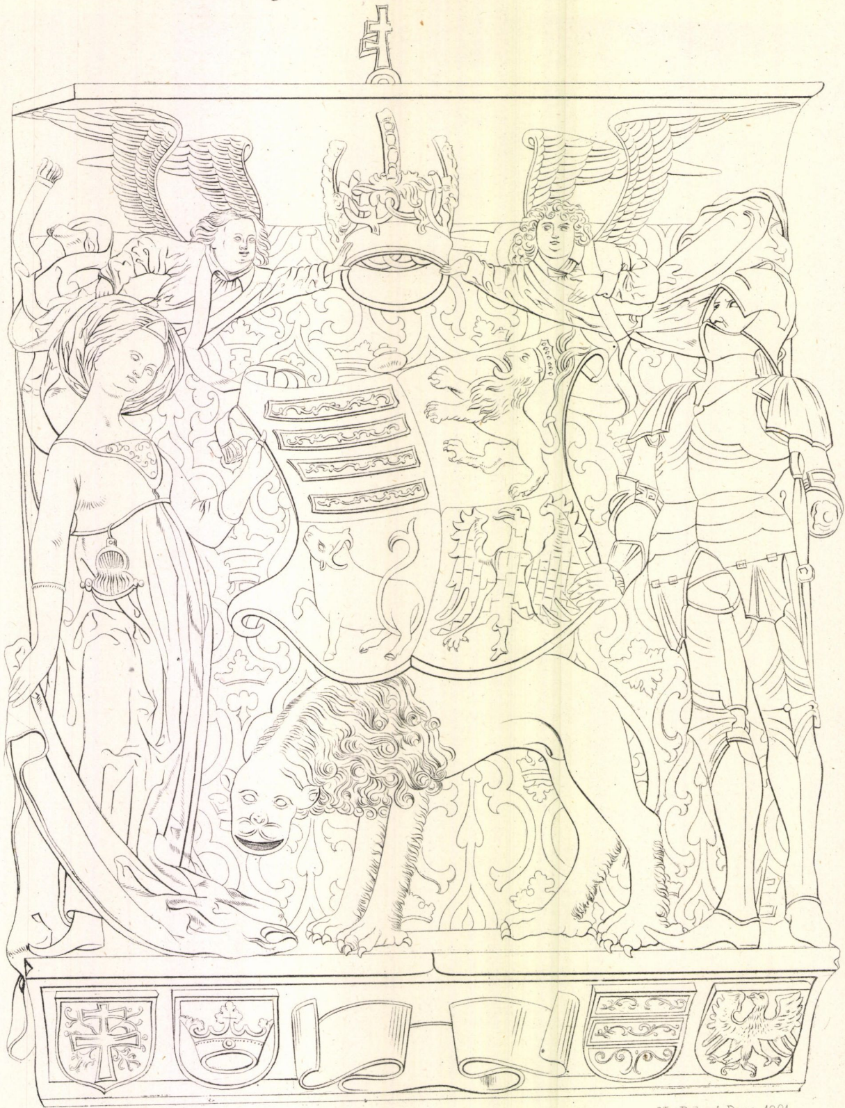
A görliczi városház kapuja felett. Ny. Rohn A. Pest. 1861.