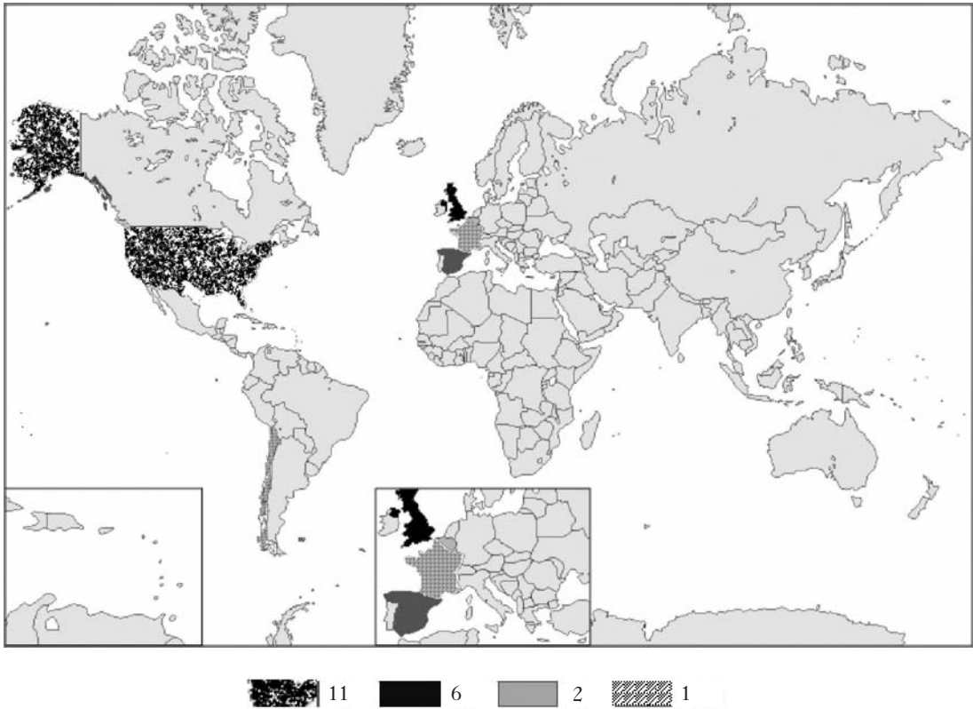
3. ábra A vizsgált kutatásokhoz biztosított összes támogatás és forrás száma országoként