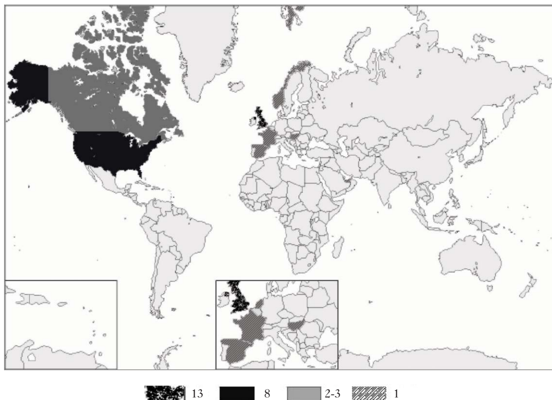
2. ábra A vizsgált cikkek geográfiai eloszlása a kutatások szerzőinek intézményi affiliációja szerint

A vizsgált kutatásokat finanszírozó grantek 61%-a 6 szintén az Egyesült Államokból és az Egyesült Királyságból származik (lásd 3. ábra). A támogatások eloszlásáról elmondható továbbá, hogy a saját adatfelvétellel operáló empirikus kutatások 71%-ához a kutatóknak sikerült extra külső forrást szerezniük, míg a meglévő adatokat elemző és a nem-empirikus kutatások esetében ez az arány mindössze 25%-os. Az empirikus kutatásoknál is kiemelt volt a kvantitatív elemzések támogatottsága a kvalitatívokhoz képest, a kvantitatív kutatások 20 különböző forrásból tudtak támogatást szerezni, míg a kvalitatív kutatások csak 12-ből 7 ; ez a különbség jóval magasabb, mint amit a kvantitatív és a kvalitatív kutatások számaránya (12:10) indokolhatna.