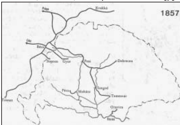
Utazási, kereskedelmi, munkahelyi rádiuszok változásai egy generáción belül. A vasúthálózat fejlődése Magyarországon, 1957–1890