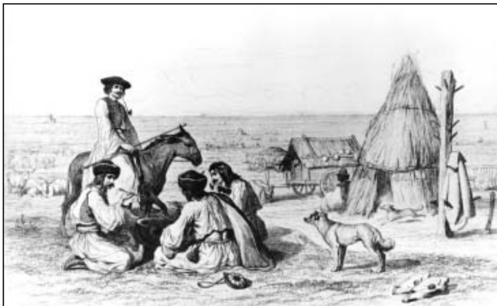
Nádkunyhó, gulya, bogrács. Élet a pusztán, 19. Század közepe

Az egyénnek mindig is volt életrádusza. És ugyanígy volt mozgásrádusza az intézményeknek. Területileg meghatározható kör, amelyen belül hatását, működését kifejthette. Hadseregnek, felvonulási és megszállási hatóköre. Ugyanígy az ipar és kereskedelem-szervezetnek, kulturális áramlatoknak. Az egyén életének mozgáskörét behatárolta mestersége, sőt lakó-