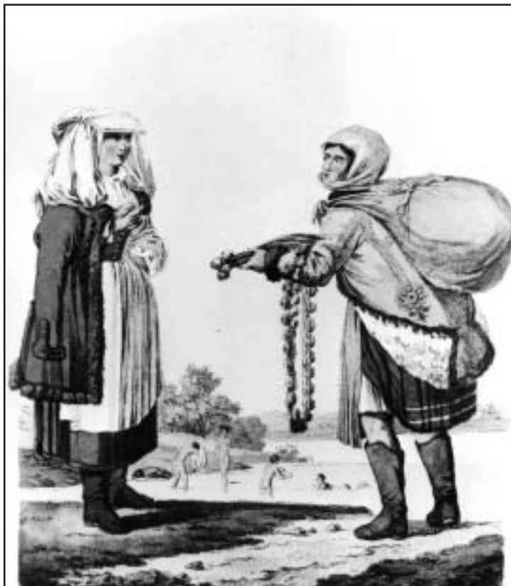
Piacra menő asszonyok, 19. század eleje

A térképeken elbeszélte történelem a történet szemléleti váltás sürgetője is kíván lenni.