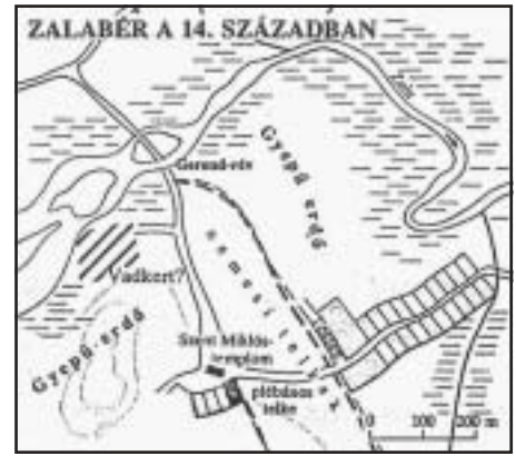
Község és határa. Zalabér a 14. század fordulóján

Térképen elbeszélni egy nép életét – most kínálja a lehetőséget, hogy figyelmeztessünk az emberi környezet (társadalom) és természeti környezet harmóniájának fontosságára. S arra, hogy az új, az individuális társadalomszemlélet már látja: az egyén kiegyensúlyozott életéhez nemcsak az anyagi javak, az emberi környezeti viszonyok, de az egyén és természet új típusú harmóniája is szükséges. Az ember és állat-, növényvilág, ember és látott környezetének harmóniája. Új típusú, tudatosan megélni akart kölcsönviszony. A térképen – mikor kezdjük adatainkat ráképezni és rárajzolni alaptérképeinkre – domborzat, vízrajz, növényvilág van jelen.