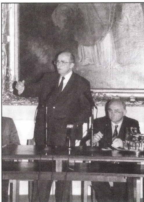
Habsburg Ottó előadást tart az Akadémián, 1997

Egyszerűsítve: itt, Kelet-Európában is ezt a helyet keresik. És a helyi társadalmak – legalábbis úgy látszik – visszafogadták őket.