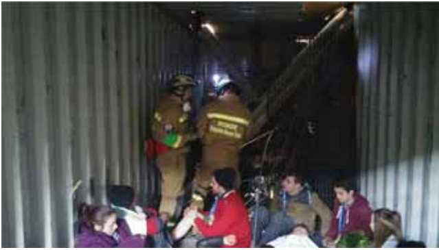
MENTŐK ÉS MENTENDŐK