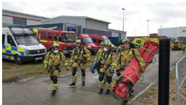
ÚTBAN A BEVETÉSRE

A HUNOR Mentőszervezet 2017-ben esedékes újraminősítésének egyik feltétele, hogy a csapat a 2012-2017-es időszakban legalább egy alkalommal, teljes kapacitással alkalmazásra kerüljön, vagy pedig gyakorlaton vegyen részt, aminek a londoni gyakorlat megfelelt. Ezen a gyakorlaton a magyar csapat nehéz kategóriájú létszámmal és felszereléssel vett részt, amely fontos állomása volt az ENSZ INSARAG (Nemzetközi Kutató és Mentő Tanácsadó Csoport) külső újraminősítésének (IER). A HUNOR 2012. évi Nehéz Városi Kutató és Mentő (Heavy USAR) kategóriájú újraminősítését kívánja eredményesen megerősíteni.