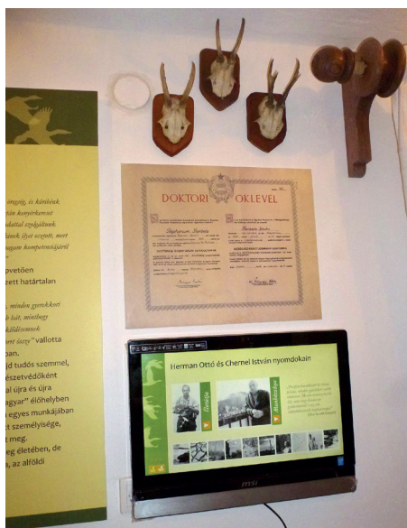
4. ábra. Interaktív számítógépes fotóalbum és játék Sterbetz István életpályájáról

Két film, a 2010-ben Sterbetz Istvánnal készült utolsó beszélgetés és tanítványainak visszaemlékezései hozza vissza a tudós-író-természetvédő személyt a jelenbe, a kiállításba.