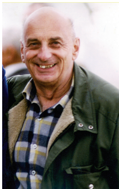
1. ábra. Sterbetz István portréja Fig. 1. Portrait of István Sterbetz

Az iskoláskorú gyerekek nyelvére lefordítani ezt a témát, kihívást jelentett. Ebben az MTM gazdag tapasztalata és kiállításrendezési módszertana sokat segített. Mít üzen a kiállítás a diákoknak? A természet változatos, a sokféleség meg-