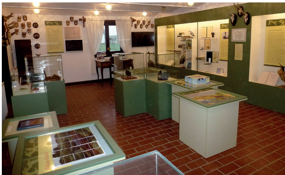
2. ábra. Tudománnyal a természet védelméért – Sterbetz István Emlékszoba enteriőrje Fig. 2. Science for Nature conservation – The interior of the István Sterbetz Memorial Room

Sterbetz István életművének fő jellemvonása, hogy nem választotta ketté a tudományt, azaz az elméletet a gyakorlattól; hogy számára a terepi tapasztalatokból leszűrt tudományos összeggések újra hasznosítható tudássá és gyakorlattá váltak. Megszerzett ismereteit többféle formában is megosztotta: cikket írt, fényképezett, népszerű könyvet írt, előadásokat tartott és megalapozta a Dél-Alföld gyakorlati természetvédelmét. Így életművét talán a hasznosított tudás fogalommal jelölhetnénk leginkább. A kiállításrendezési koncepció alapja tehát Sterbetz István alapelve volt: tudományos megismerés, változatos tudásmegosztás és az ismeretek gyakorlati hasznosulása. Ezért lett a kiállítás címe: „Tudománnyal a természet védelméért”. Ez a rendezési elv a kiállítás szerkezetében és eszközeiben is tükröződik (2. ábra).