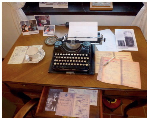
3. ábra. Sterbetz István és felesége, Telepy Katalin tárgyi hagyatéka (kivéve az írógépet) az életpályát bemutató részéből

A kiállításban a szövegek túlnyomó része Sterbetz István saját szövegei, hiszen mindent leírt magáról és kiírt magából élete során. Így a látogatók a szövegeken keresztül saját maguk fedezhetik fel az összetett személyiséget, könnyebben megfejtethik a tudós-író motivációit és sokkal inkább embernek, semmint távoli tudósnak érzékelhetik őt.