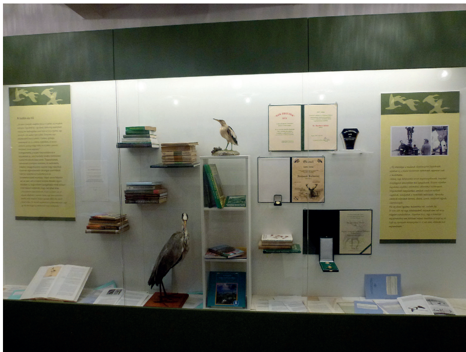
5. ábra. Részlet az emlékszoba „Tudós és író” c. részéből