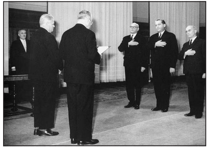
Református egyházi vezetők eskütétele, 1964

tortól a családi perpatvarokig). Mindezek a lehetőséget adják ahhoz, hogy a lelkész, túl Isten házán is, a közösség mindennapi életében részt vegyen, annak „funkcionáriusává” válják. És a lelkész – így közvetve az egyház is – itt, a keleti országrész területein a közösségi élet szervezője, átvesz olyan szerepeket is, amelyeket normálisan működő állami és gazdasági élettel rendelkező területeken nem kell magára vállalnia. A társadalom napi életigénye és az egyház természetesen kölcsönhatásba kerülnek, az egyház felszívja magába, beolvasztja „jellemzői” közé azokat a szerepeket is, amelyek teológiai értelemben nem tartoznak célkitűzései közé. A magyarországi református egyház éppen ezért tarthatta magát úgynevezett népi egyháznak. Ez magyarázza megítélésem szerint azt, hogy majd a 19. század értelmiségei között oly nagy számban találjuk a református lelkészeket gyülekezetük, közösségük történelmét feldolgozó íróemberként (Zoványi Jenő és Ladányi Sándor kutató-