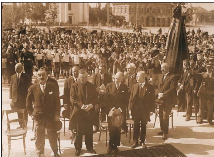
Jubileumi ünnepség a mezőtúri református gimnáziumban, 1930