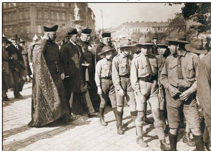
Elindult az ünnepi menet Ravasz László püspökké avatására, 1921