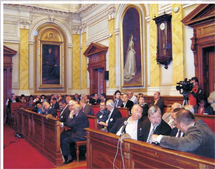
A közönség a városháza dísztermében

Értelmezni kell a vidéki városoknak a szerepét saját személyes környezetükben. Hódmezővásárhely azért sajátos város, mert más, például nyugat-dunántúli településekhez vagy településszerkezetekhez képest itt egy város meghatároz és karizmatikusan ural egy térséget. Ezt sokkal inkább lehetőségként kell felfogni. Magyarországon nem olyan településpolitikára van szükség, amely a vi-