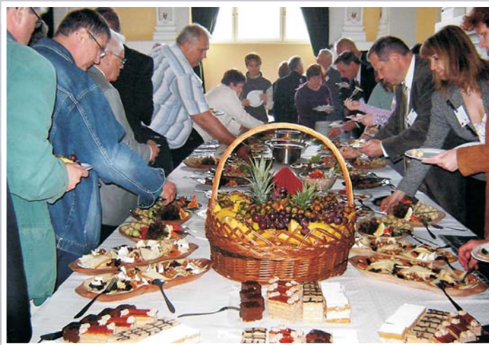
A helyiek mindig kiváló vendéglátása a Fekete Sasban

déki kistelepüléseket megfosztja lehetőségeiktől. Nagyon fontos lesz majd például az oktatáspolitiká ebből a szempontból. Szakmunkásokat akarunk képezni, akik 14 éves koruktól folyamatosan dolgoznak, és a munka világában kiszolgálják az egyébként a magyar GDP 60%-át adó nagy gazdasági hálózatokat, vagy pedig azt mondjuk, hogy a mi eszményünk 100 év óta nem változott, a kiművelt emberfő minősége a legfontosabb, a minél több kiművelt emberfő Magyarországon? Ez a döntés ugyanis meg fogja határozni, hogy milyen iskola lesz egy 1000, 10 ezer vagy 20 ezer fős településen. Nem véletlen, hogy Hódmezővásárhely az elmúlt 30 esztendőben a saját erőforrásait feltáró, azokra építő, a modernitást, a fejlesztéspolitikát a tevékenységének a középpontjába helyező, nyitott, integráló, nem provinciális, a minőségre, a tehetségre, a sikerre törekvő várospolitikát folytatott. A városi sikerek mindig azokban az időszakokban születtek, amikor ezek az értékek voltak a legfontosabbak. És egy szociális értelemben az országnak a keleti szegletéhez tartozó, nagyon nehéz helyzetben lévő városban megoldásokat kell letenni az asztalra.