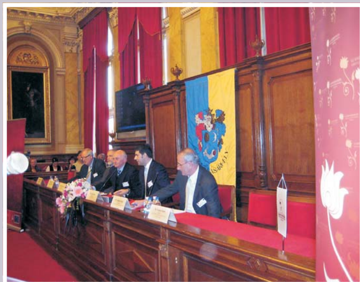
Munkában a fórum Elnöksége

A mezővárosok sikere mindig összefüggött azzal, hogy a kormány mit gondolt a vidékről és a mezővárosról. Trianon jó hivatkozási pont e témakörben is, mert a Trianont követő első néhány kormánynak tudatos vidékpolitikája volt: pontosan felmérte politikai, társadalompolitikai és gazdasági okoknál fogva, hogy az elveszített regionális vagy vidéki centrumok helyett új centrumokat kell felépíteni, és ezért a kormányzati erőforrásokat, természetesen politikai szövetségest is keresve, számos alföldi város újjáépítésére, feltámasztására, konszolidációjára fordította. (Kecskemét, Debrecen, Szeged, Hódmezővásárhely: a felsőoktatás újjászervezése, az intézmények elhelyezése.) Ezek nem rögtönzött politikai, hanem tudatos társadalompolitikai döntések gyümölcsei voltak. Az Alföldet – egy nagy társadalmi és gazdasági csőd után – a Bethlen-kormány lehetőségnek tekintette, és a rendelkezésre álló forrásokat ezeknek a közösségeknek az újjászervezésére használta fel. (Ne felejtjük el, hogy 1914 előtt az