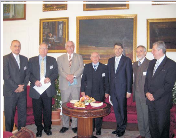
Az Elnökség az V. Országos Vidéki Fórum megkezdése előtt

Az elmúlt húsz év Magyarországa, a rendszerváltás Magyarországa nem tudott mit kezdeni a vidékkel, a vidéki mezőváros fogalmával. Az egyik megközelítés romantikus giccs volt. Ettől szeretném városom polgárait megóvni. Nem múltba hajló historizmus kell ma Magyarországon, és a jövő sem szólhat erről. A történelmi tanulságok levonására szükség van, de arra, hogy ez legyen a szervezőerő, a kötőszövet, attól óvni mindenkit. Miként attól is, hogy a vidékre – „üzemhatékonyági megközelí-