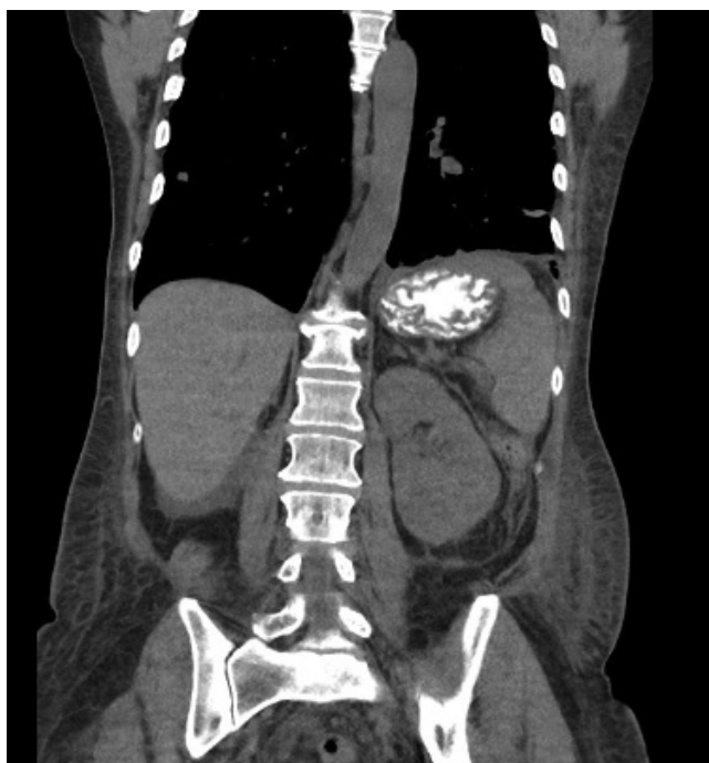
2. ábra | A bal vesé szinte teljes egészében infiltráló daganat

összes daganat között 1%-nál ritkábban fordul elő [1, 2]. Egy tíz betegre terjedő retrospektív vizsgálatban a medián túlélési idő 7,2 hónap volt [3]. A következőkben egy Bellini-tumoros betegünk esetét mutatjuk be.