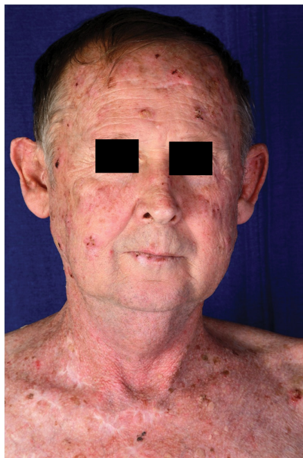
1. ábra | Számos aktinikus keratosis, NMSC és a korábbi műtétek hegei