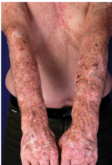
2. ábra | A napfénynek kitett és a fénytől védett bőrtületek közötti különbség