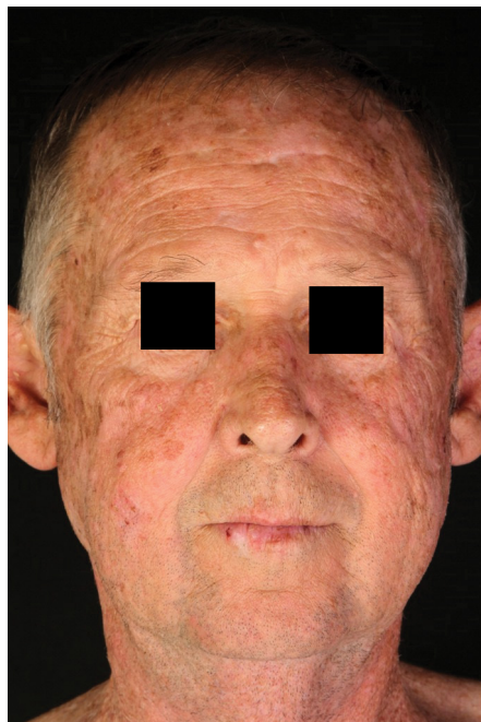
3. ábra | 6 hónappal az everolimusra való áttérést és cryotherapiákat követően