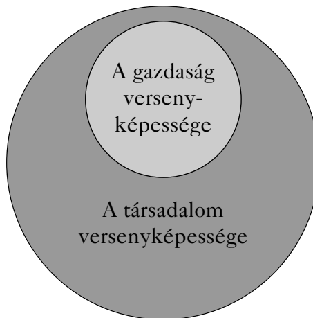
2. ábra: A nemzetgazdaság versenyképességének hatóterei