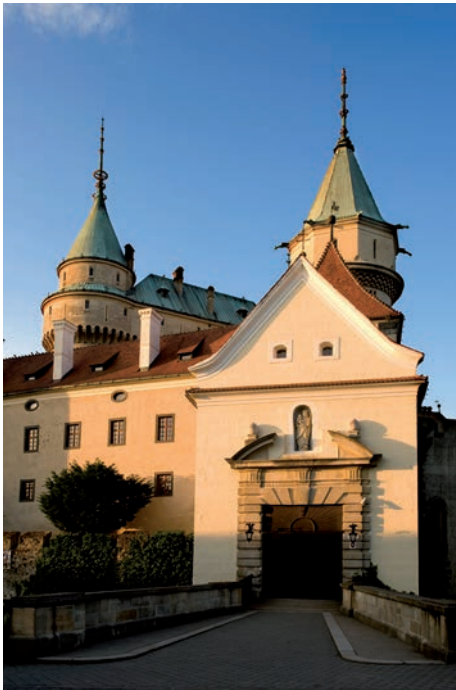
4. kép. Bajmóc (Bojnice), várkastély, Hubert J. (1889–1910).

A 19. század második felének historizáló stílusainak széles mozaikjában kiemelkedő szerephez jutottak a középkori ihletek. Árnyalatainak rendkívüli tárháza román, gótikus, bizánci és keleti formákat vonultat fel. Annak köszönhetően, hogy területünk nyitott volt a különböző irányokból érkező hatások előtt, sajátos színezetet kapott mindenekelőtt a neogótika. A külső impulzusok tekintetében a Monarchia központjai, Bécs és Budapest játszottak döntő szerepet, de külföldi, angol, francia és keleti ösztönzésekre is bukkanhatunk a régió építészetében.