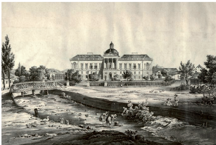
3. kép. Kistapolcsány (Topoľčianky), kastély, Pichl A. (1818–1825). Wolf F. litográfiája.