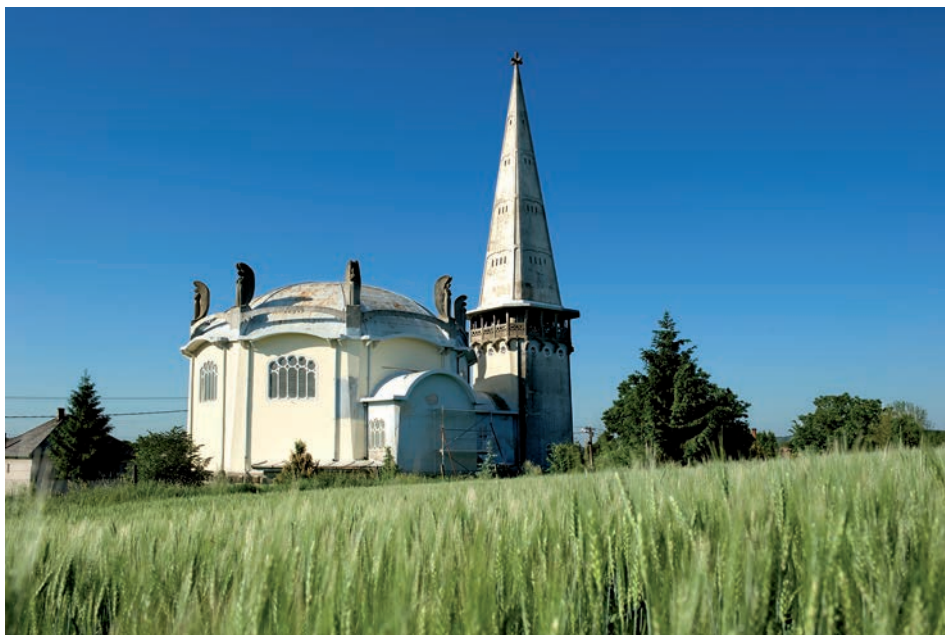
8. kép. Rákosmulyad (Muľa), Szent Erzsébet-templom, Medgyaszay I. (1908–1910).

Sokkal erőteljesebben érezte hatását a Lechner Ödön (1845–1914) és tanítványai által képviselt magyar szecesszió. Ennek jegyében lakóházak és iskolák épültek Pozsonyban, Rozsnyón (Rožňava), Losoncon (Lučenec), Kassán vagy Lőcsén. Lechner pozsonyi hagyatéka, a Szent Erzsébet- (ún. Kék) templom és gimnázium (1907–1913, ill. 1903–1908) a szecesszió, valamint a román és a bizánci építészetre való utalások figyelemreméltó fúzióját szemlélteti.