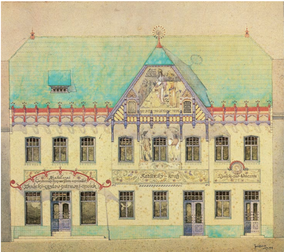
9. kép. Szkolca (Skalica), Egyleti ház, Jurkovič D. (1904–1906).

Más irányba tartozott Medgyaszay István (1877–1959). Bécs hatása, a magyar szecesszió, a vernakuláris mozgalom és a francia racionalizmus elemei Ráosmulyadon (Muľa), Magyarország első vasbeton szerkezetű templomában csúcsosodtak ki (1908–1910, 8. kép ). Erdélyi inspirációk jutottak érvényre az ógyallai (Hurbanovo) Szent László-templom tervén (1908–1910). A regionalizmus jegyei a szecesszióval kölcsönhatásban egyre gyakrabban jelentek meg más tájakon is – Árvában, Kelet-Szlovákiában, s kiemelten a tátrai klimatikus fürdők környezetében. Egyedi architektúrájuk a szecesszió, az alpesi építészet, a historizmus és helyi építésmód elemeinek ötvözetét szemlélteti. A tátralomnici (Tatranská Lomnica), az ó- és újáttrafüredi (Starý, Nový Smokovec), a csorbatói (Štrbské pleso) szállodák, szanatóriumok, magánvillák és nyaralók egyéni megoldásai mögött a Tátra környezetét érzékenyen befogadó alkotók álltak, mint a szepesi származású Hoepfner Guidó (1868–1945) és Majunke Gedeon (1854–1921), de nem hiányozhatott a „nagyvilági”, a vajdasági Kölpényből induló Harminc M. Mihály sem.