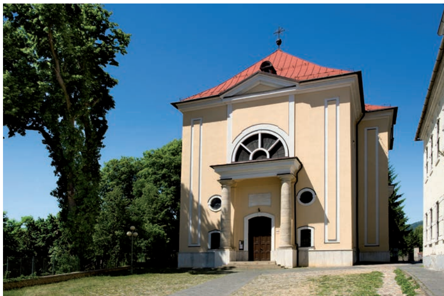
2. kép. Besztercebánya (Banská Bystrica), evangélikus templom, Pollack M. (1800–1807).