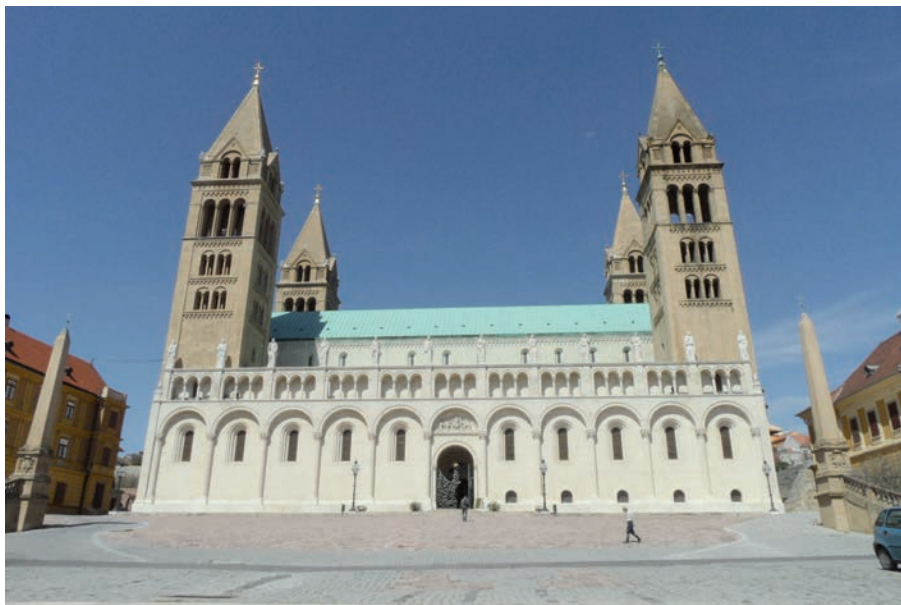
3. kép. A pécsi dóm