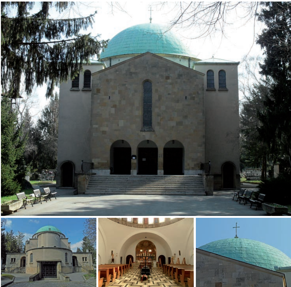
7. kép. A megépült kápolna főhomlokzata, szentély felőli homlokzata az altemplomi hátsó lejáróval, a belső tér részlete és a kupola kívülről

A jegyzőkönyv részletes ismertetést ad a bírált tervekről, melyeknél legtöbb esetben a funkcionalitást, a katolikus liturgiához való nem megfelelő tereprendezést, illetve a terepfedést kifogásolja. Egyértelműen elítéli a kizárólag lapos tető használatát, részben mert nem alkalmas temetőkápolna funkciónak, részben pedig mert az éghajlati viszonyok számára nem megfelelő. Továbbra is érezhető tehát a fent bemutatott ellenszenv, a modern formavilág ellenesség, amely már a vasbetont, mint templomok számára alkalmas építőanyagot elfogadta, azonban az egyház szigorú hagyományaihoz való ragaszkodását leginkább az alaprajzban és az újfajta terepfedési megoldásokban látja. Az új egyházművészetet tehát a pécsi temetőkápolna pályázata esetében, a New Yorkot és Párizst megjárt ifj. Nendtvich Andor és Weichinger Károly megoldásai képviselték a legjobban, vagyis az ő elképzelésük állt leginkább közel