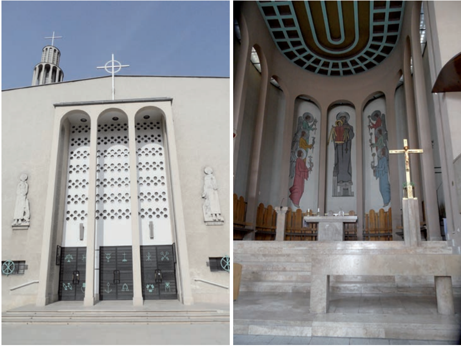
4. kép. Rimanóczy Gyula Páduai Szent Antal-temploma, Budapest

és a liturgiától, hiszen a cél nem változott, a rendeltetés egy, a tartalom csak új kifejezést talált. 15 Az új egyházművészet – beleértve a képző-, az iparművészeteket és az építészetet is – kialakulása és elterjedése hosszú folyamatként jellemezhető, melyben a bevezetőben idézett Somogyi Antal és Jajczay János tevékeny szerepet vállalt azokkal szemben, akik szerint az egyház a múltban már megtalálta a kifejezéséhez leginkább alkalmas stílusokat.