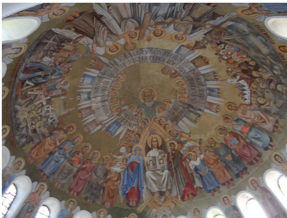
8. kép. A Szent Mihály-templom kupolájának belső dekorációja

A nyertes terv alkalmasságát nem kifogásolta egyik bizottsági tag sem, az egységes véleményt a következőképpen fogalmazta meg a hitelesített jegyzőkönyv: „XIV. A kápolna temetői jellege teljes mérvben meg van. Megoldása minden tekintetben jó. Architektúrája komoly és nyugodt, a homlokzatra két alacsony tornyot helyez a portikusz két oldalára, ami által a kupolának remekül fel felé ívelő vonalát előkészíti. Kupolája nem magas. Kívül a dobba helyezett ablakok ritmikus megjelenésükben előnyösen érvényesülő abroncsot vonnak a kupola köré, mely ablakok a kápolna belső tér fényforrásainak gyönyörű koszoruját alkotják, ami némileg az Aja Szofia hatását idézi fel a szemlélőben és a belső térnek a hely komolyságához mért egyházas hangulatot kölcsönöz. Alaprajzi elrendezése tökéletes, különösen kiemelendő a szentélynek mint külön testnek egy nagy apszisban koncentrikusan beillesztése, ami a szertartások láthatóságát kitűnően emeli. Oldalain a kripta felé való közlekedés szempontjából nagyszerű lehetőséget nyújt, ami a sekrestye és raktár megközelítése szempontjából is kiválóan előnyös. A kibővítésre adott tervezet megvalósulása esetén a kápolna terét oly módon bővítené, hogy a térnyereségen felül még az építészeti elrendezés szépsége megóvatnék. Előcsarnokának kiképzése és fölötte az énekkarzat