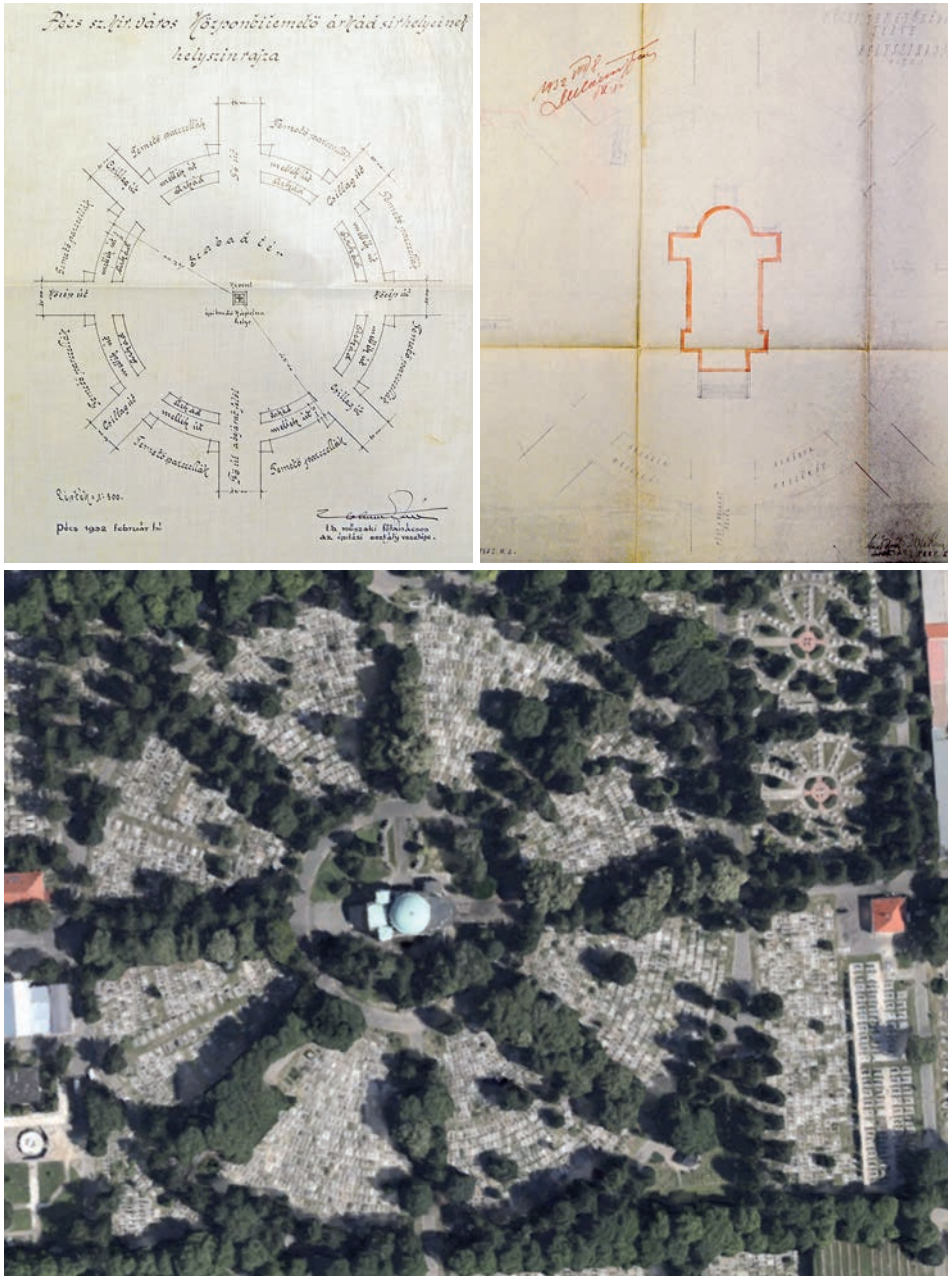
9. kép. A temető helyszínrajzai és a Google légfelvétele (BML, Google Maps)