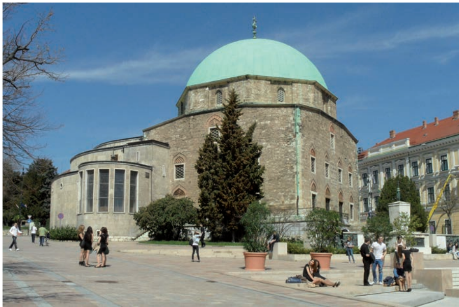
2. kép. Széchenyi-tér a központot jelentő Belvárosi plébániatemplommal, melynek modern bővítését a két világháború között végezték el Kőrmendy Nándor tervei szerint