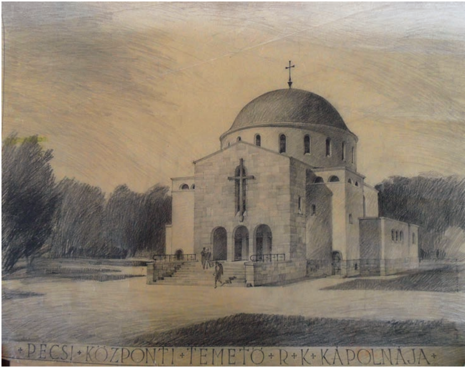
10. ábra. A pécsi temetőkápolna látványterve (MÉM gyűjteménye)

esztétikailag kifogástalan munkáiban a forma mögött a vallásos gondolat él. 59 A kötetbe bekerülő hét építészeti alkotás a korszak kifinomult művei, mind a hazai, mind a külföldi közönség számára leginkább új irányt mutató épületei, melyek az egyházi hagyományokat és a liturgiát szem előtt tartó mintává kell, hogy váljanak. Megjegyzendő azonban, hogy Jajczay válogatása egyértelmű irányt jelölt ki az alkotók és az egyház képviselői számára, s a szerző nem véletlenül helyezte a kötet középpontjába a sajtóviharok keresztüzében sokáig égő alkotásokat. A szigorú szelekció elismert tagja a pécsi temetőkápolna, melynek interieur képe a később elbontott szöszéket is megőrizte az utókor és a kutatás számára. A korabeli recepció a pécsi temetőkápolnát, az új építészetünket méltó módon reprezentáló épületek sorába helyezi, e hozzáállást a mai kor kutatása is szívesen magáévá téve folytatja a diskurzust.