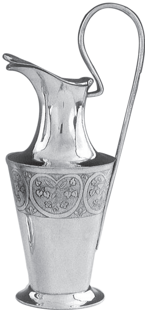
19. Fridericus Becker sen.: Boroskanna. Pozsony-Vártelek, 1813. Magántulajdon

Stangának van egy másik mesterjegye is, a K:1973. Ezzel Kószeghy próbajegy nélküli filigránmívű gombokat ismert a selmebányai múzeum gyűjteményéből, 124 míg ugyanebben a múzeumban Toranová K:1943 próbajeggyel szintén filigránmívű csatot, a Szlovák Nemzeti Múzeumban hasonló gombot, 125 ugyancsak a Szlovák Nemzeti Múzeumban pedig új 10-es próbajeggyel két filigránmívű gombot talált. 126