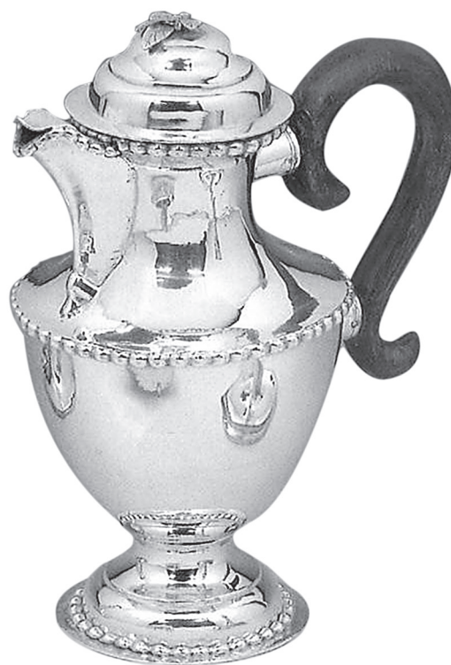
16. IN mester: Kávéskanna. Nagybánya, 1780 körül. Magántulajdon

1993-ban budapesti árverésen szerepelt egy sőtartó, melynek díszé a szárára csavarodó, koronából ki-