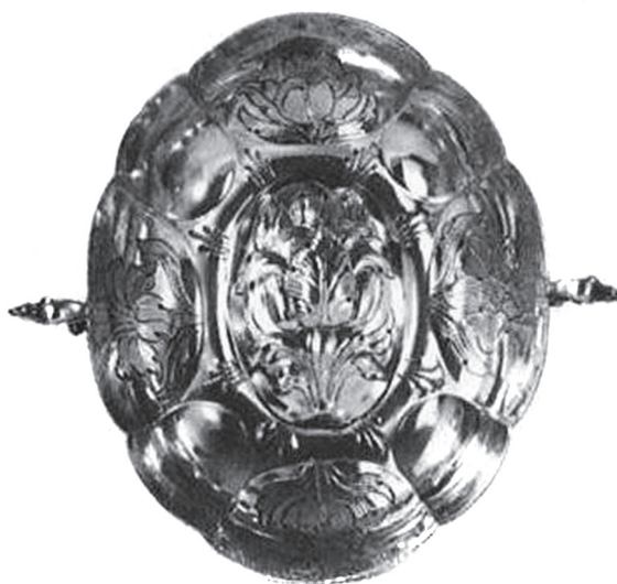
17. AW mester: Csemegéstálka. Nagybánya, 17. század közepe. Magántulajdon

növő kígyó volt. 96 A nagyváradai próbajegyű tárgy mesterjegyét tévesen olvasták Leopold Ausländer jegyének. A félig kopott jegy olvasata iránytól függően „SL” vagy „JS” lehetett csak. A sőtartó 1994 márciusában a Polgár Régiségboltban bukkant fel újra. 1997-ben egy budapesti magángyűjteményben megtalál-