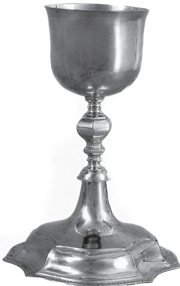
13. Gyulay József: Kehely. Nagybánya, 1780. Magántulajdon