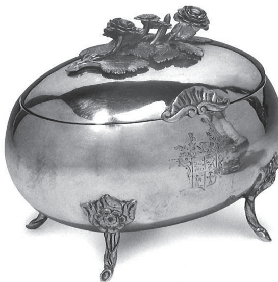
9. Andreas Hanzely sen.: Cukortartó. Késmárk, 1780 körül. Magántulajdon

késbakok akantuszlábakon selmebányai, egy fanyelű lábas, egy fedelén bogyóval díszített lábas és két sótartó késmárki és két gyertyatartó tállyai magántulajdonban. A tárgyakon a K:922, 923, 924