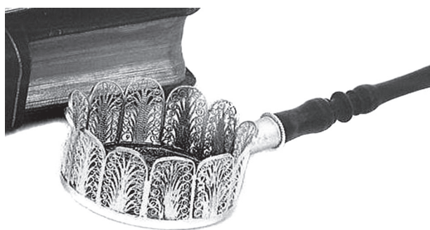
1. Engel Sámuel: Teaszűrő. Óbuda, 1820 körül. Magántulajdon

het. 20 Hármuk közül egyikük készíthette 1833-ban az egykor pesti magángyűjteményben volt B:104 mesterjegyű cukorfogót és a Budapesti Történeti Múzeum tinta-, porzó- és tolltartóját. 21 Egészen különleges az ugyancsak 1833-ban készült és B:104 mesterjegyű, négykarú kandaláberbetétekkel kiegészített gyertyatartópár, amelyet Bécsben árvereztek el 2005-ben. 22 Óbudai ötvöstől még hasonlót sem láttam.