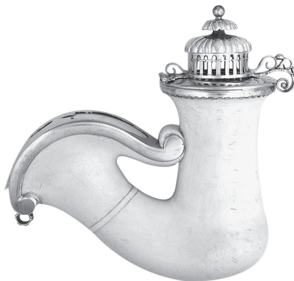
5. Adler József: Tajtékpipa, ezüstszereléssel. Óbuda, 1835. Magántulajdon