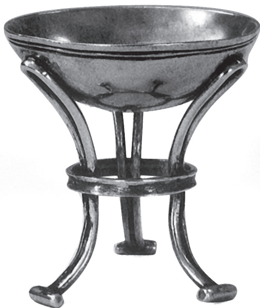
4. STERN jelzéssel: Fúszertartó. Óbuda, 1840 körül. Magántulajdon