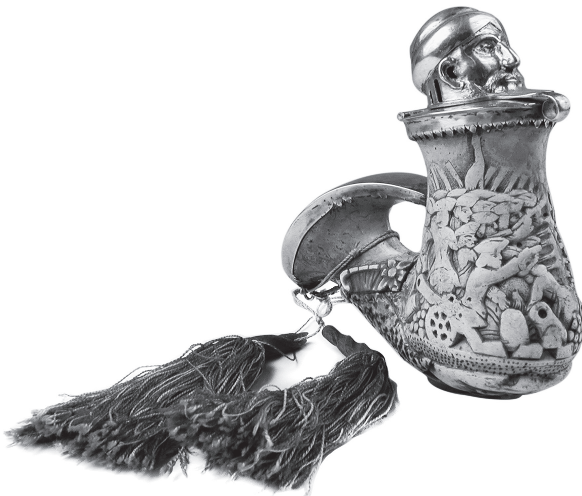
6. Zöllner Ágoston: Tajtékpipa, ezüstszereléssel. Kalocsa, 19. század közepe. Magyar Nemzeti Múzeum

A városjegy leírása alapján egy korábbi cikkemben Temesvárra gyanakodtam. 49 Hogy nem teljesen alaptalanul, igazolja, hogy a múzeum pipagyűj-