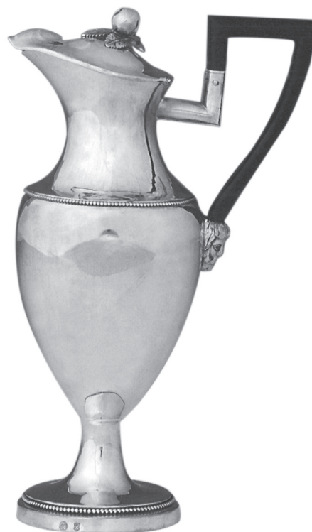
8. Jacobus Olmützer jun.: Kávéskanna. Késmárk, 1810 körül. Magántulajdon

A két Hanzely András, apa és fia, a 18. század közepe és a 19. század közepe között dolgozott Késmárkon. Az idősebb Hanzely András 1742-ben született, mesterként említik 1772 és halála 1816 között. Az ifjabb Hanzely András 1780-ban született, többször említik 1802 és 1828 között. 1847-ben halt meg. 67 Munkásságuk a mesterjegyek és próbajegyek alapján nem, csak esetleg a tárgyak stílusa alapján választható szét. Kószeghy az idősebb Andreas Hanzely munkájának tartja a K:946 mesterjeggyel készült evőeszközöket és egy kávé- és tejszínes kannát különböző lőcsei magántulajdonból, illetve a K:947 mesterjeggyel, fafüllel készült kávéskannát ugyancsak lőcsei magántulajdonból. A K:948 mesterjeggyel készült tárgyakat is az idősebb Hanzelynek tulajdonítja, de megjegyzi, hogy ezeket akár az ifjabb mester is készíthette. Ezek: