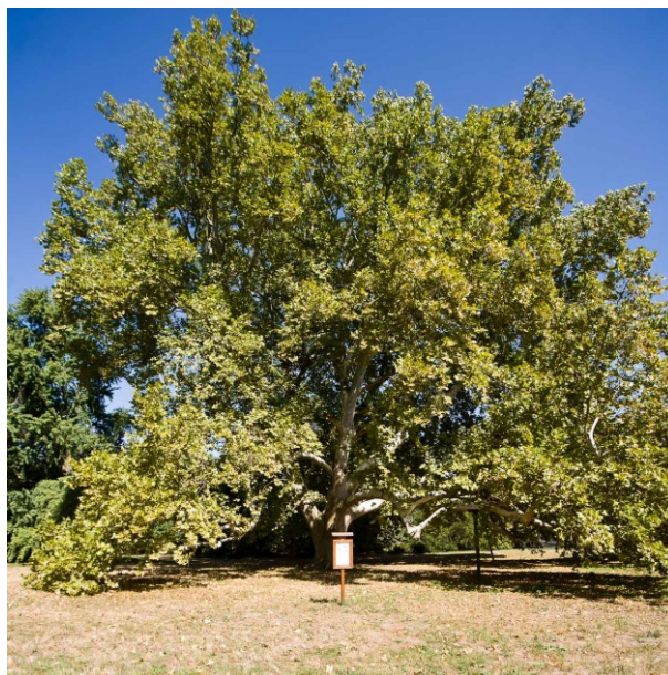
6. ábra Cégénydányádi öreg hölgy Figure 6. Sycamore tree in Cégénydányád, Hungary

Zsigmond ültette az 1800-as években, amikor is a kastélyhoz tartozó angol kertet telepítette (HTTP9).