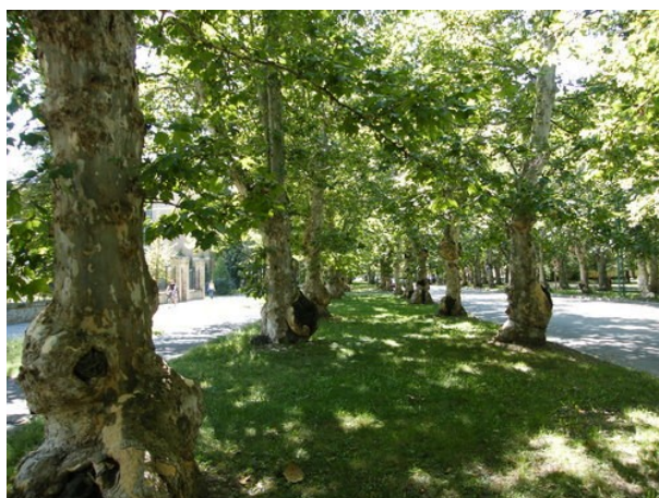
7. ábra Kossuth utcai platánfasor Kiskunfélegyháza Figure 7. Sycamore tree row of Kiskunfélegyháza, Hungary

Kiskunfélegyháza védett fasorai közül a legelső és a legismertebb a Kossuth utcai platánfasor (7. ábra). A városházától a vasútállomásig vezető utcát szegélyező juharlevelű platánfasort a 19-20. század fordulóján telepítették. A fák ápolásra szorulnak, sok helyen fertőzöttek. A főutca forgalma miatt gyorsan szennyeződnek, így a gombás megbetegedések szinte minden fánál előfordulnak. A probléma megoldásán az önkormányzat szakemberei dolgoznak.