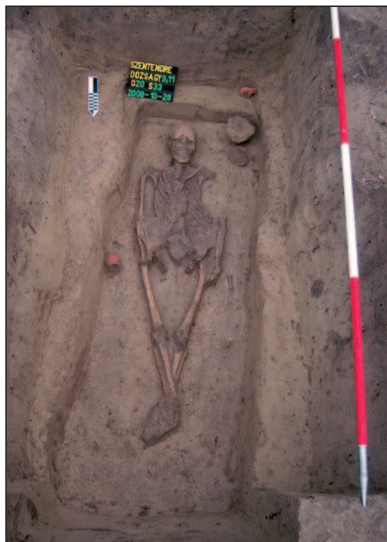
Szentendre–Dózsa György út 9–11, 33/20. sír

2008. április 28. és május 15. között elvégeztük a Szentendre, Dózsa György út 9–11. régészeti lelőhelyen, a 381, 382 hrsz-ú ingatlanokon a próbafeltárást. Ennek során a sárga altalajba ívelten mélyülő, homogén sötétbarnás betöltésű jelenséget – egy természetes vízfolyás nyoma –