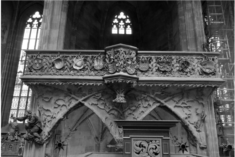
ABB. 1: Das königliche Oratorium im Veitsdom.

des böhmischen Königs Wladislaw II. Jagiello (1471–1516), sondern auch das verzierte Wappen des Königreichs Ungarn darauf zu sehen ist. Ungarns Thron übernahm Wladislaw mit seiner Krönung Mitte September 1490 in Stuhlweißenburg.