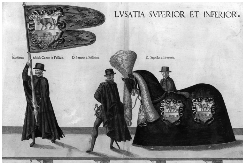
ABB. 3: Die gemeinsame Fahne der Ober- und Niederlausitz im Leichenzug Ferdinands I., Wien/Prag, August 1565.

Während die Stamm- und die Anspruchsländer der Ungarischen Krone an diesen Zeremonien durch fünf Fahnen (Ungarn, Dalmatien, Kroatien, Slawonien bzw. Bosnien, Serbien, Kumanien und Bulgarien mit einer gemeinsamen Fahne) veranschaulicht wurden, erhielten die fünf Länder der Böhmisches Krone vier Fahnen, das vereinte Wappen der Ober- und Niederlausitz stand nämlich auf einer gemeinsamen Fahne [Abb. 3]. Es ist zu betonen, dass die Fahnen — entsprechend der zeitgenössischen zeremoniellen Praxis — einander in einer strengen Rangfolge der einzelnen Staaten und Länder, gemäß der Herrschertitulatur, folgten. Die Fahnenträger wiederum wurden von den Führern der ungarischen und böhmischen politischen Elite aus den eigenen Reihen ausgewählt. Schließlich verdient es besondere Aufmerksamkeit, dass auf diesen neun Fahnen — den Jagiellonen-Adler und das luxemburgische Löwenwappen verständlicherweise ausgenommen — all die Wappen figurieren, die auch im königlichen Oratorium zu sehen sind. Aber diese Wappen wurden später auch auf dem Zinnsarg des ebenfalls im Veitsdom beigesetzten Kaisers Rudolf II. angebracht. 12 In Kenntnis all dieser Fakten ist es interessant nachzuforschen, seit wann die ungarischen Herrscher diese Wappen benutzten. Dies kann nämlich auch die Entstehungsgeschichte und die Interpretation der Wappenreihe des königlichen Oratoriums in Veitsdom präzisieren.