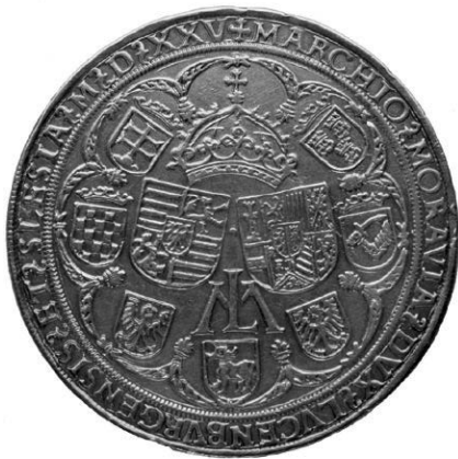
ABB. 6: Die Silberschaumünze von Bernhard Beheim, 1525, Kremnitz.

Dieselbe habsburgische Wirkung zeigt eine verzierte Silberschaumünze oder Halbtaler (bzw. auch der Guldiner König Ludwigs), die Bernhard Beheim 1525 in der berühmten Münzanstalt Ungarns, in der Bergstadt Kremnitz (heute Kremnica in der Slowakei) zu Ehren von König Ludwig nach dem Vorbild der doppelten Reiterguldiner Kaiser Maximilians I. (Hall, 1508/1509) prägte [Abb. 6]. 23 Auf der Rückseite waren die Länder der Böhmisches Krone — ebenso wie im Oratorium — neben dem böhmischen Löwen durch den mährischen und den schlesischen Adler sowie den Ochsen der Lausitz, die Gebiete der Ungarischen Krone hingegen durch die dalmatinischen drei Leopardenköpfe, den geschachteten Wappenschild Kroatiens und den bosnischen Schwertarm vertreten. In diesem Fall ist die Verbindung mit dem Innsbrucker Hof von Kaiser Maximilian noch eindeutiger. Zum einen stammte Beheim aus der Tiroler Stadt Hall, zum anderen kam er 1524 auf Einladung der Gemahlin von König Ludwig, Maria von Habsburg, als Kammergraf aus Tirol nach Ungarn. 24 Ihm waren also die Innsbrucker Wappendenkmäler wohl bekannt.