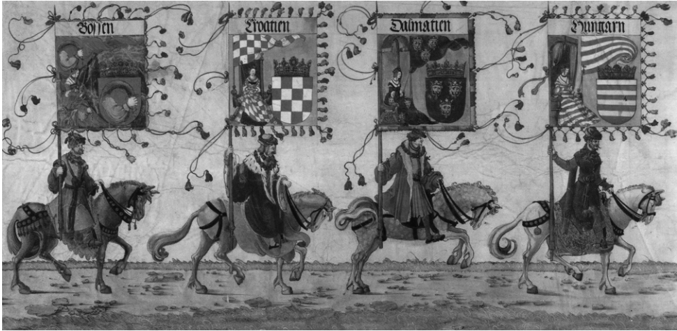
ABB. 4: Die Fahnen von Ungarn, Dalmatien, Kroatien und Bosnien im Triumphzug Kaiser Maximilians I..

erhalten, und zwar nach unseren gegenwärtigen Kenntnissen erstmals auf dem 1499 vollendeten Wappenturm in Innsbruck sowie auf dem von Jörg Kölderer angefertigten, bereits erwähnten Triumphzug [Abb. 4] und schließlich auf Dürers berühmter Ehrenpforte. Dies wird unbestritten auch dadurch bestätigt, dass Bosnien in der Wappenrepräsentation der Dynastie bis zum 20. Jahrhundert mit diesem Wappen symbolisiert wurde. So stand es in den 1550er-Jahren auf dem erwähnten Habsburger Pfau, auf der Fahne zu Ferdinands Begräbnis in Prag 1565 und in Francolins Wappenbuch genauso wie zuletzt auf dem Zinnsarg Kaiser Rudolfs Anfang des 17. Jahrhunderts. 20 Wir können es allerdings auch auf der 1679 aufgestellten Pestsäule auf dem Wiener Graben sehen. Mehr noch: Von der ungarischen Krönung Maximilians von Habsburg im September 1563 in Pressburg an kam dieses Wappen — im Gegensatz zur alten Jagiellonenpraxis — auf die jeweilige Krönungsfahne Bosniens an den ungarischen Krönungen, wie die farbige Darstellung des vor kurzem entdeckten Krönungsordo Ferdinands II. im Juli 1618 in Pressburg zeigt [Abb. 5]. 21