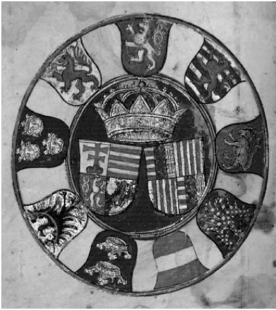
ABB. 2: Die Wappenreihe im Chronica Hungarorum des Johannes Thuróczy, 1488.

Bestattung von Matthias Corvinus im April 1490 in Stuhlweißenburg nicht fehlen. Er machte mit Vorliebe Gebrauch davon, diese Wappen oder zumindest einen Teil von ihnen auf den Exemplaren seiner berühmten Bibliothek, der Bibliotheca Corviana darzustellen. Ein glänzendes Beispiel der gleichen Bestrebung liefert auch die ihm gewidmete und 1488 erschienene Chronica Hungarorum des Johannes Thuróczy [Abb. 2]. 9 Wir können fast sicher sein, dass dies auch bei der Beisetzung von König Wladislaw im März 1516 in Stuhlweißenburg nicht anders war, denn die Jagiellonenherrscher setzten die Bestrebungen von Matthias Corvinus mit Vorliebe fort.