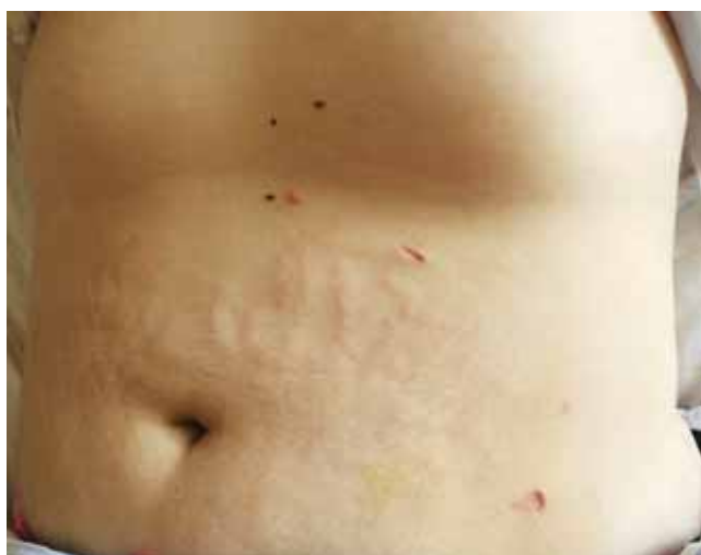
2. ábra | A kozmetikai eredmény 4 héttel a műtét után

Egyes szerzők a recidíva elkerülésére a köldök kiirtását is szükségesnek tartják [17], mások a hólyag részleges reszekcióját vélik indokoltnak az esetleges malignus átalakulás megelőzésére [18].