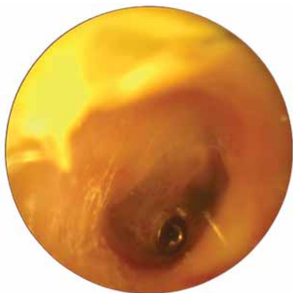
1. ábra | Grommet a dobhártyában