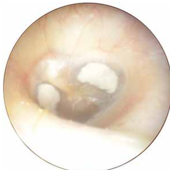
2. ábra | Meszes plakk a dobhártyában

deltünk be kontrollvizsgálatra, ebből 312-en jelentek meg. Betegeinknél kérdőíves felmérést (l. 1862. oldal), mikroszkópos dobhártyakép-vizsgálatot, tympanometriát, ETF1–2 és hallásküszöb-vizsgálatot végeztünk. Az 1. táblázat megmutatja, milyen műtéti típusok fordultak elő a kontrollvizsgálaton megjelent betegeknél, zárójelben az osztályon grommetet kapott összes beteg műtéti megoszlása szerepel. 73%-ban kétoldali tubusbehelyezés történt, és az egy időben oki terápiaként végzett egyéb műtét 96%-ban adenotomia volt. A csak tympanomeatalis tubust kapott gyermekeknél már korábban történt az adenotomia, illetve néhány esetben az általános állapotuk nem tette lehetővé az adenotomia elvégzését (alsó felső légúti hurut, szájpadhasadék stb.).