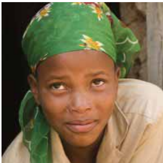
7. ábra | A lesothói lány

mes kést rántott, és többször gyomron szúrta a lányt, a spermiumok ekkor kerülhettek a hasüregbe, illetve a reprodukciós szervekhez. Az eset leírása neves szaklapban jelent meg [14] (7. ábra).