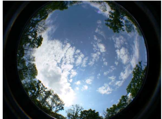
2. ábra. Kör alakú, 40 m átmérőjű lék