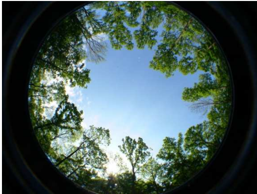
1. ábra. Kör alakú, 20 m átmérőjű lék